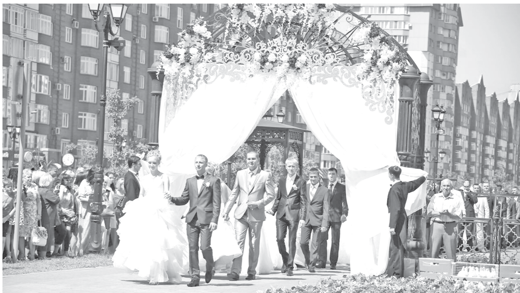
Молодожены получили льготные кредиты на покупку квартиры на 20 лет без процентов и первоначального взноса. Уже в первом квартале 2016 года они смогут отпраздновать новоселье.

Накануне Дня металлурга Аман Тулеев два дня работал в Новокузнецке, где принял участие в торжествах по случаю праздника, открыл новый ЗАГС и вручил новокузнецчанам палки для скандинавской ходьбы