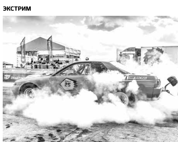
Гонщики в Спиченково дали жару!