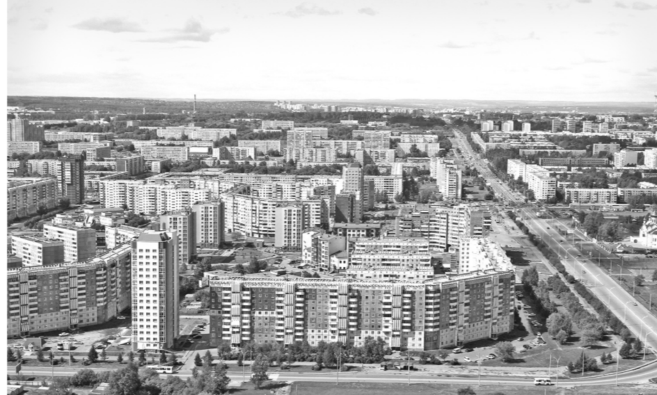
Спрос на квартиры в новостройках по-прежнему высокий.