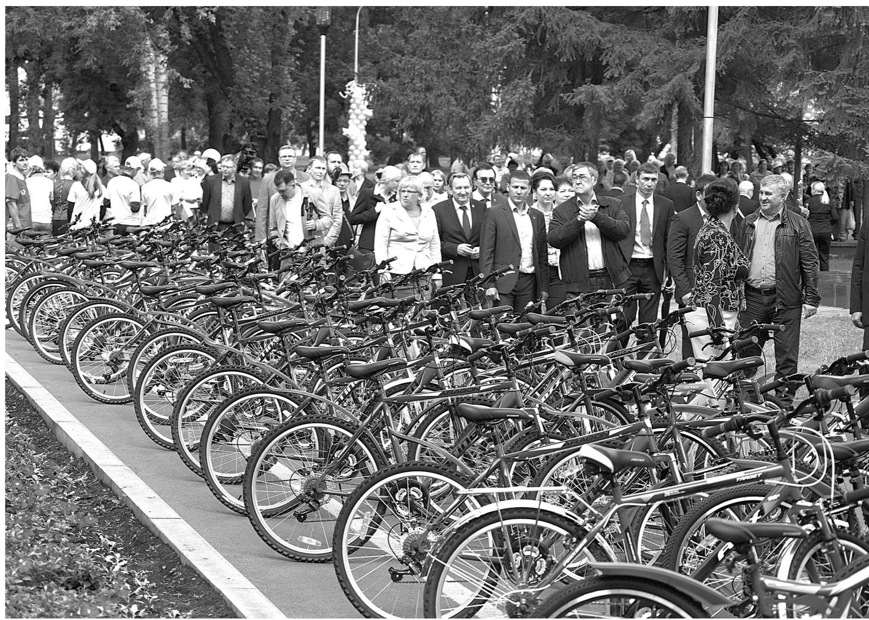
Почти три тысячи велосипедов бесплатно получили дети Кузбасса в рамках новой областной акции.

В конце прошлой недели Аман Тулеев посетил с рабочей поездкой Новокузнецк и Прокопьевск