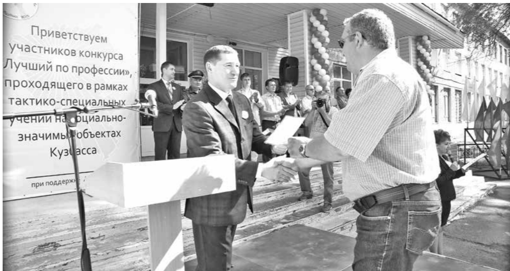
Участники конкурса получают разнарядку.

Извещение о проведении торгов в форме аукциона, открытого по составу участников и по форме подачи предложений о цене имущества. Организатор торгов: ИП Тузовская Н.И.