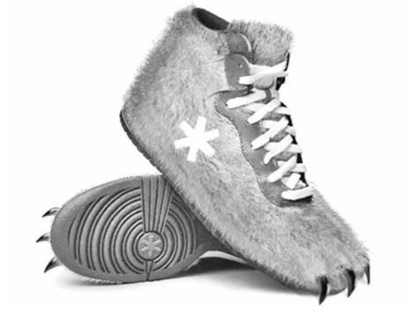
Вот такие оригинальные синие кеды ручной работы...