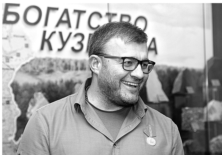
■ Фото Федора Баранова.

После рабочих часов в Ваганове, пролетевших так плотно и быстро, что актеру было не до угощения молоком (хотя, по