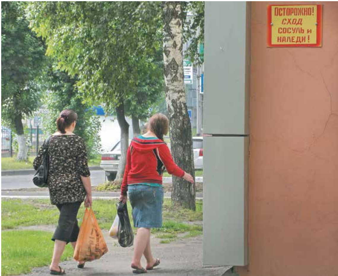
■ Не боятся наши леди ни сосулей, ни наледи!