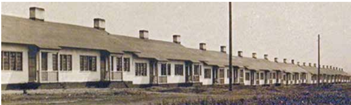
■ Дом, построенный ван Лохемом: невиданный для 20-х годов комфорт с водопроводом и туалетами. Кемеровчане прозвали его «колбасой».