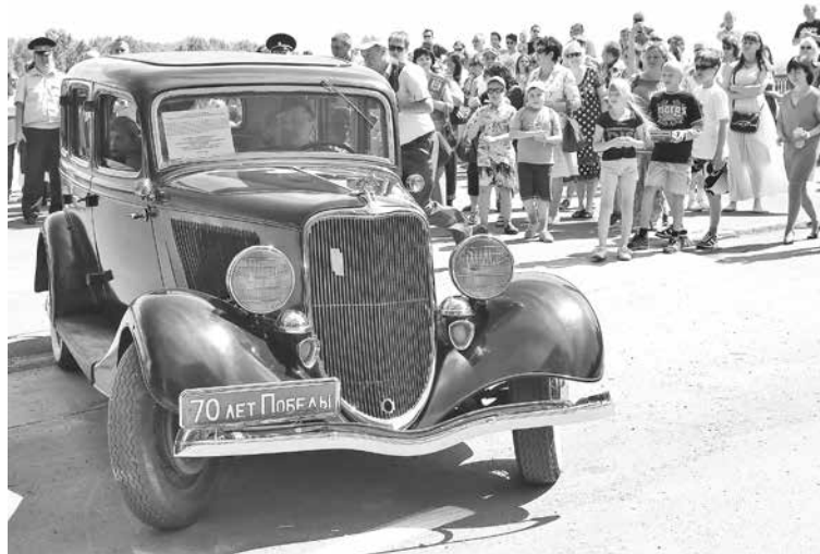
■ Прокатиться на «машине Жукова» хотят многие!

Так что можно говорить, что в Кемерове появилась новая свадебная традиция: помимо объезда мостов и возложения цветов к Вечному огню, жених и невеста хотят проехать в «машине Жукова». Говорят, это принесет счастье! Акция будет длиться как минимум все лето. И автораритет «под парами» ждет пассажиров в выходные дни с 11.00 до 15.00. Так что нужно успевать... пожениться!