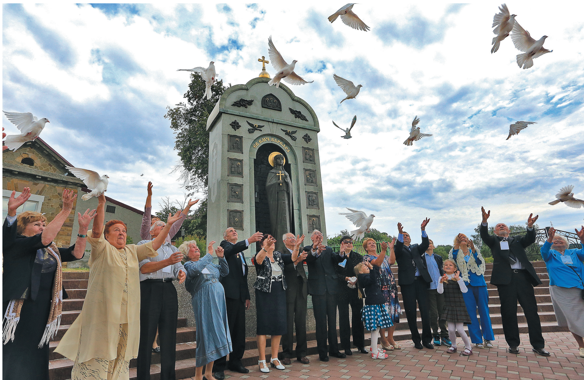
■ Семьи-юбиляры отпускают в небо белых голубей на удачу.