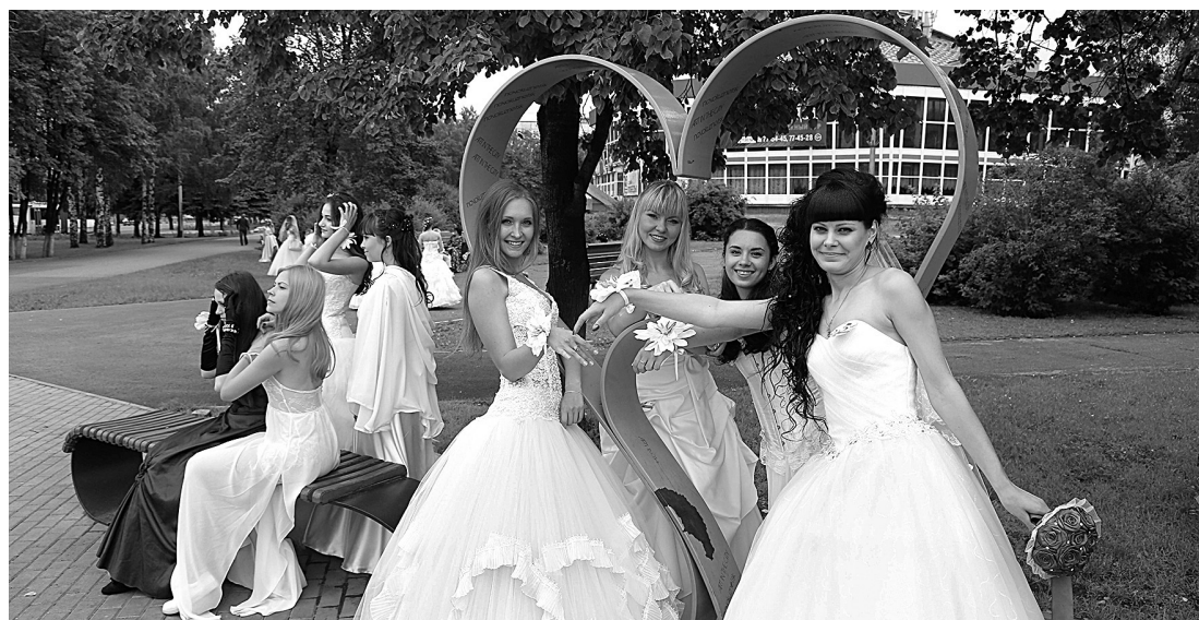
■ Участницы парада невест.