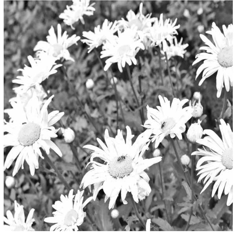
Нивяник крупноцветковый.