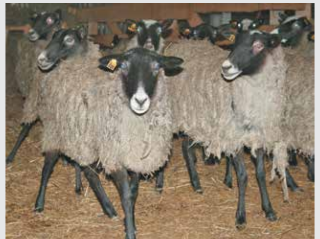
■ Сейчас овцы – это только не ценный мех...