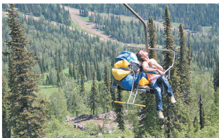
■ Подъем на гору Зеленую: быстро и с пользой.

Поэтому отельеры напрямую заинтересованы в расширении туристического потока. Для этого у гостиниц, что у подножия горы Зеленой, прямо на улице открывают бассейны с подогревом, работают бани, СПА-залы, построили скалодром, здесь же можно поиграть в теннис, волейбол, баскетбол, пейнтбол, покататься на велосипеде и квадроцикле. Ну и, конечно же, посетить главную достопримечательность этих мест – горы. Кто-то просто ненадолго поднимается туда на прогулку. Но есть и любители настоящих походов – они уходят к вершинам Мустага, соседней горной гряды... Это уникальные места, где можно за один день побывать в разных природных зонах. И мы, в очередной раз приехавшие в Шерегеш, не сомневаемся: у туризма летом здесь большие перспективы.