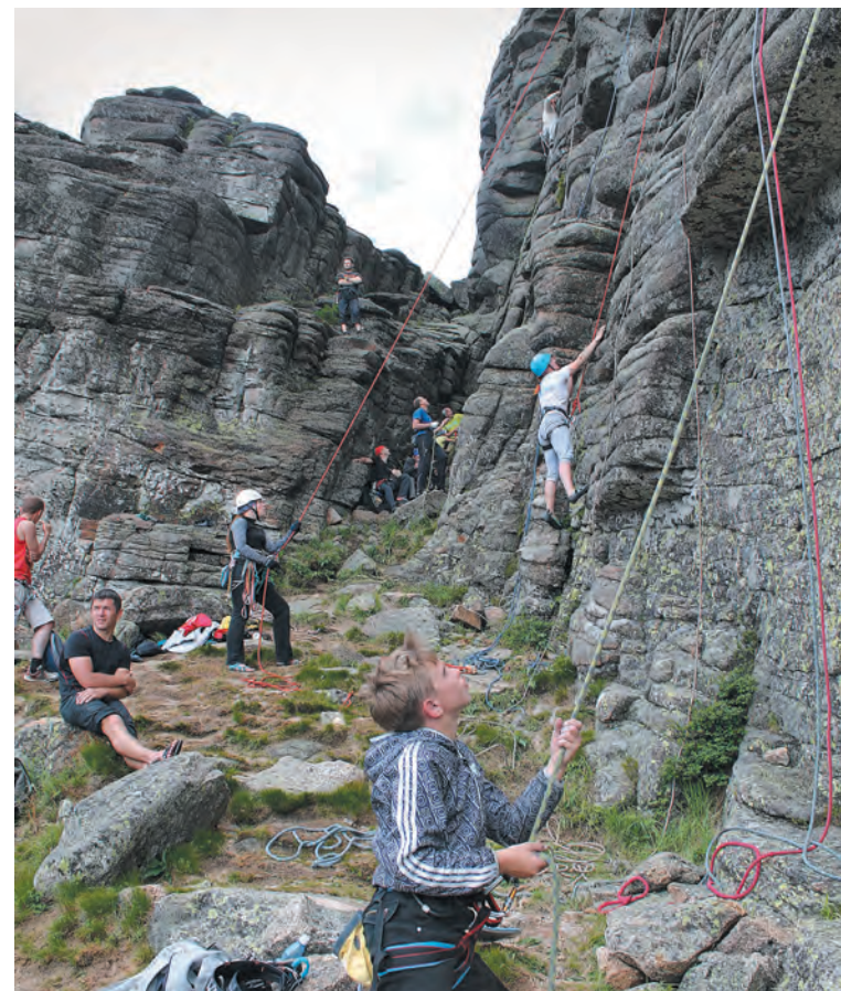
■ Останцовые скалы на Мустаге – место паломничества альпинистов со всей Сибири.