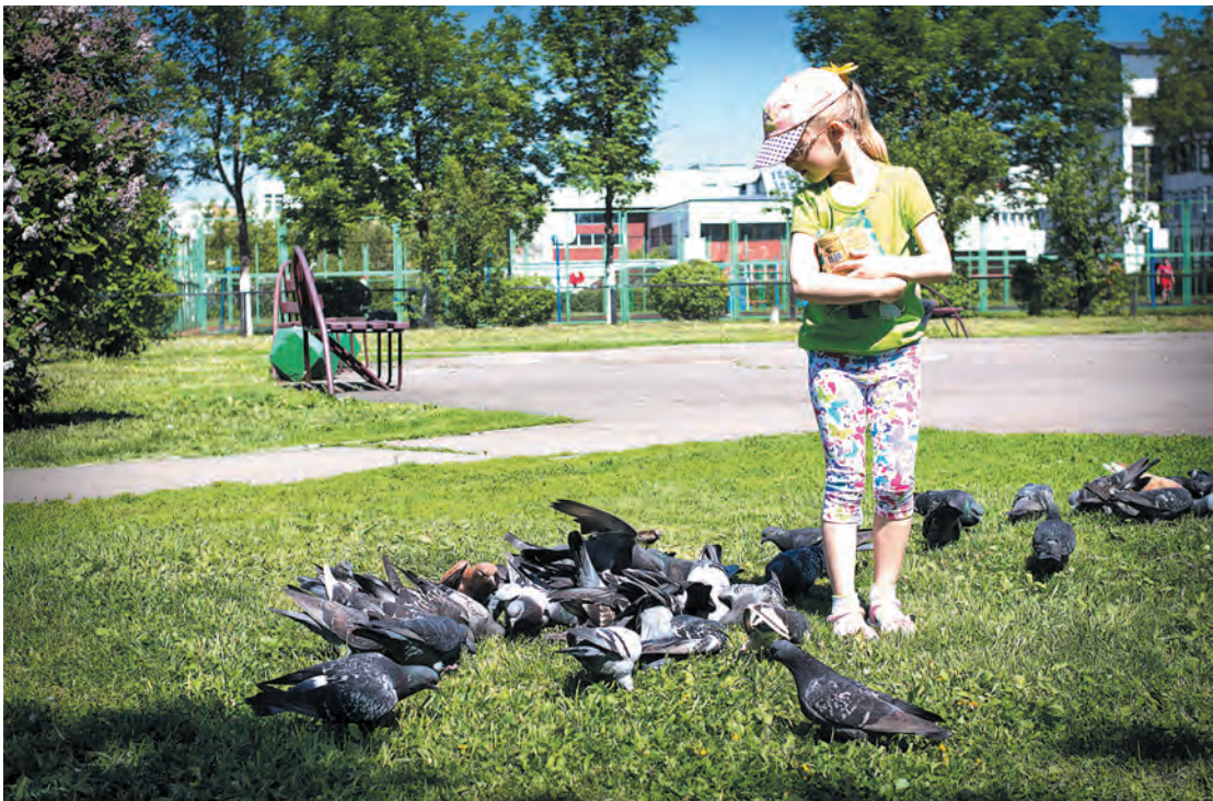
■ Урок по окружающей среде.