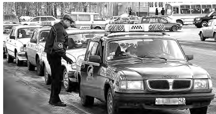
■ Теперь скорость подачи такси новокузнецким клиентам увеличится.

Это позволит избежать и недобросовестной конкуренции: чтобы не было ситуаций, когда,