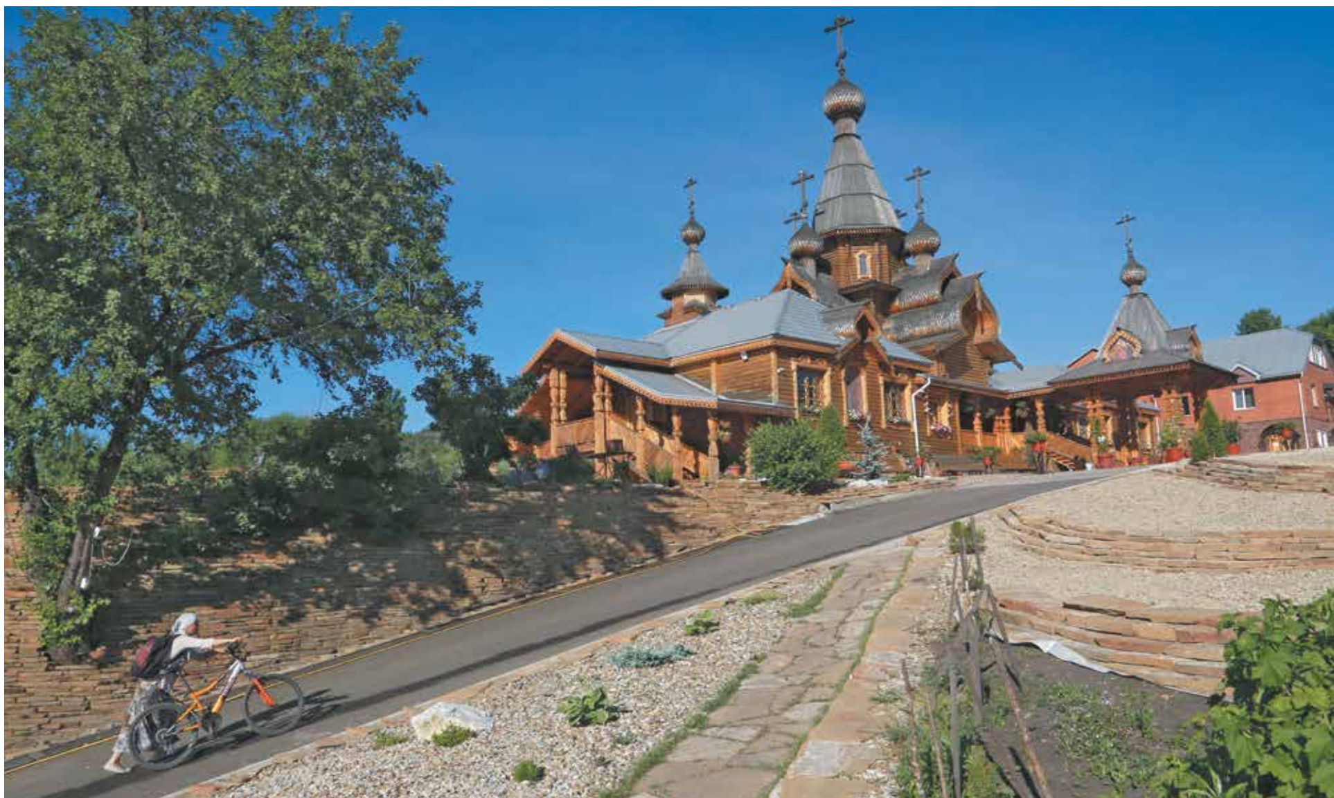
Дорога к храму в Новокузнецке становится все живописней.