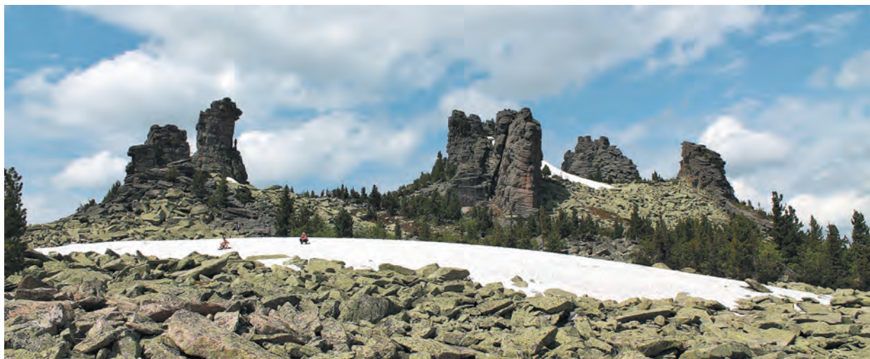
■ На вершинах Зеленой и Мустага снег лежит почти до середины лета.

Специалисты убеждены: будущее – за внутренним туризмом. Пока же складывается парадоксальная ситуация: некоторые наши земляки – любители путешествий – уже не раз успели побывать на популярных курортах за границей, а вот с красотами родного края, к сожалению, незнакомы. Поэтому наша газета и начинает реализацию нового «краеведческого» проекта: мы планируем рассказать о том, где можно отдохнуть в нашей области, и помочь кузбассовцам лучше узнать малую родину с ее удивительным туристическим многообразием.