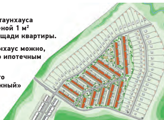
Жилой район Лесная Поляна, жилой комплекс «Таежный».

* В рамках жилого комплекса «Таежный» предлагаются и участки под индивидуальную застройку.