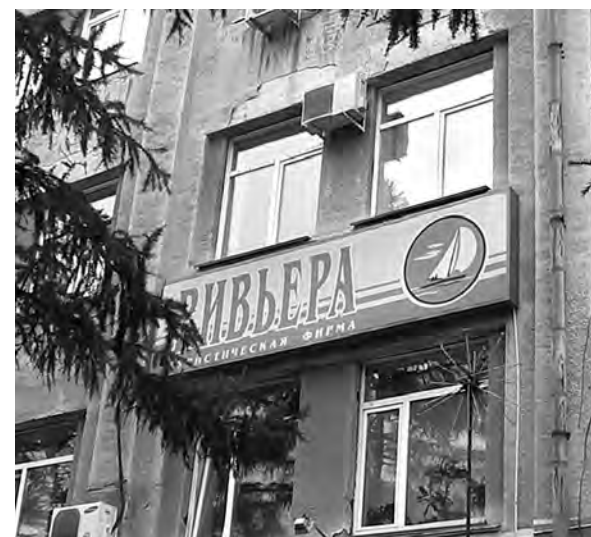
■ Согласно материалам уголовного дела, потерпевшими от турфирмы «Ривьера» считаются три десятка человек.