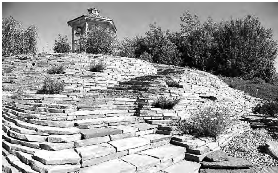
■ Фото Ярослава Беляева.