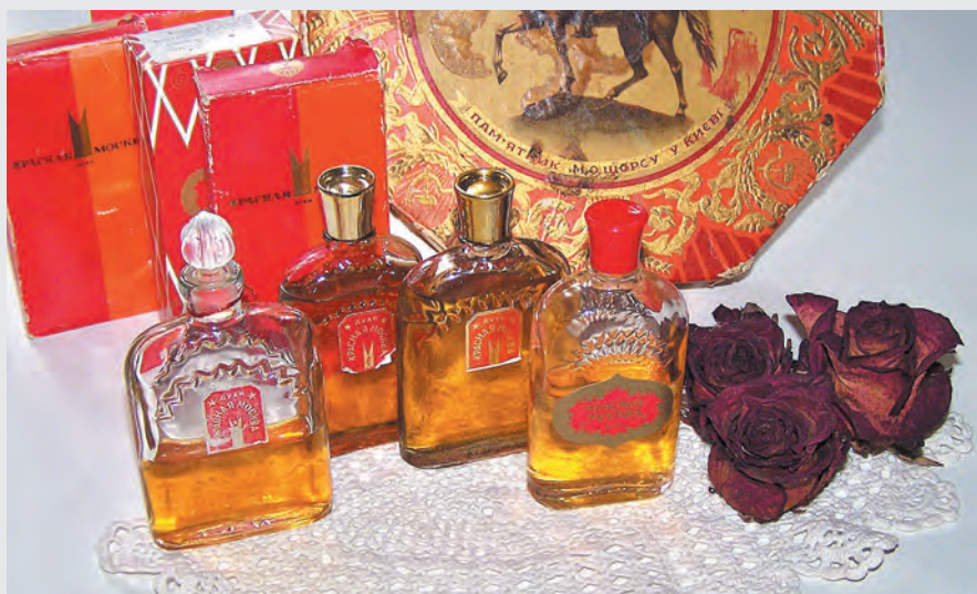
■ Еще до войны наши женщины могли выбирать духи и косметику.