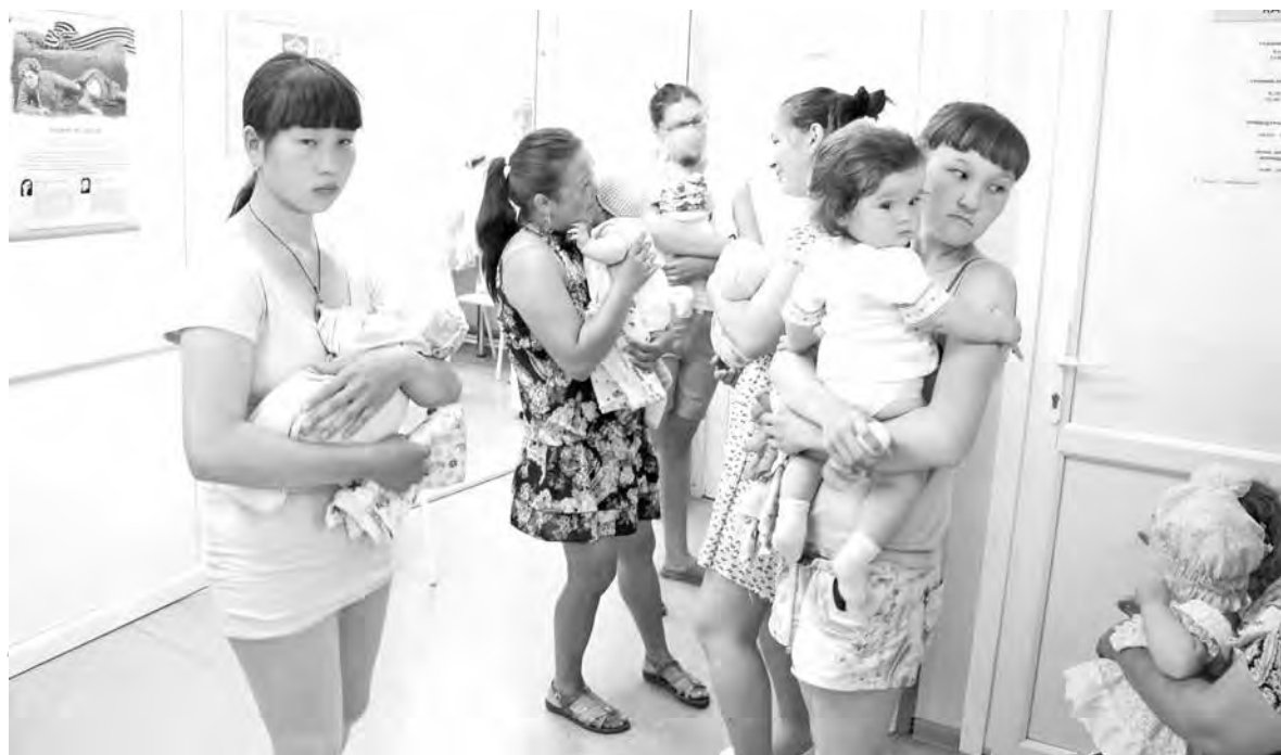
Жители села Беково на приеме у врачей.