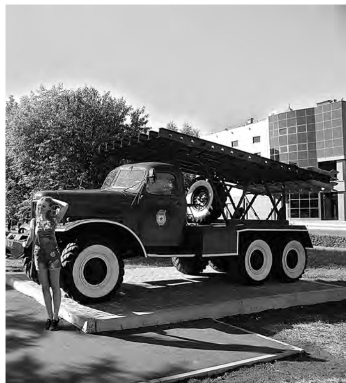
■ На фоне легендарной «катушки».