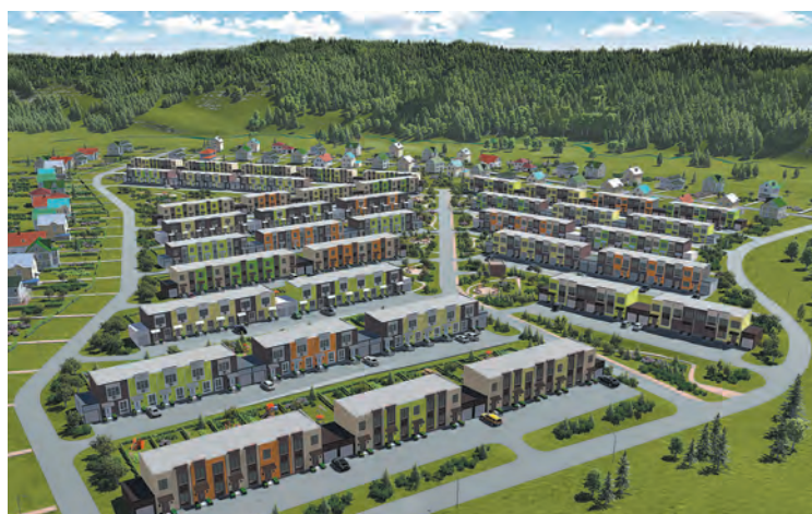
Каждый таунхаус в жилом комплексе «Таежный» – это два этажа и земельный участок, а также, по выбору, собственный гараж.

Одна из ключевых особенностей – разнообразие предлагаемых вариантов жилья. Шесть разных типов таунхаусов площадью от 98 м 2 до 200 м 2 (аналог трехкомнатных квартир и более) позволят подобрать наиболее подходящий вариант.