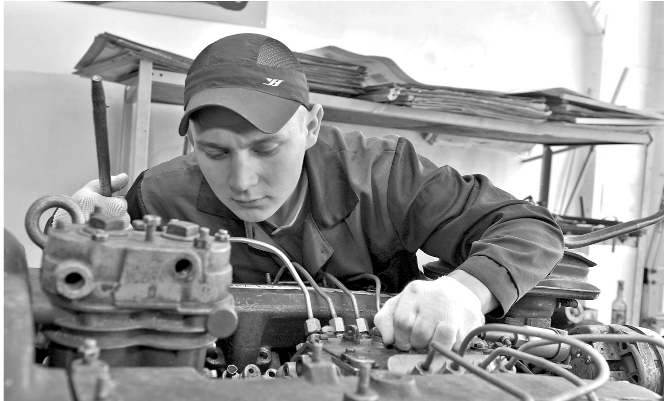
УМЕТЬ ВСЁ! Водить машину, ремонтировать ее и оказывать первую медпомощь пострадавшим в ДТП – такие умения должны были продемонстрировать студенты 17 техникумов и колледжей Кузбасса, участники областного конкурса профмастерства среди автомехаников. Конкурс прошел в Новокузнецке, на него собрались лидеры отборочных этапов из Новокузнецка, Киселевска, Прокопьевска, Кемерово, Осинников, Белова, Березовского, Полисаева и Топки. Победители были награждены Почетными грамотами с вручением денежных премий.