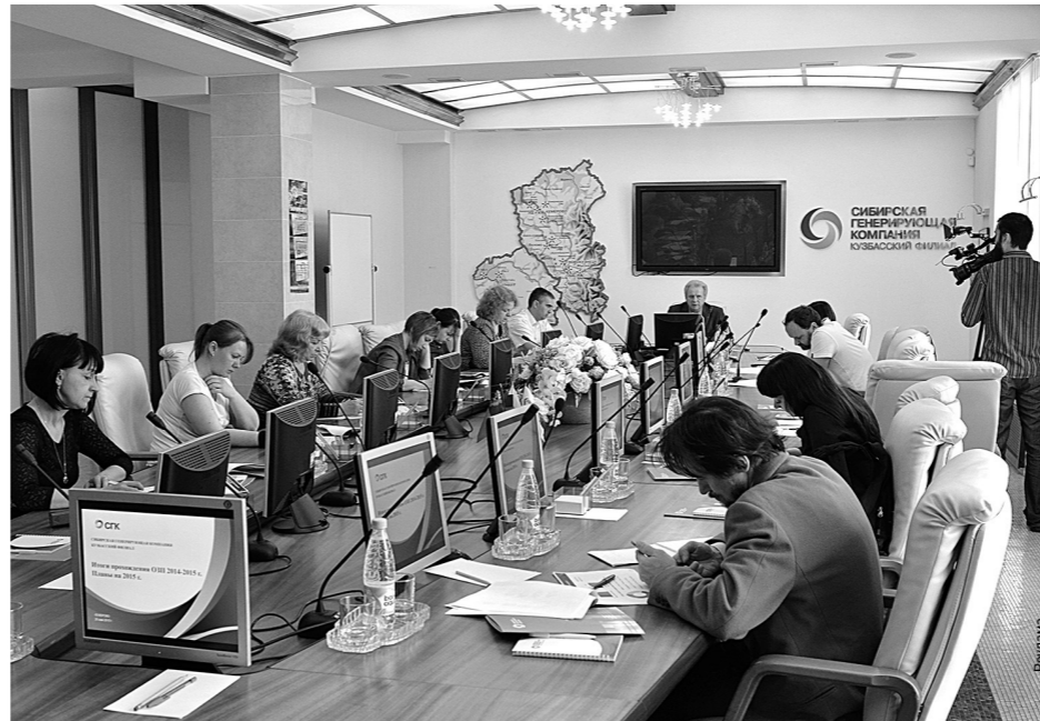
В пресс-конференции приняли участие журналисты ведущих СМИ региона.

На днях в Кузбасском филиале Сибирской генерирующей компании состоялась пресс-конференция на тему «Итоги отопительного периода 2014-2015 гг.»