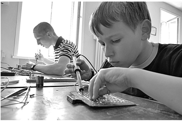
Пайка электронных схем требует и знаний, и точности движений.