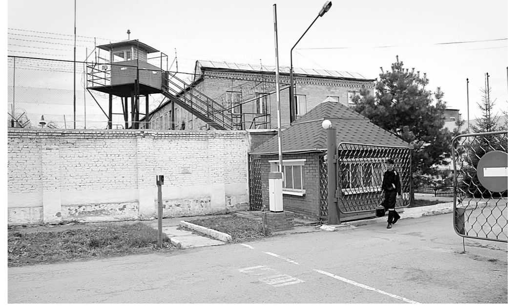
Под нынешнюю амнистию в Кузбассе попадают около 500 заключенных – из порядка 18 тысяч человек, которые в настоящее время содержатся в местах лишения свободы.