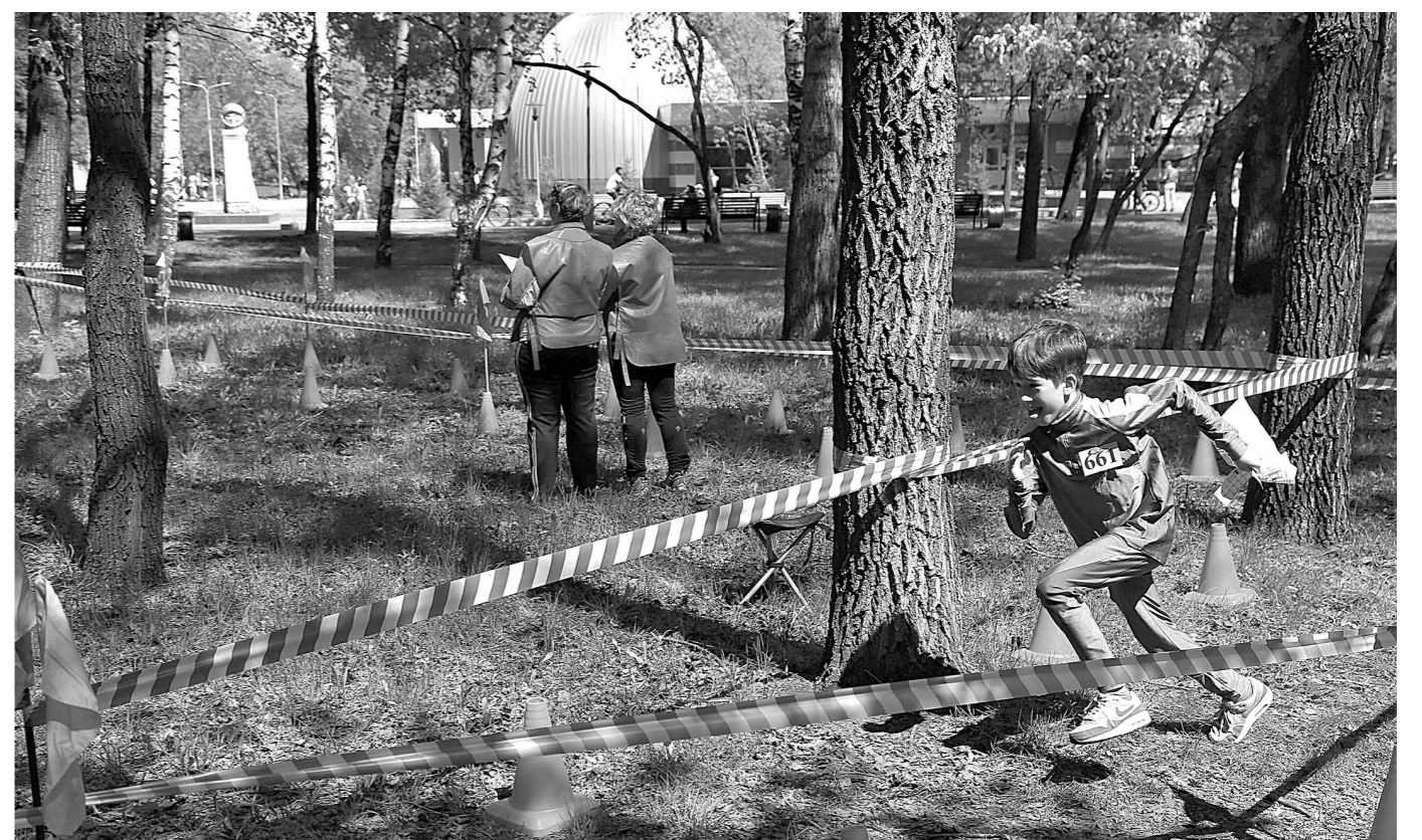
МАССОВЫЙ СТАРТ. Более четырех тысяч кузбассовцев в эти выходные приняли участие в соревнованиях по спортивному ориентированию «Российский азимут-2015». Сначала прошли отборочные этапы: в Новокузнецке, Междуреченске, Анжеро-Судженске. А уже в воскресенье — финал в Кемерове, где вышли на старт более двух тысяч человек. Среди профессионалов и любителей этого вида спорта самому младшему участнику исполнилось 7 лет, самому старшему — 60. По традиции на старте «Российского азимута» вышли и участники I этапа финала областного конкурса «Молодая семья Кузбасса-2015».