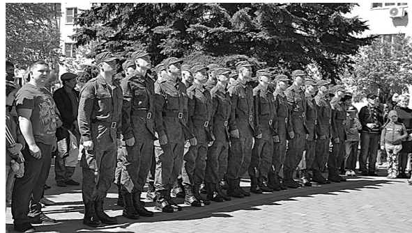
Новый призыв президентского полка из Кузбасса.