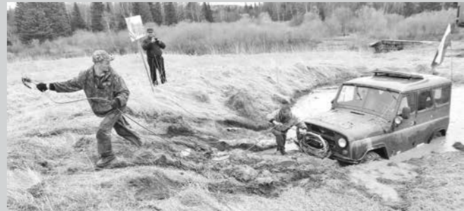
Чтобы выбраться из грязевой «ванны» у самой финишной черты, каждому экипажу пришлось основательно потрудиться.

На северо-востоке Кузбасса прошли соревнования по спортивному ориентированию на внедорожниках, посвященные 70-летию Великой Победы.