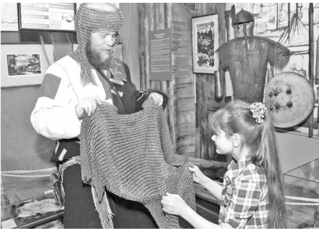
Примерить кольчугу в краеведческом музее стремились даже девочки.

На площадке над рекой организовали импровизированную танцплощадку, а по соседству дети играли в дворовые