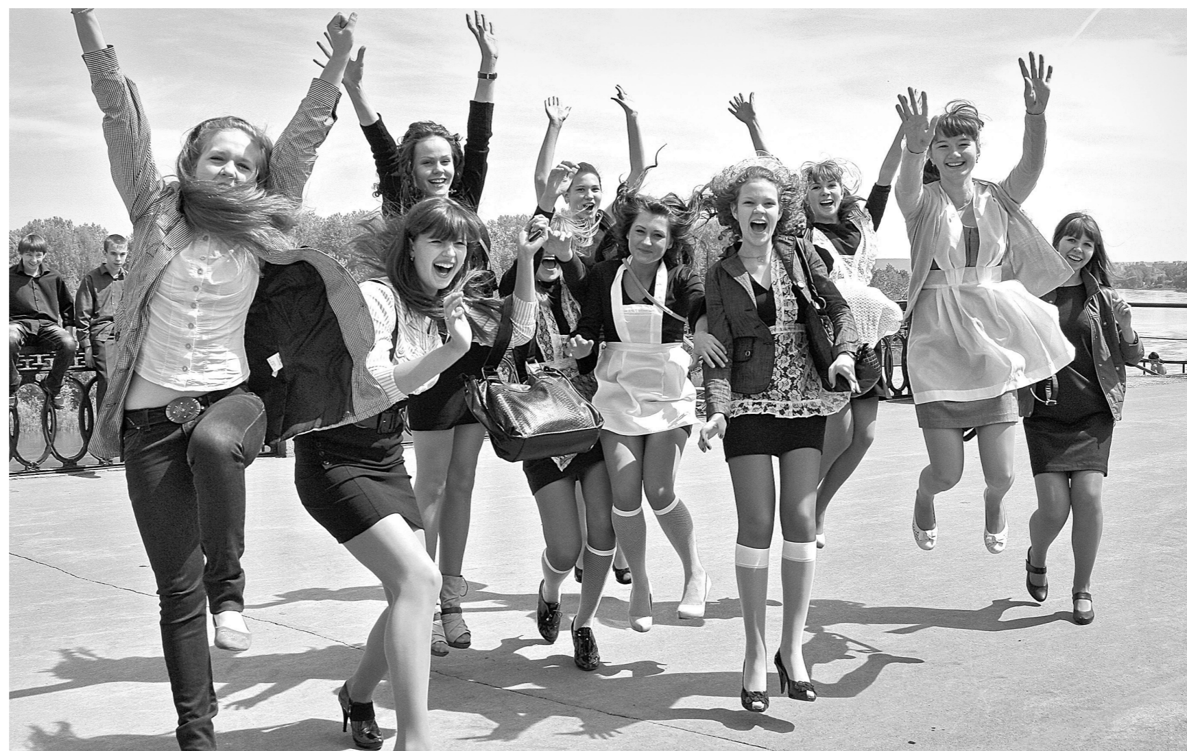
Теперь главная задача — сделать праздник для детей радостным и безопасным.

В преддверии школьных последних звонков и выпускных вечеров Аман Тулеев провел рабочее совещание со своими заместителями, где обозначил главные вопросы, которые предстоит решить: безопасность детей и выплата материальной помощи