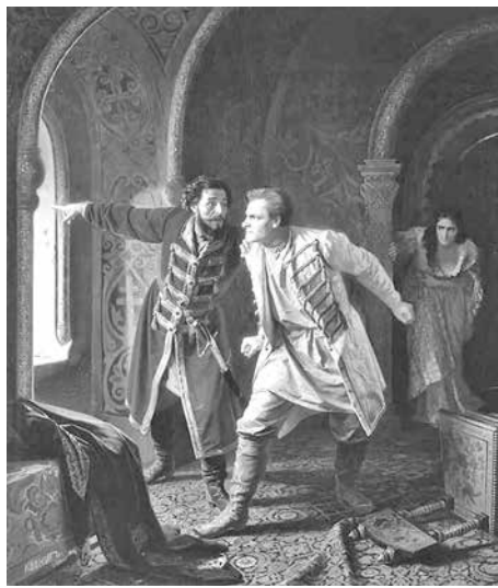
Карл Вениг. «Последние минуты Дмитрия Самозванца». (1879).

24 мая. По некоторым исследованиям (а что в истории бесспорно?) – день создания славянской азбуки. День славянской письменности. Болгаро-византийский просветитель Константин Философ, в монашестве Кирилл, перевел в 863 году на славянский язык (тогда, видимо, единый для славян южных, западных и восточных) основные богослужебные книги. Первая книга на древнерусском языке – «Остромирово Евангелие» (1056-1057) - написана кириллицей, литерными, начертанными Кириллом. На этой системе письма основан алфавит более ста языков, включая, к примеру, монгольский, но в первую очередь – алфавит языков всех народов СССР.