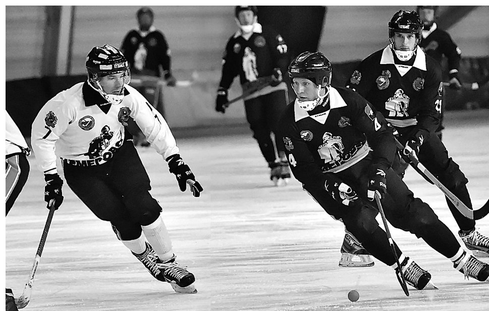
Турнир смешанных команд в рамках фестиваля русского хоккея – важнейшая составная часть системы подготовки резерва для команды мастеров «Кузбасса».