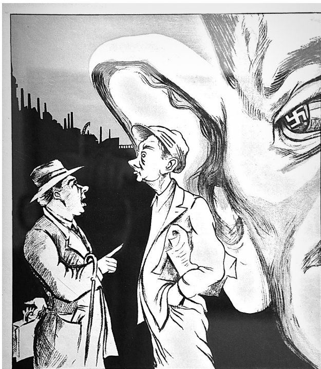
Болтуны-находка для врага

«Фашизм – кровавое чудовище!». А изображен тшедушный зверек, насаженный на штык, и впрямь окровавленный... Но так или иначе образ запоминается. Еще бы: создал его Александр Лактионов, автор знаменитого «Письма с фронта», полотна блистательного и зловещего.