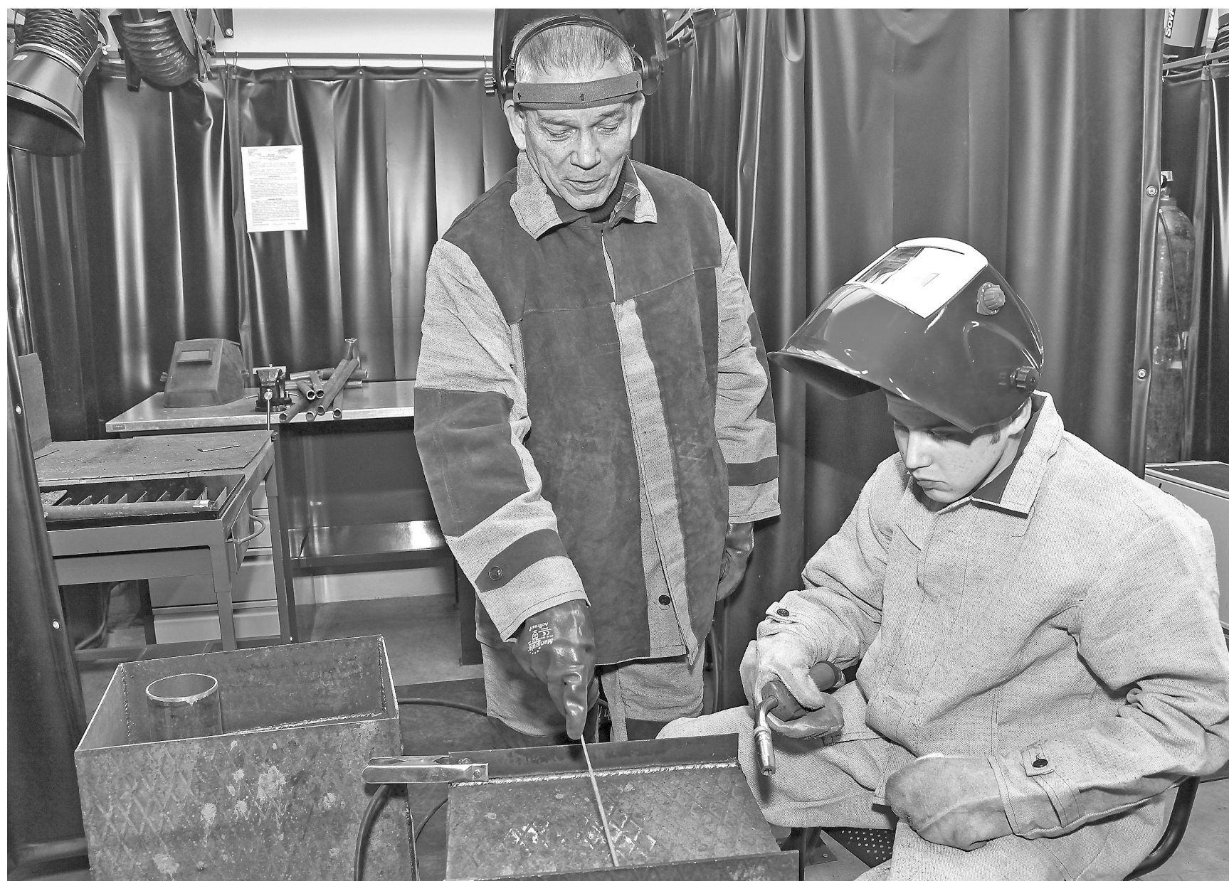
Профессию сварщика помогут освоить опытные мастера. А с ней нетрудно будет подыскать оптимальное место работы.

В Кузбассе остро востребованы рабочие специальности: они составляют около 70% в банке вакансий