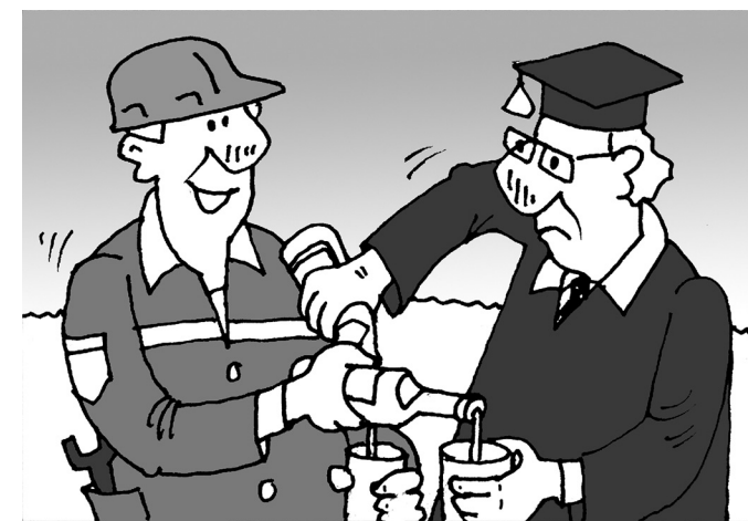
Рисунок Андрея Горшкова.

– Хорошо подкают работники интернет-пространства (сисадмины, программисты, дизайнеры). Я дружила с одним виртуально (он был из другого города). Так такая перепуска у нас была, такая романтика! Но только мой друг почему-то долго не хотел в реальной жизни знакомить-