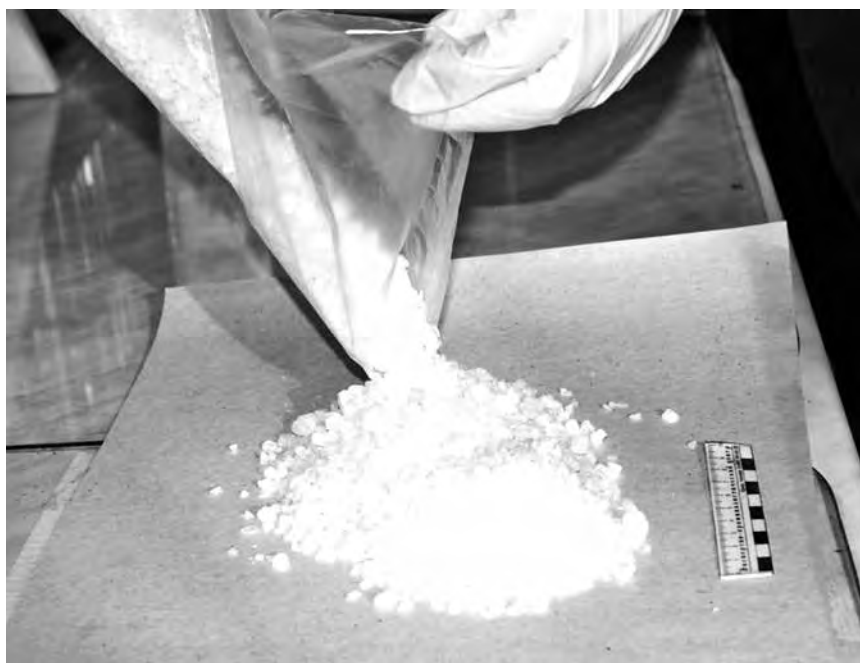
■ В 2014 году сотрудники кузбасской полиции изъяли на территории Кемеровской области 8 кг синтетических наркотиков - это в десять раз больше, чем в 2013 году.

«Соль» - синтетический наркотик, который появился на «черном рынке» относительно недавно. Поскольку даже после однократного приема возникает непреодолимая потребность употреблять его снова и снова, сами наркозависимые называют его «жадным».