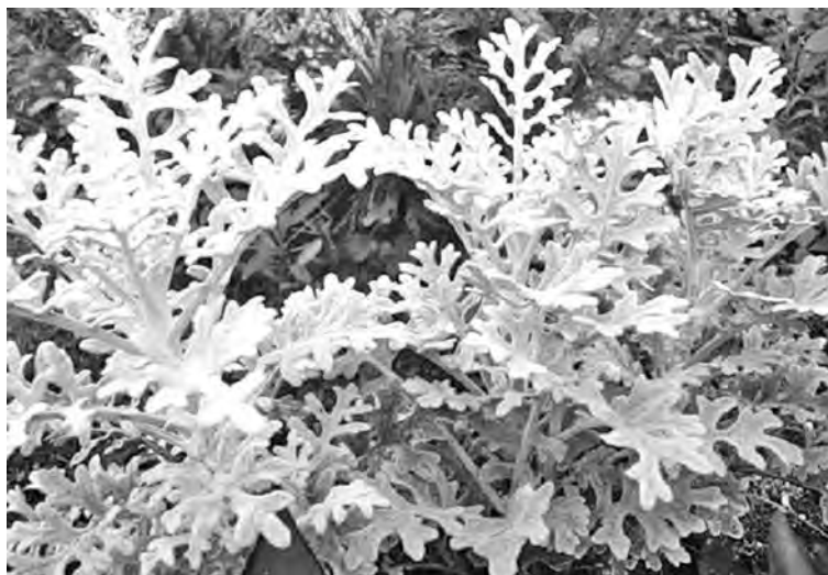
■ Цинерария приморская.