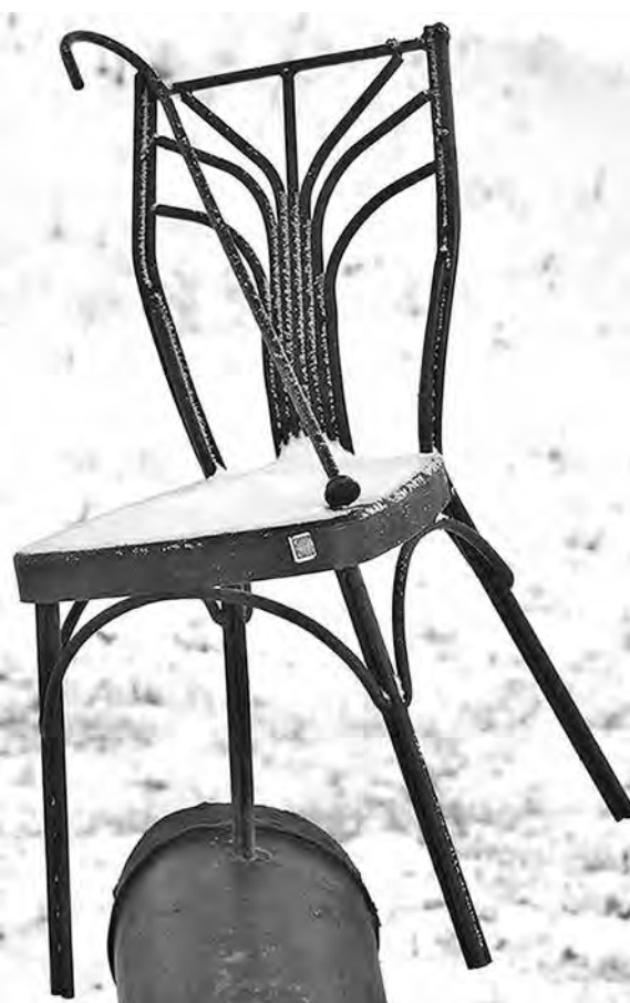
■ Стул возле «Извоза».

Транспорт имеется в виду гужевой, зато связь – космическая. Притомская набережная кончается пологим спуском к Томи и устью Искитимки. Старые кемеровчане называли это место «извоз»; как нетрудно догадаться, здесь находилась стоянка щегловских извозчиков. Впрочем, если перевести взор несколько выше, обнаружится, что Набережная вовсе не кончается: ее парапет уходит плавной дугой в сторону филармонии. Этот парапет и ограничивает холм, который застройщики назвали когда-то «Притомским участком». Ныне он плотно застроен сверху и снизу, но перепад высот сохранился.