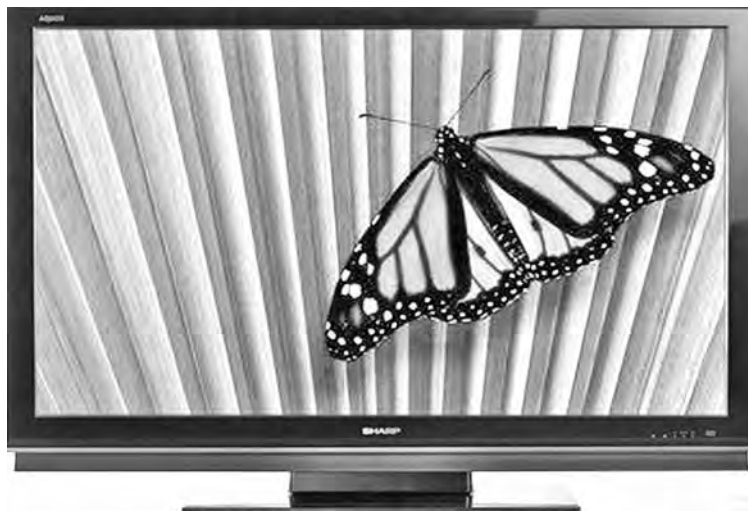
■ Купленные впрям телевизоры уже продаются на сайтах бесплатных объявлений.

Как сообщают наши агенты, объяснений тому несколько. Во-первых, миновал предновогодний бум и ажиотаж, во-вторых, торговые сети тоже сориентировались в ситуации, и ценники на товар во многих из них выглядят уже не так пугающе, как месяц назад. Во-вторых, цены хоть и