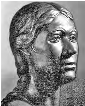
■ А Алтайская принцесса была такой.