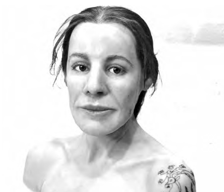
■ Так выглядела третья сибирская принцесса.