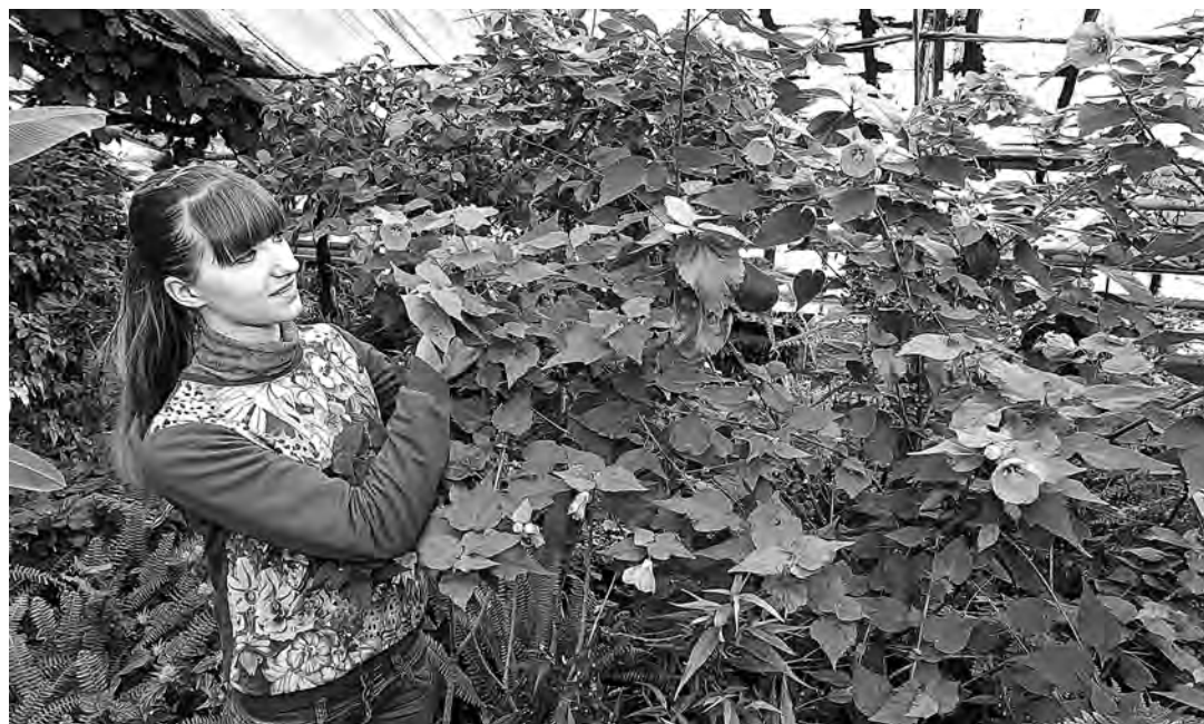
■ Несмотря на морозы, теплолюбивые растения держатся молодцом.