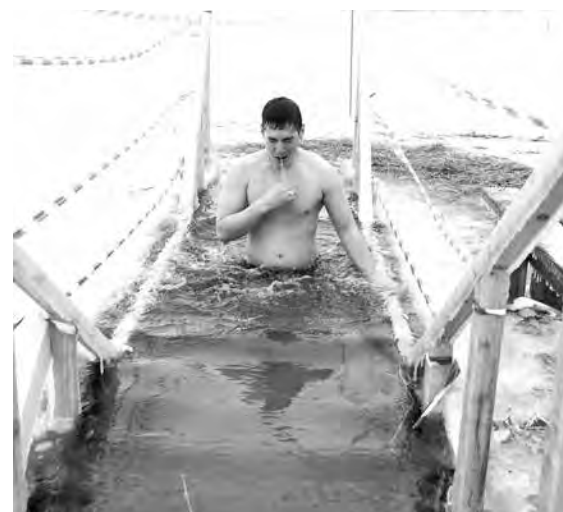
■ Наверняка в следующем году желающих окунуться в холодную воду будет еще больше.