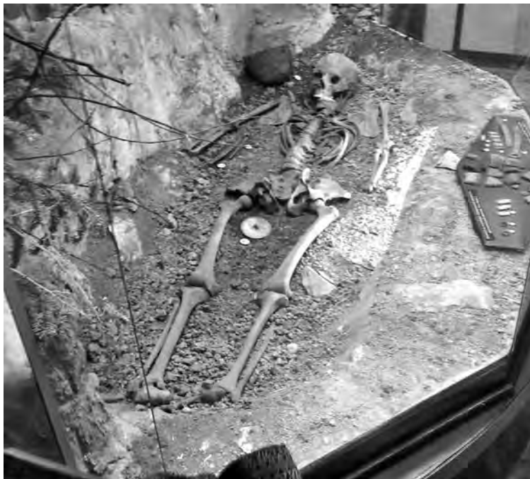
■ Кабырзинская принцесса хранится в музее Таштагола.

Третья сибирская принцесса, о которой заговорили теперь, после того как исторический музей Пфальца по новым технологиям воспроизвел ее лицо, вообще-то была открыта еще в 1990-м.