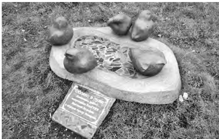
■ Воробьи у театра.

Как известно, одно из немногих в России кладбищ динозавров находится в Кузбассе, близ села Шестакова, на берегах Кии. Но палеонтологического музея в Кузбассе нет, и вряд ли скоро появится. Зато на Красной горке самосвалы, карьерные экскаваторы и транспортеры сгрудились на небольшом пятнышке, задрав клыкастые ковши и блистая свежескрашенными боками. Получилась полнозвучная рифма к кладбищу динозавров.