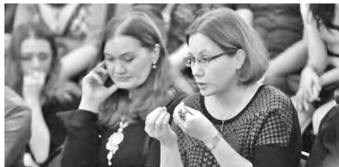
■ Публика обсуждает спектакль вместе с профессиональными критиками.