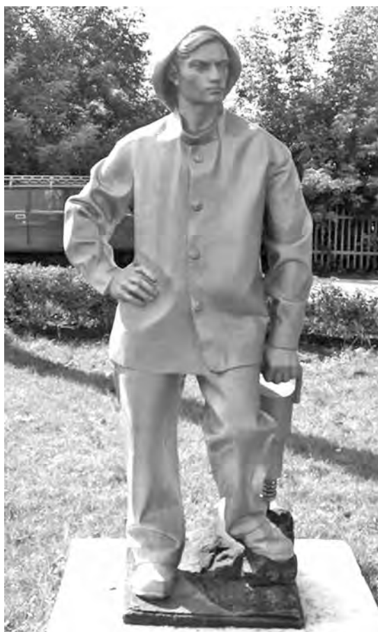
■ Шахтер на Красной Горке.