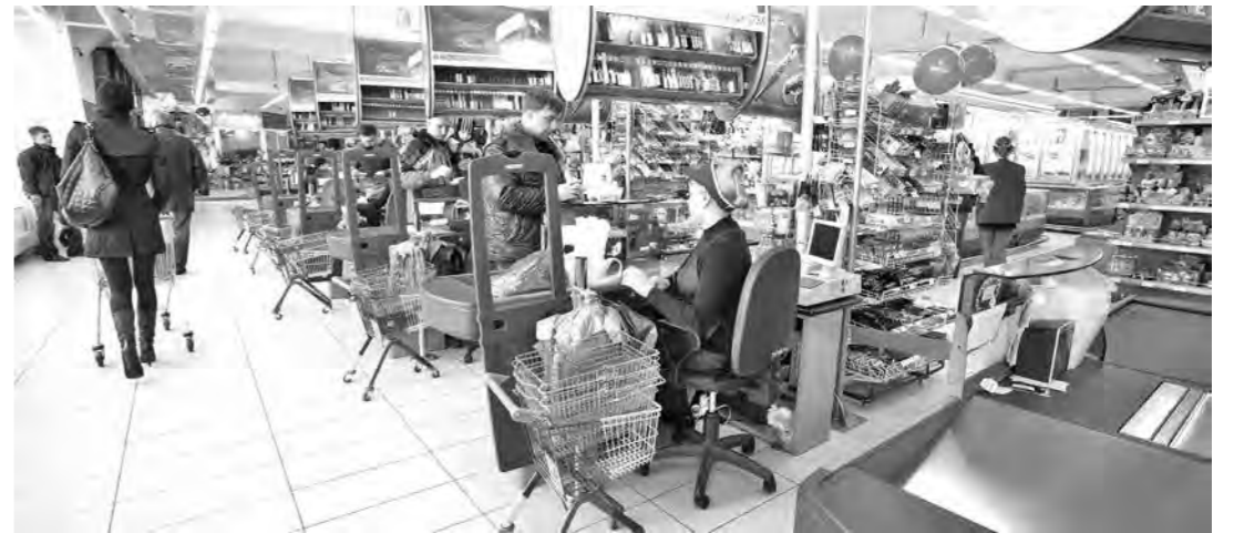
Внеплановые проверки теперь можно проводить в любом магазине страны.