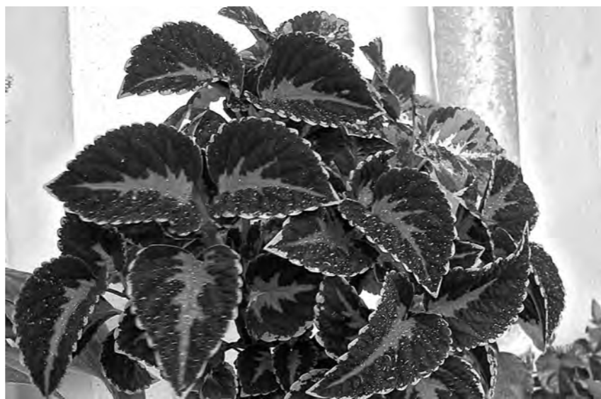
Колеус группы Волшебник – Красный бархат.

Пастельный – затейливо окрашенные листья (красивый орнамент мягких пастельных оттенков малины со сливками, охваченный широкой молочно-зеленой каймой с золотисто-солнечными бликами) придает растению карнавальную веселость.