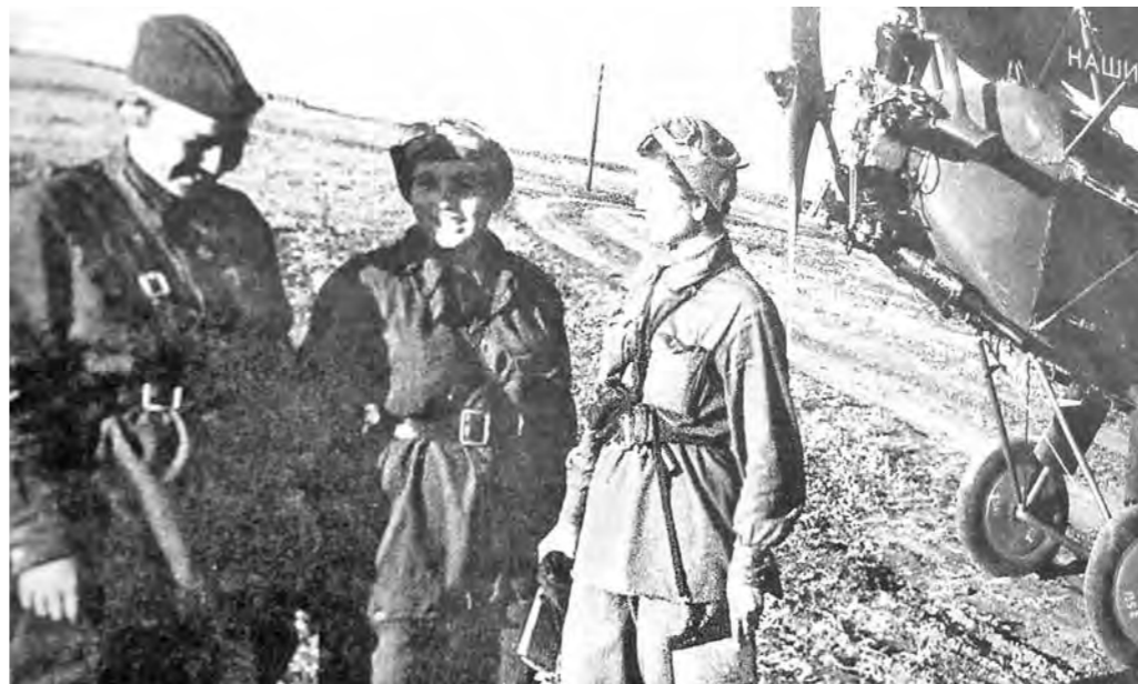
Александра в центре, слева — техник, справа — летчица. А позади — их «ласточка».

А вот «суженые-ряженые», надеялись, будут потом. Сейчас же первым делом — самолеты.