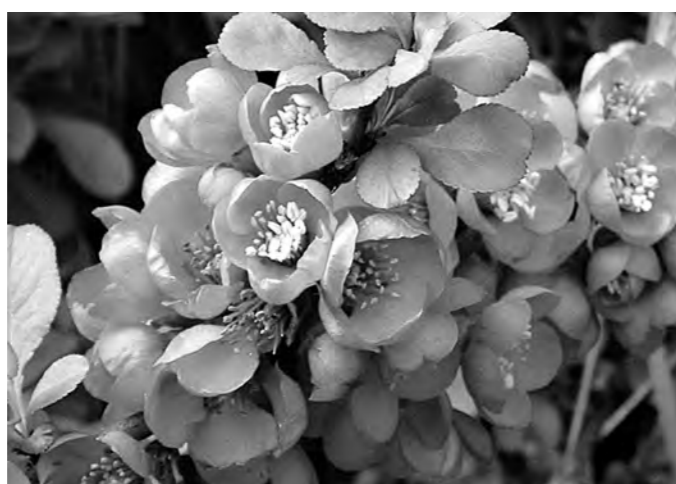
Цветы айвы японской.

Куст формируется так, чтобы он имел до 15 разновозрастных побегов. Наилучшее цветение и плодоношение дают трехлетние ветки. Обрезку ведут весной, ежегодно остав-