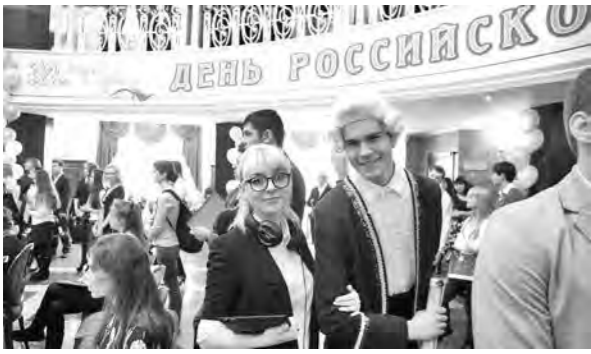
Участники губернаторского приема. Фото Дмитрия Белкина.