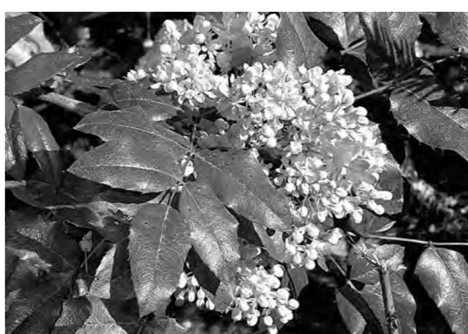
Цветы магонии падуболистной.

ля 3-4 хорошо развитых побега. Слаборослые и подмерзшие ветки удаляют, а также ветви старше 5 лет, поскольку они малопродуктивны. Длинные побеги можно укоротить. Съем плодов ведут в сентябре до заморозков, иначе они теряют вкус и аромат. В свежем виде они в пищу непригодны, а вот в заготовках, компотах и киселях – пальчики оближешь!