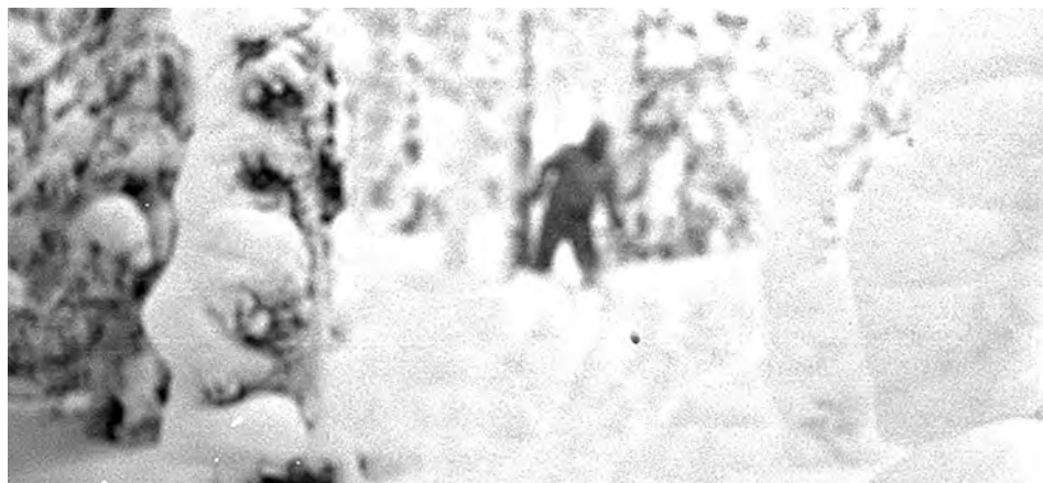
Кадр из похода «дятловцев», на нем, возможно, йети.