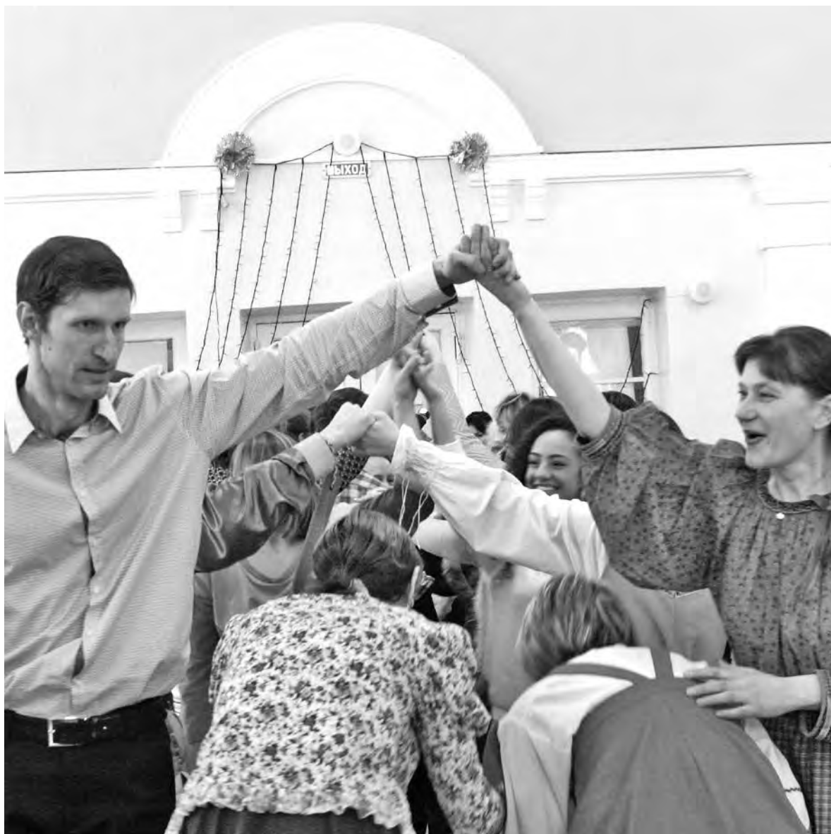
■ Народная игра «Ручеек».