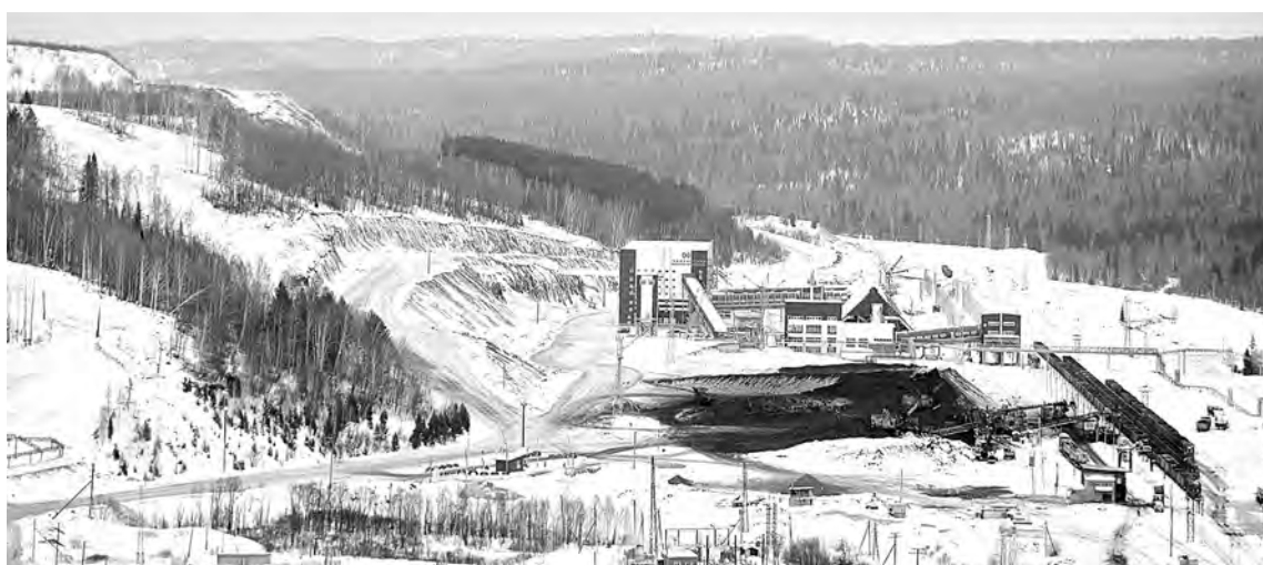
■ Новая обогатительная фабрика — это новые рабочие места для жителей Осинников, Калтана, Малиновки, Сарбалы.