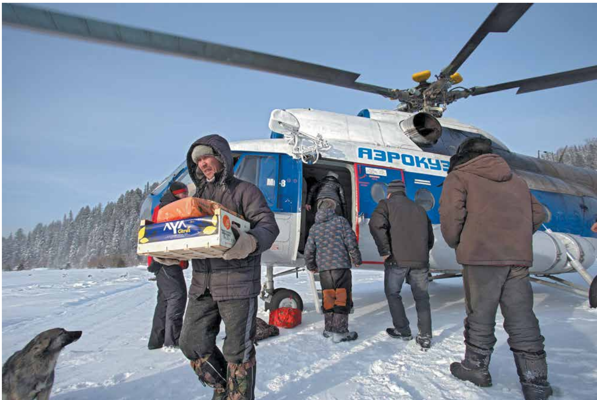
Благодаря регулярному вертолетному сообщению жители поселка Эльбеца своевременно получают все необходимые товары и продукты.