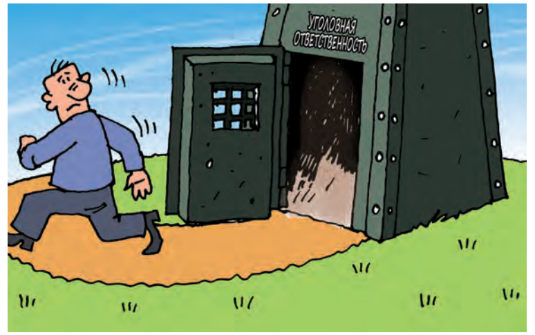
■ Рисунок Андрея Горшкова.