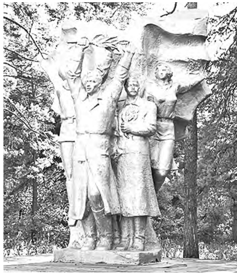
■ Памятник в Сосновом бору, на аллее Трех дивизий.