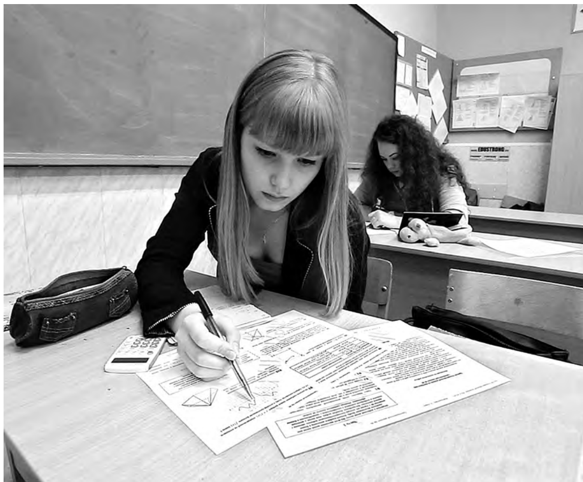
■ Задача № 1 для выпускника: осилить самый трудный школьный предмет - математику.

В период итоговой аттестации в резервные дни можно пересдать один обязательный эк-