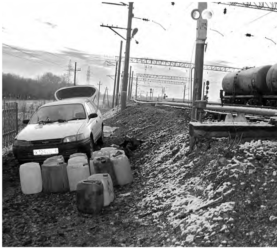
■ С помощью длинных шлангов жулики перекачивали бензин и солярку из цистерн в привезенные бочки и канистры. Когда вся тара была заполнена, расхитители тщательно маскировали свои проделки и исчезали в ночи.

Вскоре полицейские установили всех партнеров по «топливному делу», сливавших бензин и солярку из цистерн. Двое из них действительно работали на станции Ишаново осмотрщиками вагонов, двое их поделчиков тоже были железнодорожниками, хотя и с другого объекта. Однако задерживать расхитителей полицейские не спешили: появилась информация, что участники этой же группы причастны к хищениям ГСМ и на станции Бирюлинская, распо-