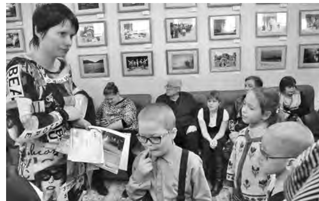
■ Открытие выставки.