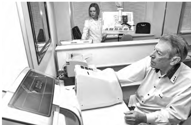
■ Электронный «рукав» сам измеряет артериальное давление и переносит эти данные в историю болезни пациента.

Напомним: реорганизация гемодиализной службы Кузбасса началась в 2013 году в рамках