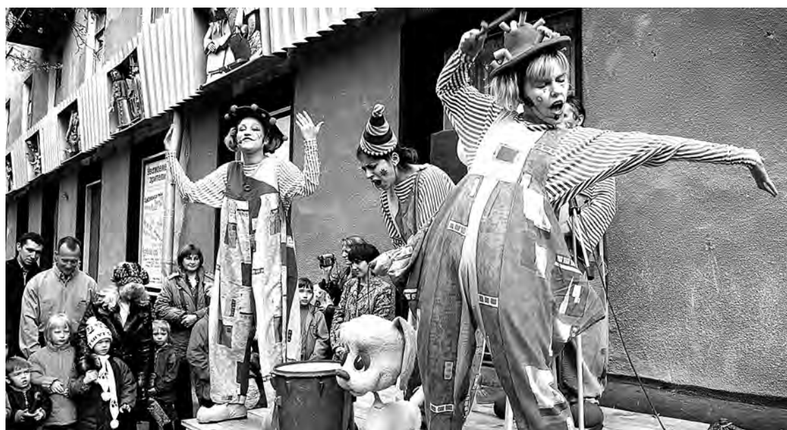
■ Умение собрать заинтересованных (а значит и «кассу») – настоящее искусство, которым профессионально владеют актеры областного театра кукол.