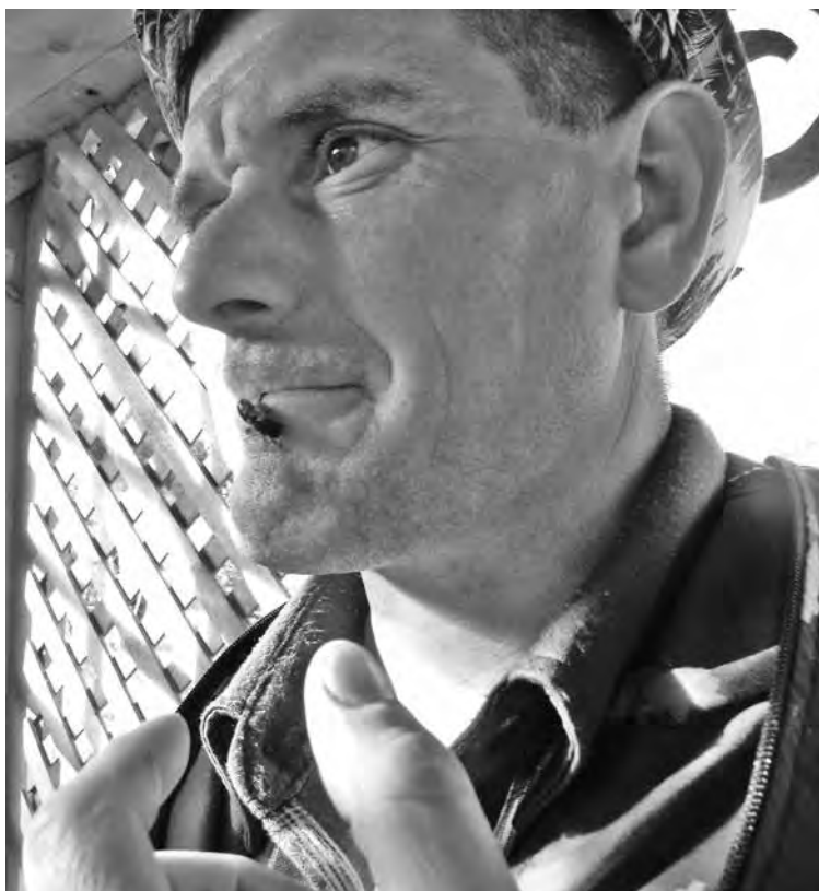
■ Пчеловод с Алтая демонстрирует: апитерапия – это совсем не страшно.

О каких именно утвердившихся в народном опыте методах идет речь, из текста документа не ясно. Поэтому специалисты управления лицензирования обратились за комментарием в Минздрав. Им ответили, что I Всемирный конгресс по альтернативной медицине состоялся в 1973 году в Алма-Ате, и там был представлен список из 135 существующих методов, а в настоящее время их известно уже более 150. Однако попытка классифицировать данные методы была предпринята только