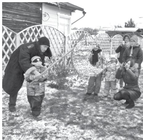
■ Мексиканская забава пришлась по душе и кемеровским ребятишкам.

- Затрат - минимум. Требуется только большой воздушный шар, банка бумажного клея ПВА, пачка старых газет, гофрированная цветная или упаковочная бумага для внешнего оформления, бумажный скотч для заделки отверстия (в которое помещается начинка-сюрприз), кусок проволоки и полоска плотного картона (служит фурнитурой для крепления изделия к потолку), - рассказывает Наталья. - Чем больше слоев бумаги, тем креп-