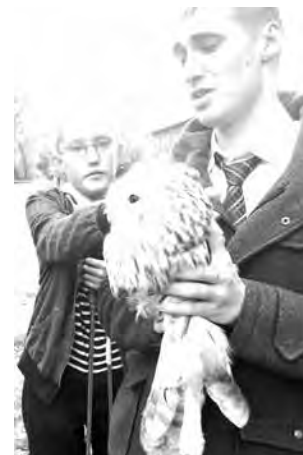
■ Сова чудом осталась жива.

Для людей совы не представляют никакой опасно-