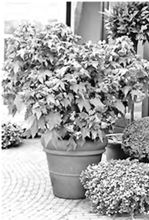
■ Цветущий абутилон в виде широкого куста.

Абутилон – многолетнее растение семейства мальвовых. В природе встречается в тропиках и субтропиках Америки. В культуру ввели садовники Старого Света, поселив новичка в оранжереях и теплицах. В России оно зарекомендовало себя как горшечное, что следует из народного названия «комнатный клен». Ценится за быстрый рост и долгое цветение – с апреля до ноября, но при достаточном освещении.