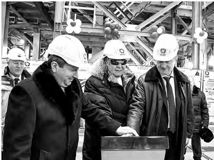
■ Торжественный запуск фабрики.

Уголь, который будет перерабатываться на фабрике — а это 3