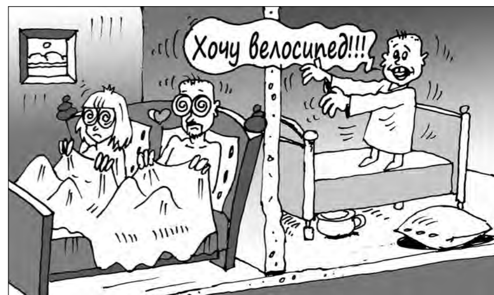
Рисунок Андрея Горшкова.