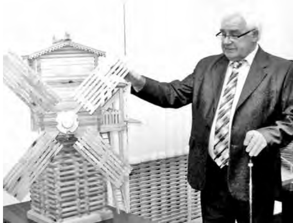
По экспозиции будут организованы выставки, экскурсии и занятия.