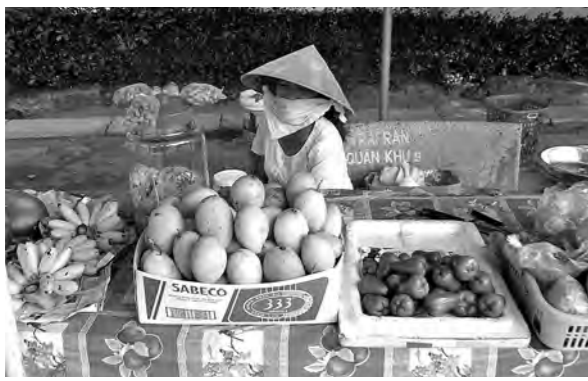
Более 5 кг фруктов – по документам.