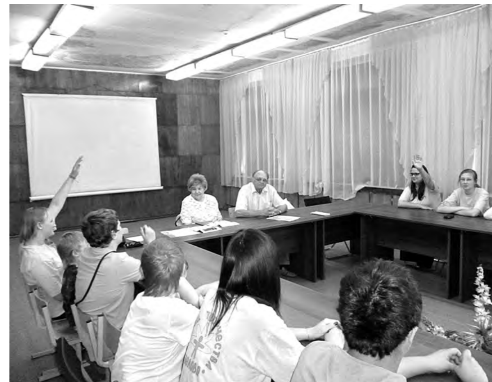
На встрече с ветеранами у школьников было много вопросов.