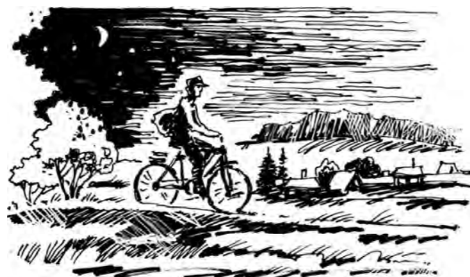
Рисунок Андрея Горшкова.

Возможно, зная они, что в здание пробрался преступник, сразу набрали бы номер полиции или предприняли иные действия. Но... буквально накануне в этом магазине обрушился стеллаж с бутылками, и, услышав звон и грохот, женщины ре-