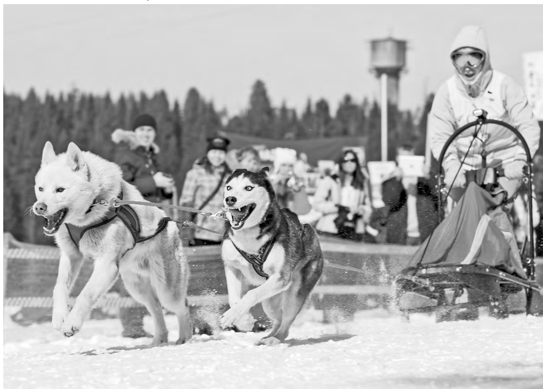
Катание на хаски, фотосессии с ними — кузбасская экзотика, ничуть не уступающая заморской.

Туроператоры существенно сокращают туристические полетные программы из России за границу. На фоне дорожающего доллара резко упал спрос на заграничные поездки. Только один из крупнейших туроператоров страны, работающих в Кузбассе, Pegas Touristik, закрыл половину зарубежных авиарейсов из Кемерово и полностью прекратил поездки из Новокузнецка.