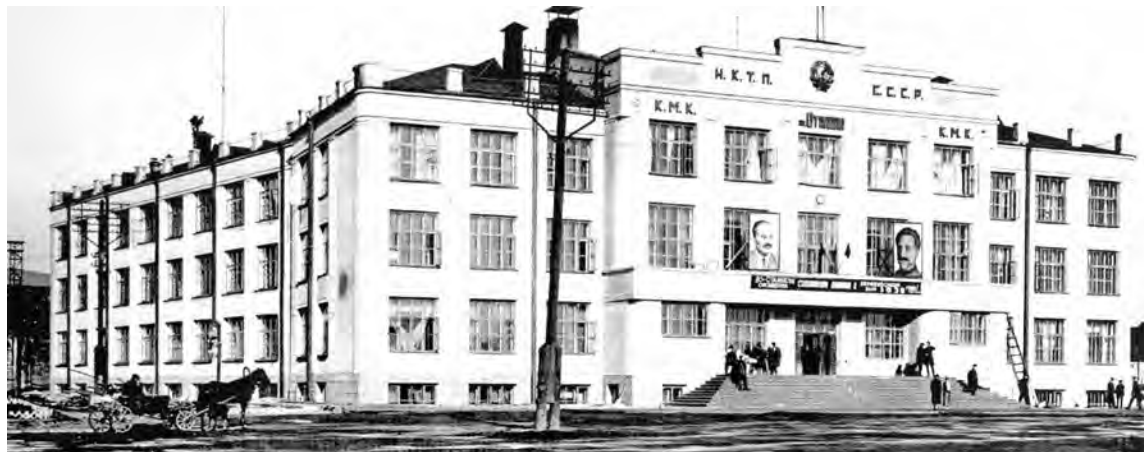
Заводоуправление КМК им. Сталина, 1936 год.

«У людей были воля и отчаянье – они выдержали. Звери отступили. Лошади тяжело дышали, забираясь в прожорливую глину; они потели злым потом и падали. Десятник Скворцов привез сюда легавого кобеля... По ночам кобель выл от голода и от тоски... Люди не просыпались: они спали сном праведников и камней. Кобель вскоре сдох. Крысы попытались пристроиться, но и крысы не выдержали суровой жизни. Только насекомые не изменили человеку. Они шли с ним под землю, где тускло светились пласты угля. Они шли с ним и в тайгу. Густыми ордами дви-