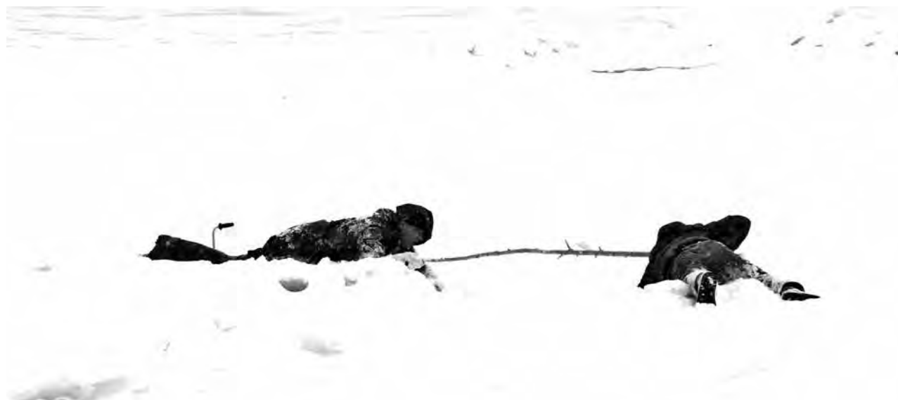
■ Большой открытый урок для школьников у реки возле деревни Красной в Кемерове провели сотрудники МЧС. Они на деле показали ребятам, как нужно действовать в ситуации, когда человек провалился под лед.