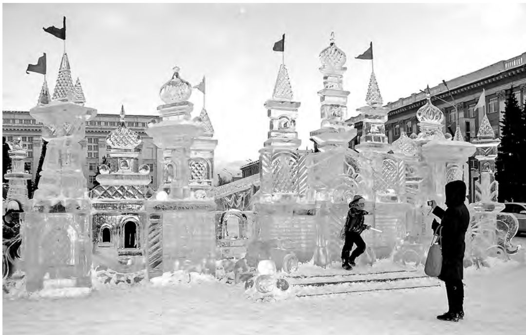
■ Ледовый городок на площади Советов в Кемерове выдержал испытание теплой погодой.