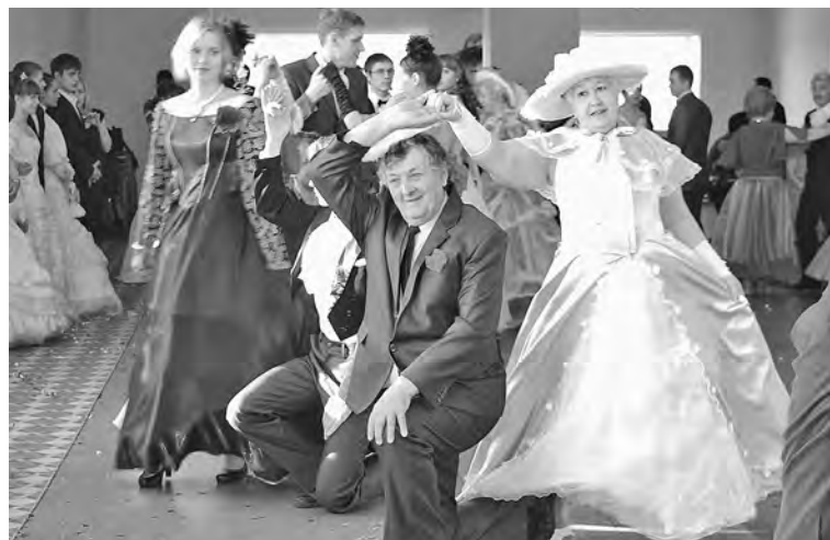
■ Фото из архива анжеро-судженского танцевального клуба.