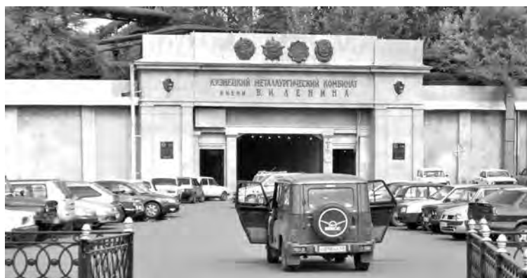
Въезд в знаменитый туннель длиной 540 метров.

гались вши, бодро неслись блохи, ползли деловитые клопы. Таракан, догадавшись, что не найти ему здесь инго прокорма, начал кусать человека».