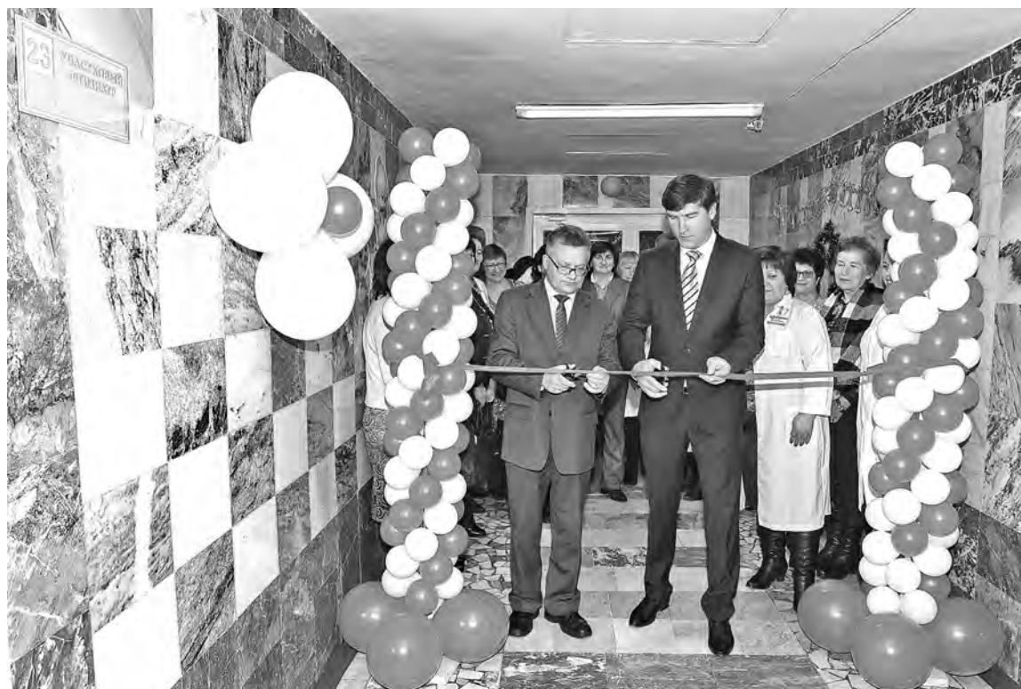
■ В Кемерове торжественно открыли детское диспансерное отделение областного противотуберкулезного диспансера.