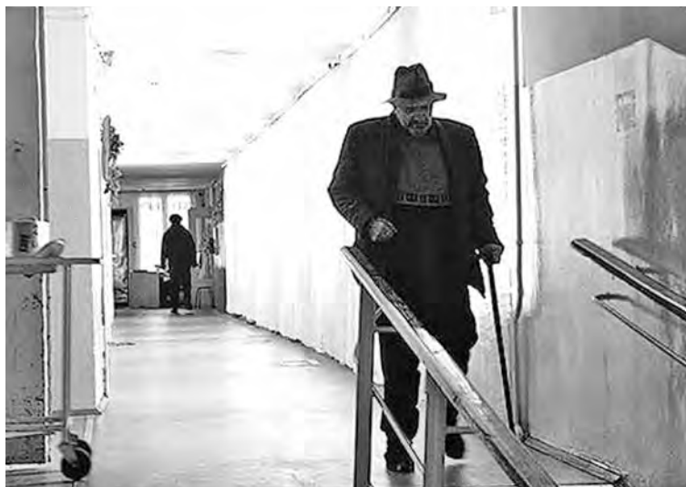
■ К сожалению, не все престарелые люди могут передвигаться и самостоятельно себя обслуживать...

Речь идет о негосударственном заведении, то есть частном бизнесе. Директор этого частного заведения наотрез отказалась говорить с нами, в сердцах заметив только, что запах мочи – фантазия нашей читательницы. Буквально вчера, продолжила директор, закончил проверку Роспотребнадзор и сделал за-