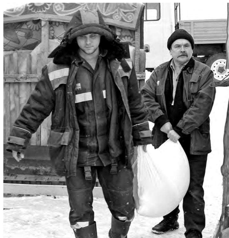
■ Гостинцы для воспитанников приюта.