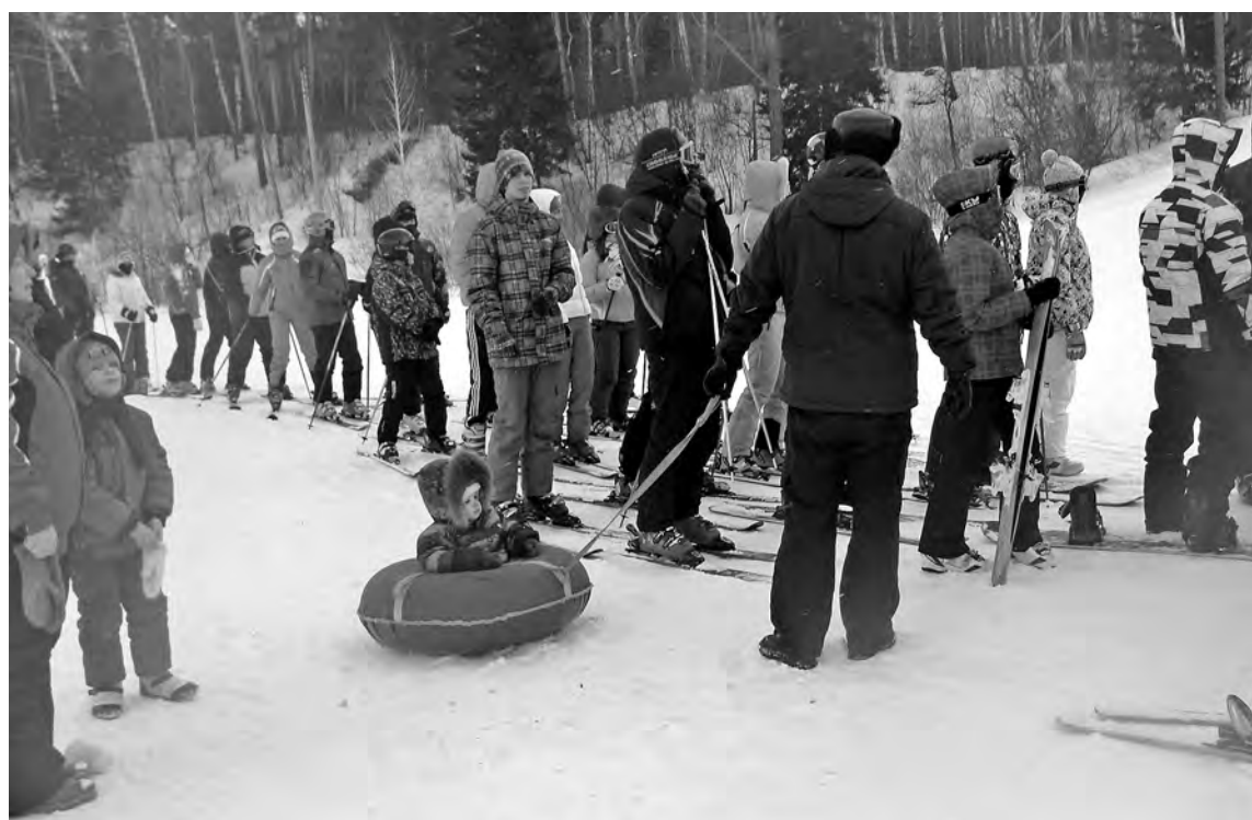
■ На Золотой горе в Гурьевском районе также были очереди на подъемник.