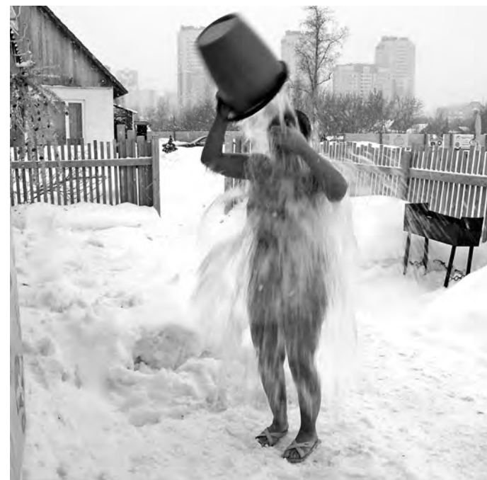
■ Теплая погода дала возможность некоторым кузбассовцам испытать свои силы, вылив на себя ведро холодной воды, потренировавшись тем самым перед предстоящим праздником Крещения Господня. Напомним, именно в этот праздник люди массово окунаются в проруби.