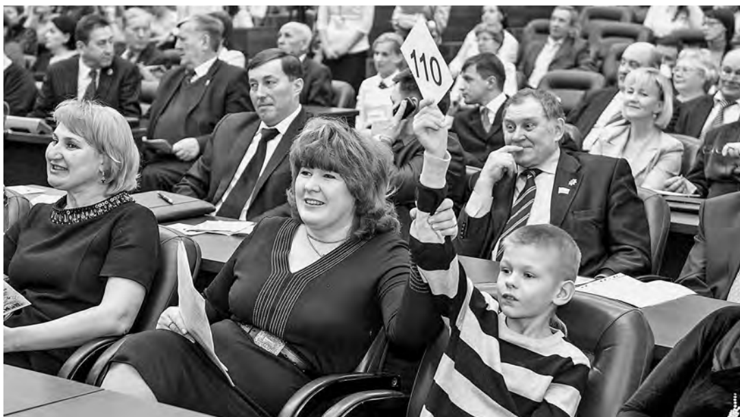
■ Участники благотворительного аукциона.