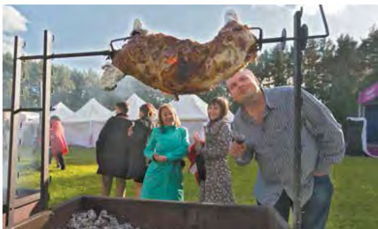
■ Корпоратив на лоне природы может оказаться и интересней, и вкусней, и полезней ресторанного.

Если кто потом работал наутро, все скопом убирали вечерний разор. А потом еще день-два обсуждали перипетии праздника, обменивались впечатлениями.