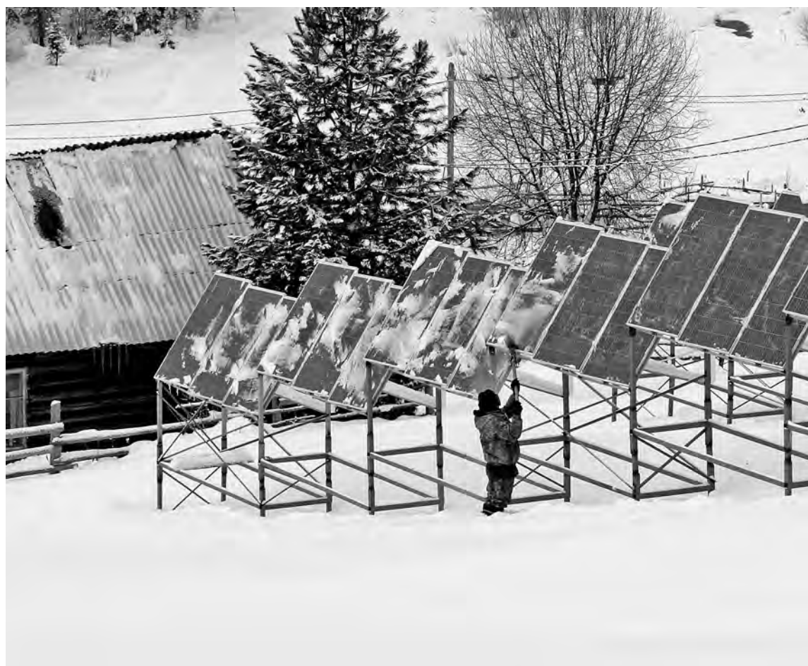
■ Солнечные батареи в отдаленной Эльбеге.