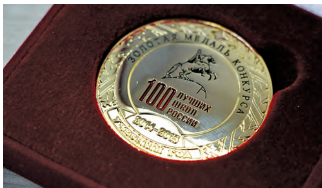
■ Знак качества работы 40-й школы.