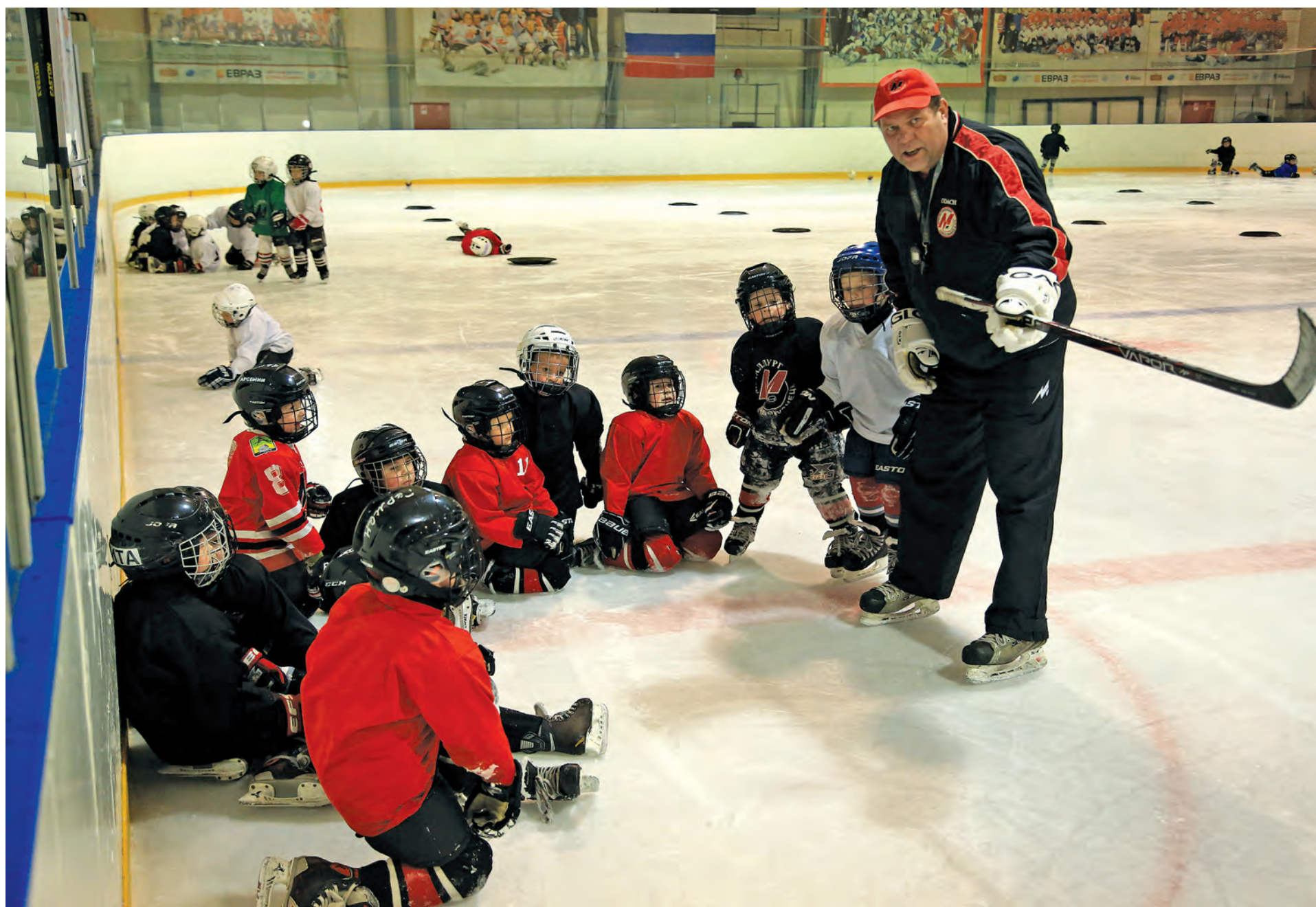
Тренеры «Металлурга» умеют выращивать игроков самого высокого уровня.