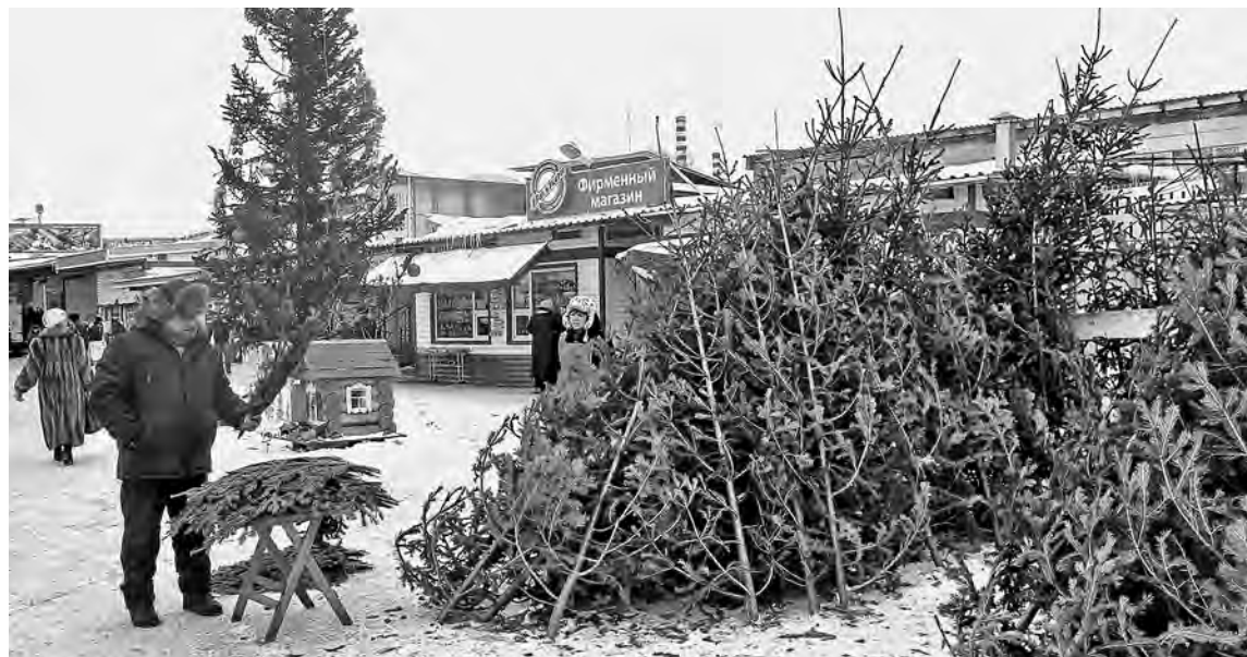
■ В Кемерове хвойную веточку можно купить рублей за сто, ну а цены на елки колеблются от пятисот рублей и выше.