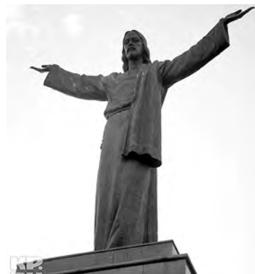
■ Христос над Тырганом.

«Сразу, как Лужкова убрали, первое, о чем заговорили, – это о сносе всего, что сделал Церетели в Москве». – «Конечно, я бы не хотел, чтобы то, что он создал, убиралось. Я отношусь к этому человеку с уважением... Академия художеств в таком состоянии была нищенском, и он нашел возможность как-то это всё восстановить... Его произведения стоят же и за границей, и везде. Я помню, мы увеличивали «Командора Резанова» как раз у него в цехе. И он пришел в цех, общался, разговаривал: что это? где? куда? Я говорю: в Красноярск. Сказал, что хорошая скульптура, и еще пошутил, мол, давай сделаем метров тридцать и в Америку поставим».