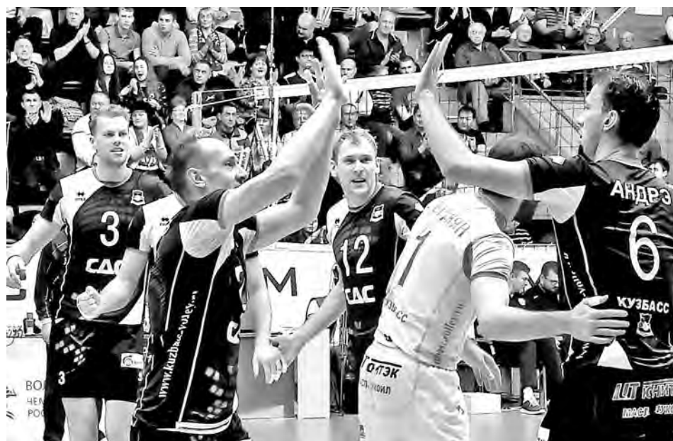
■ Волейболисты «Кузбасса» завершают год на мажорной ноте.

Вряд ли ныне повторится подобный сценарий, хотя в одном матче, как говорится, всё возможно. В текущем сезоне «Кузбасс» уступил всем остальным участникам «финала шести», а новосибирскому клубу и вовсе с «сухим» счетом (0:3). Правда, в заключительном в этом году туре национального чемпионата кемеровчане взяли верх в родных