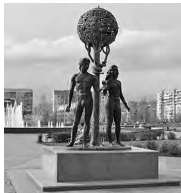
■ Адам и Ева.