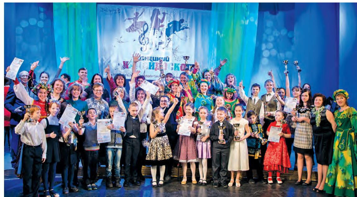
■ Лауреаты международного конкурса «Кузнецкий калейдоскоп».