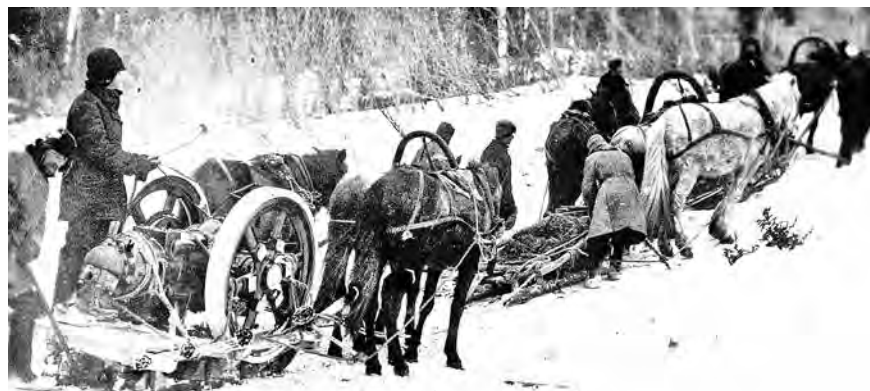
■ Закладка шахты «Северная». 1934 год.