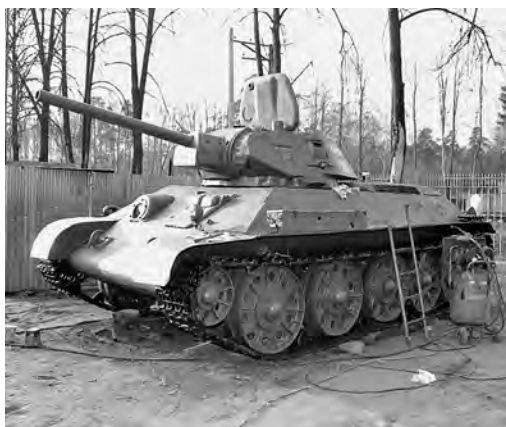
■ Модели военной техники для музея под открытым небом.