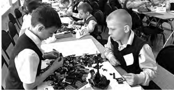
Участники конкурса конструкторских изобретений.