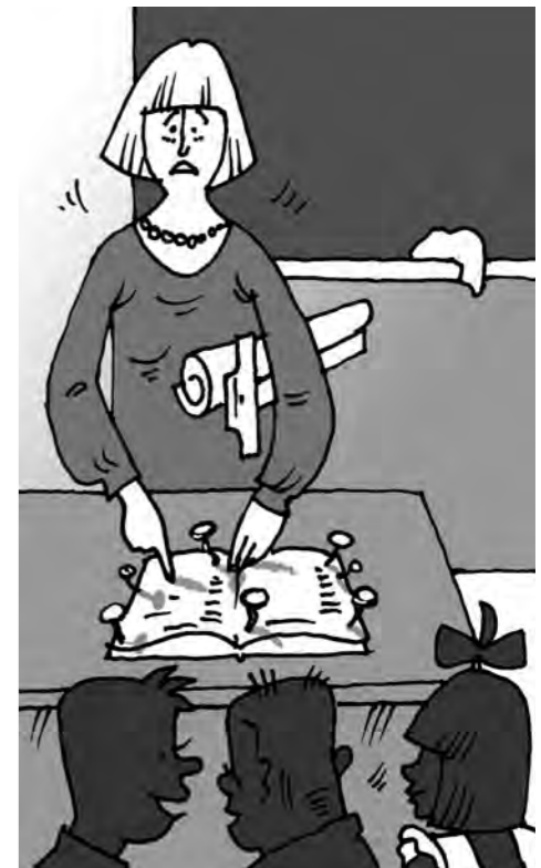
Рисунок Андрея Горшкова.