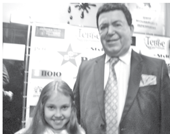
София Овчинникова вместе с членом жюри конкурса Иосифом Кобзоном.