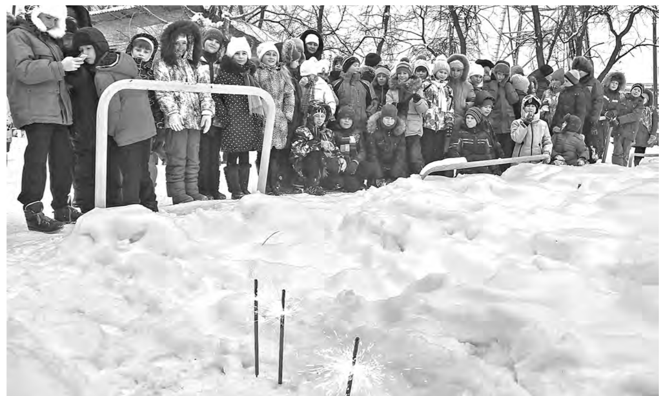
ПРАВИЛЬНЫЙ ФЕЙЕРВЕРК. В Кемерове в преддверии новогодних праздников сотрудники городского Госпожнадзора проводят уроки безопасности для школьников младших классов. «Бомбочки», хлопушки, петарды, бенгальские огни – популярные зимние забавы ребятшек, обращение с которыми требует определенной осторожности и навыков. Специалисты ведомства не только объяснили школьникам, на что им следует обращать внимание при покупке пиротехники, но и провели наглядные занятия по использованию фейерверков.