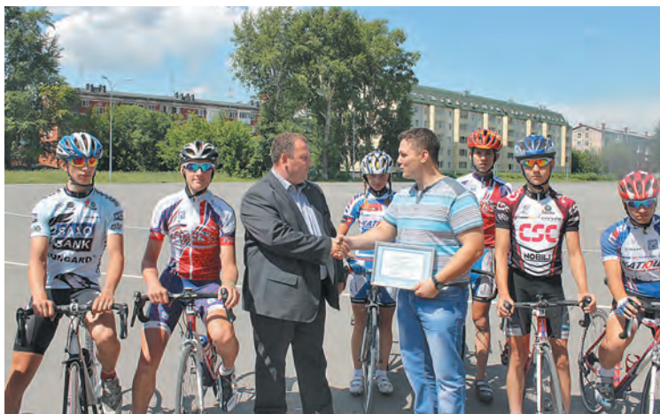
■ Торжественное вручение сертификата детской спортивной школе №3 г. Кемерово.

базе детско-юношеского конного центра «Фаворит» проходили межрегиональные соревнования по конному спорту среди детей с ограниченными возможностями. Ребятишки с ДЦП, аутизмом, органическим поражением головного мозга из Кемерово, Новокузнецка, Новосибирска и Красноярска показывали и доказывали, что их возможности без границ.