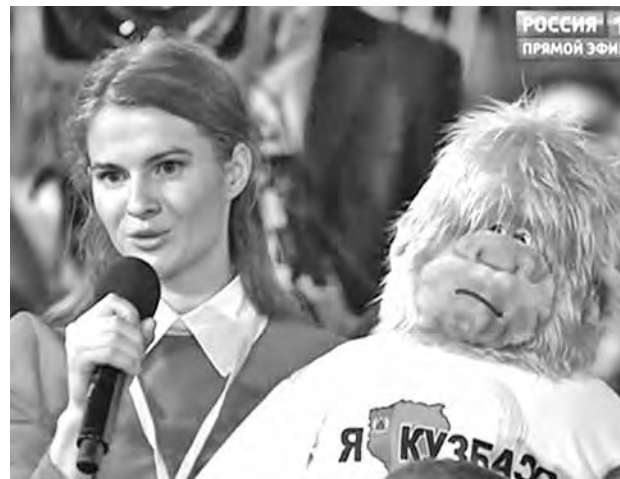
■ В прошлый раз президент заметил кузбасского йети, правда, приняв за медведя. А как будет нынче?

Среди возможных «кандидатов» на встречу с президентом – психаттозавр сибирский, который, отметим, в ближайшее время появится на гербе Чебулинского района. Это еще один необычный символ Кузбасса. При этом, как утверждают информированные источники, обсуждается вопрос о явлении на пресс-конференцию журналиста одного из СМИ в костюме... яйца динозавра. Для большей приметности. Сейчас модельеры ломают голову над достойным воплощением такого наряда: ведь всё должно быть броско, но прилично. Хотя не исключено, что в последний момент планы поменяются. Ясно одно: представители Кузбасса на пресс-конференции будут яркими и креативными. Ибо журналистов там будет много. А вопросов к президенту у кузбассовцев тоже немало.