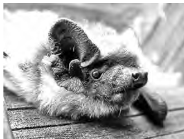
■ Примерно так выглядят сородичи летучей мыши, зимующей у юннатов.

Найденш, скорее всего, относится к виду «двухцветный кожан». У нас на станции раньше никогда не было летучих мышей. Мы пытались покормить ее, предлагали личинку мучного хрущака, сырое мясо. Но кушать мышь отказывалась. Поэтому решили отправить ее в спячку: отнесли ее в холодный подвал в специальной коробке, чтобы она могла уцепиться за ткань и повиснуть в удобной позе.