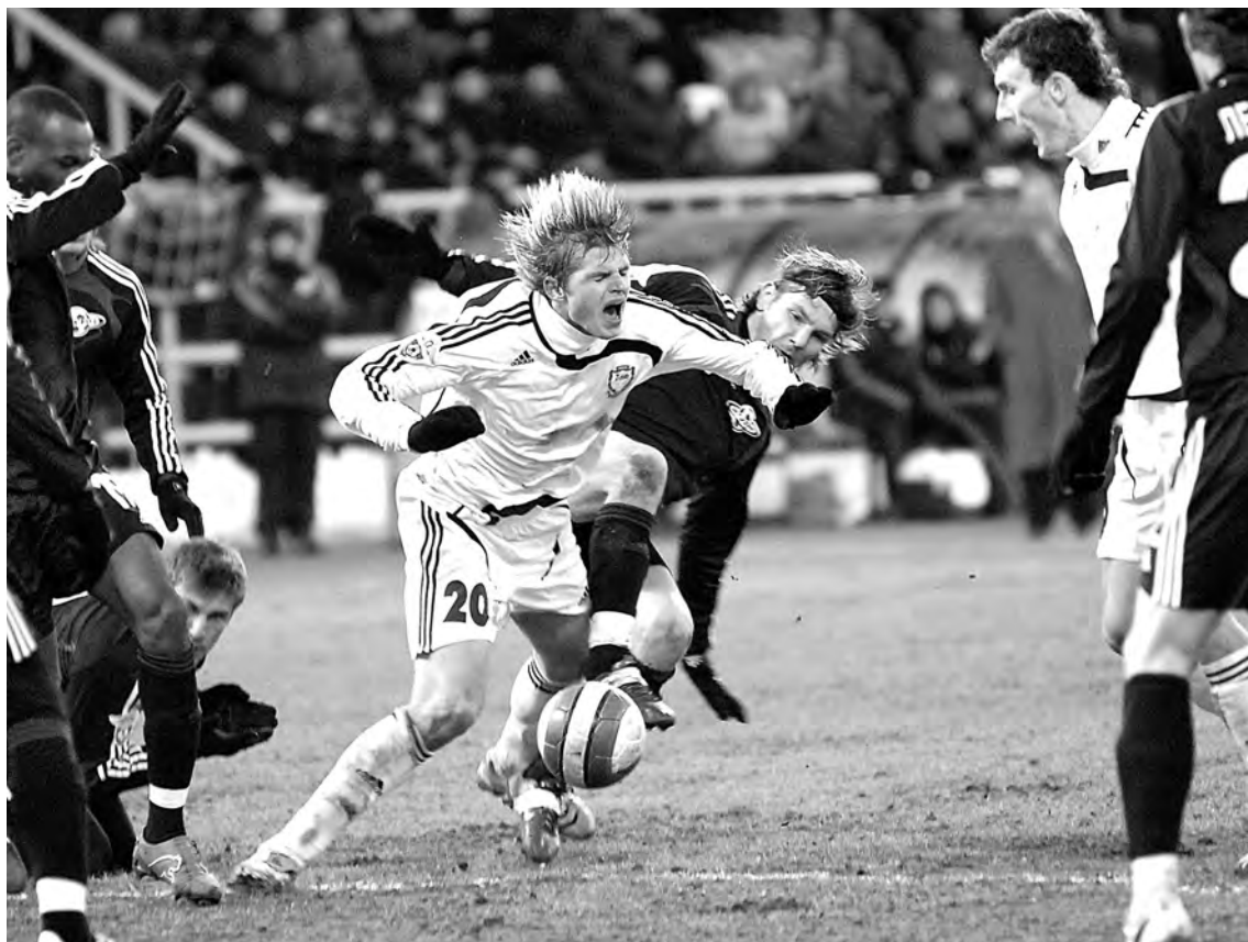
■ От сюжетов на футбольном поле порой волосы встают дыбом!