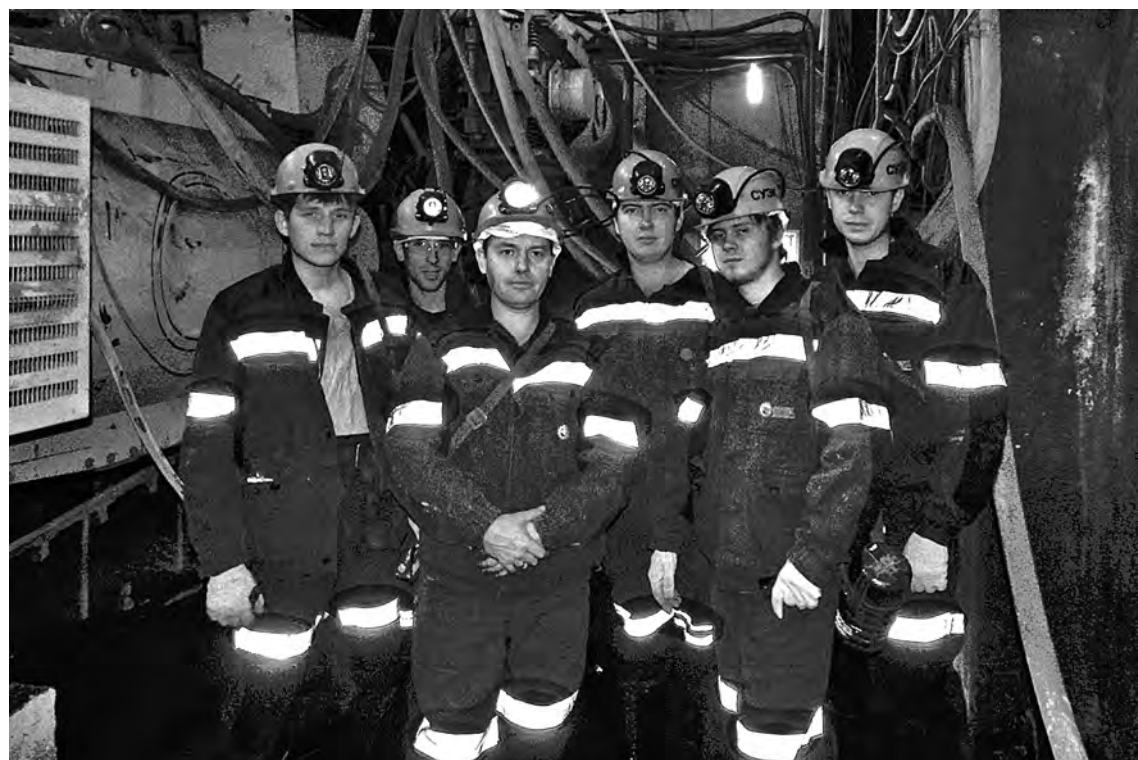
■ Студенты пятого курса филиала КузГТУ в г. Прокопьевске на шахте «Талдинская-Западная-1»: тема лабораторных занятий - диагностика оборудования.