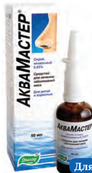
Для взрослых и детей

(звонок бесплатный). Заказывайте на сайте apteka.ru с бесплатной доставкой в ближайшую аптеку. ЛСР-006001/10. Реклама. 1 Безалкогольный хлорид в дополнительном составе.