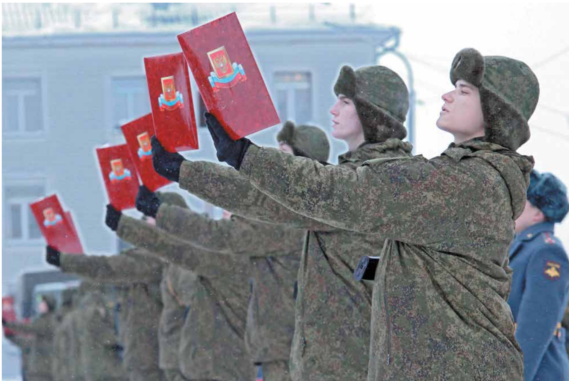
■ Впереди у новобранцев год службы, за это время они из «желторотиков» должны превратиться в настоящих мужчин.