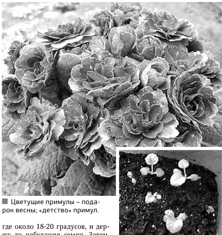
■ Цветущие примулы – подарок весны; «детство» примулы.

На дворе снег, мороз, а увлеченные садоводы начинают думать о следующем сезоне. В садовых центрах появились свежие семена, и так хочется посеять что-нибудь прямо сейчас. Одно из таких растений – примула. Конец декабря – январь будет самое время для посева. Магазины предлагают разнообразный выбор сортов и гибридов примулы бесстебельной, полиантовой, мелкозубчатой, ушковой самых разных форм и расцветок.