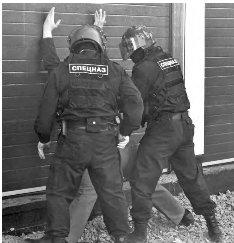
■ Момент захвата членов группировки «Ингуши» полицейским спецназом.