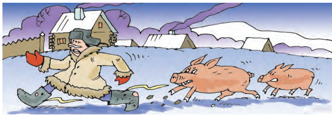
■ Рисунок Андрея Горшкова.