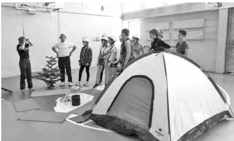
■ В Кемерове впервые прошел урок-праздник.