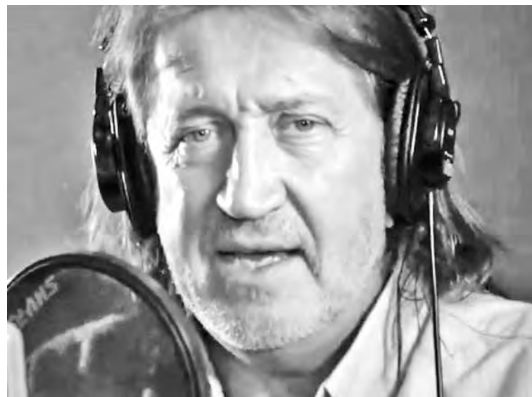
■ Автор туристского хита «Изгиб гитары желтой» Олег Митяев и песню «Герой Кузбасса» хотел сделать полиричной...