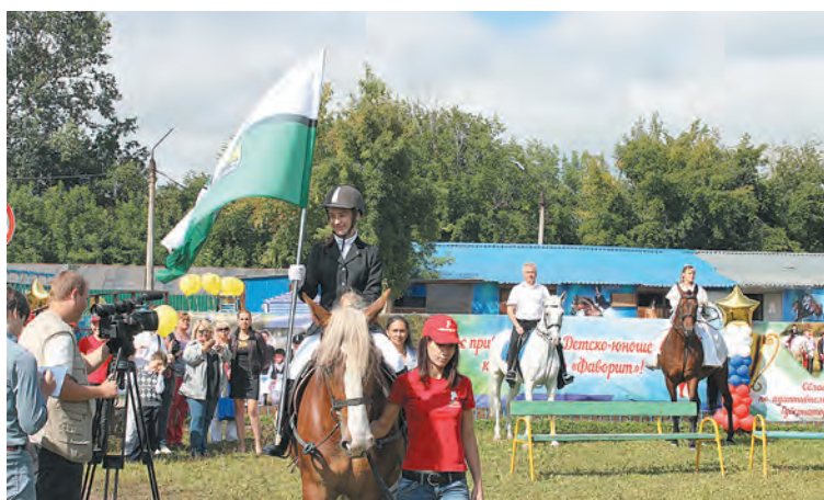
■ Соревнования по конному спорту собрали много зрителей.

В августе этого года в течение двух дней в Новокузнецке на