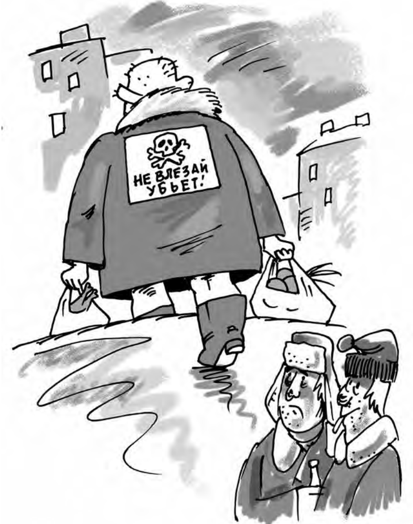
Рис. Андрея Горшкова.

Это отнюдь не первый случай в современной Европе, когда бездомных пытаются «пометить». Так, в сентябре нынешнего года власти датского города Оденса выдали местным бомжам для постоянного ношения специальные GPS-устройства. Мониторинг перемещений бездомных призван был показать, где для них лучше устанавливать скамейки и различные укрытия от непогоды. Однако данное нововведение носило добровольный характер: даже совсем опустившиеся люди могли отказаться от ношения «следающей» техники».