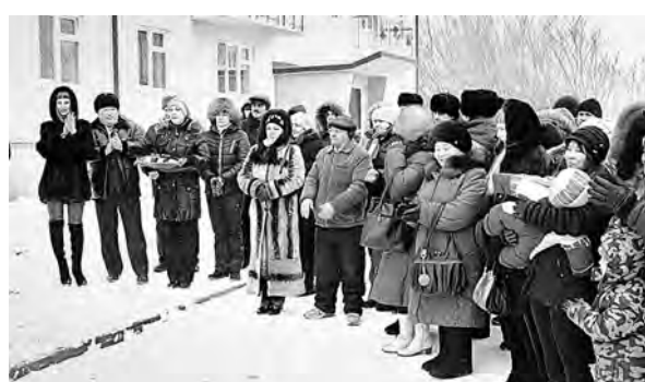
Новоселы получают ключи от новых квартир.