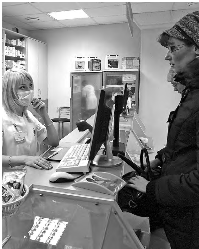
■ В аптеку покупатели чаще всего идут за лекарствами. Удорожание средств контрацепции их не волнует...

Это верно. Кому-то и обыкновенных достаточно (99 руб. за три шт.), а кому-то с пупырышками подавай – за 385 рублей. Но ведь будут дороже!