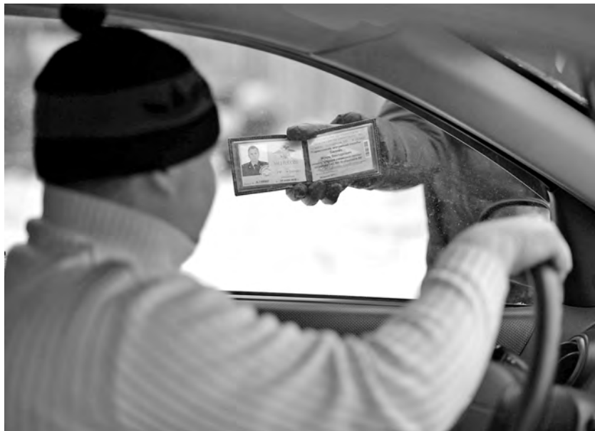
■ «Транспортная полиция! Всем выйти из машины!»

Двор рядом с ДК имени 50-летия Октября в Кировском районе Кемерова образует выстроенная буквой