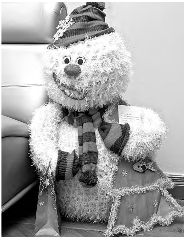
■ «Слепить» снеговика можно не только из снега.

Перед участниками стояла творческая задача – изготовить снеговика, используя различные техники декоративно-прикладного творчества, проявив при этом фантазию, изобретательность, креативность и эстетический вкус. С поставленной задачей авторы снеговиков справились на «отлично». Не