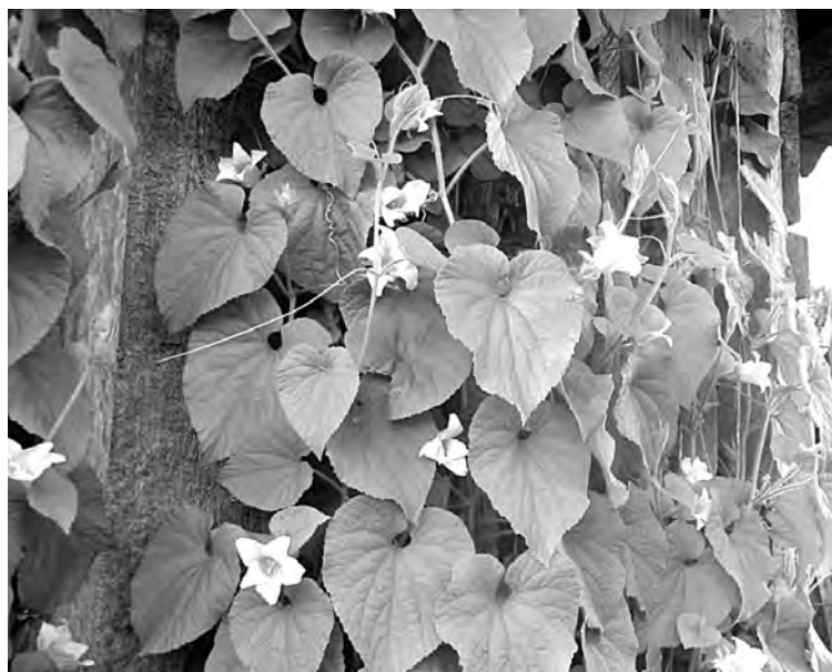
■ Лиана тладианты.

желтыми цветами, похожими на любые тыквенные, которые в итоге становятся плодами. Плоды напоминают маленькие огурчики. Сначала они мохнатые, а при созревании становятся оранжево-красными, с малозаметными полосками. Зеленые плоды используют для консервирования, а спелые пригодны для употребления в свежем виде и для переработки (варенье, джем, повидло).