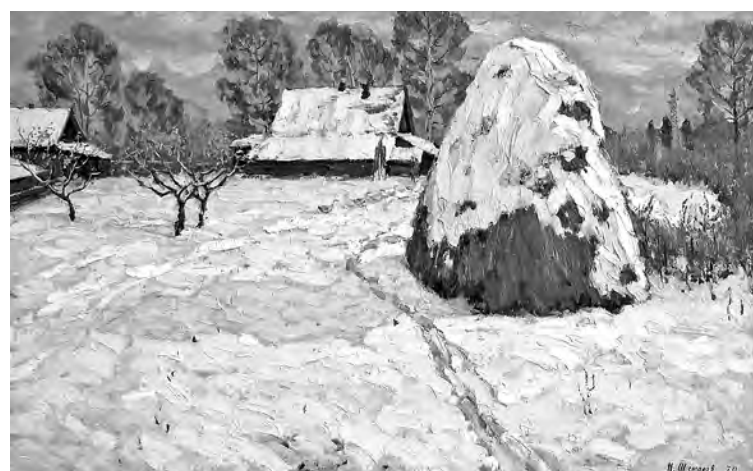
■ Шемаров Н.М. Русская зима. 1970. Холст, масло. 77×122.

С ней же хочется связать и яркое весеннее освещение на полотне Бачинина, и остатки подтаявшего снега на завалинке. Впрочем, мы видим здесь не традиционный деревенский дом (они строились в Сибири из бревен, на высокомо подклете, ставни украшались резьбой), а домик городской или пригородной, щитовой и засыпной: это заметно по той же завалинке. Такие дома в изобилии строились в Кузбассе в 1920-е – 1940-е годы, во времена бурной индустриализации, когда жилищное строительство не поспевало за развитием промыш-