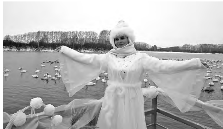
■ У Лебединого озера уже принято просить любви и счастья в семье и мира на Земле.