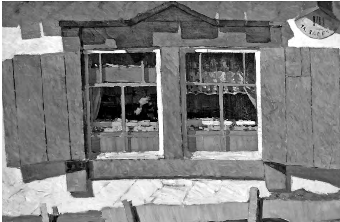
■ Бачинин Н.И. Голубые ставенки. 1966. Холст, масло. 114,5×160.

Лет десять назад, в середине 2000-х, в КОМИИ состоялась масштабная выставка из фондов Третьяковки. Николая Шемарова я увидел на ней, когда он вниматель-