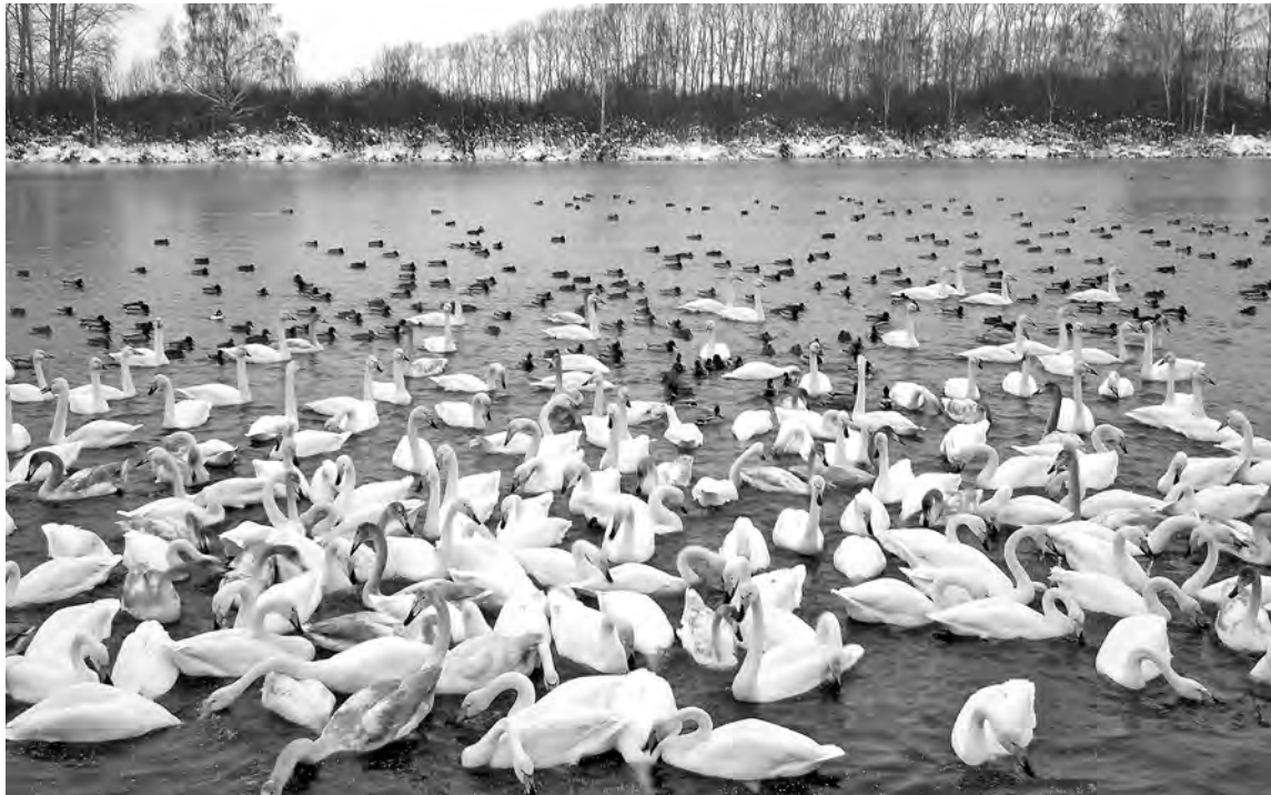
■ Озеро Светлое, Алтай, на удивительную зимовку нынче здесь собралось 550 лебедей из разных стай из регионов-соседей.

Не верю, склоняюсь к озеру, опустив в воду руки, и – улыбаюсь: «Не холодно!» К тому же щеки вдруг загорелись, как в марте. Да,