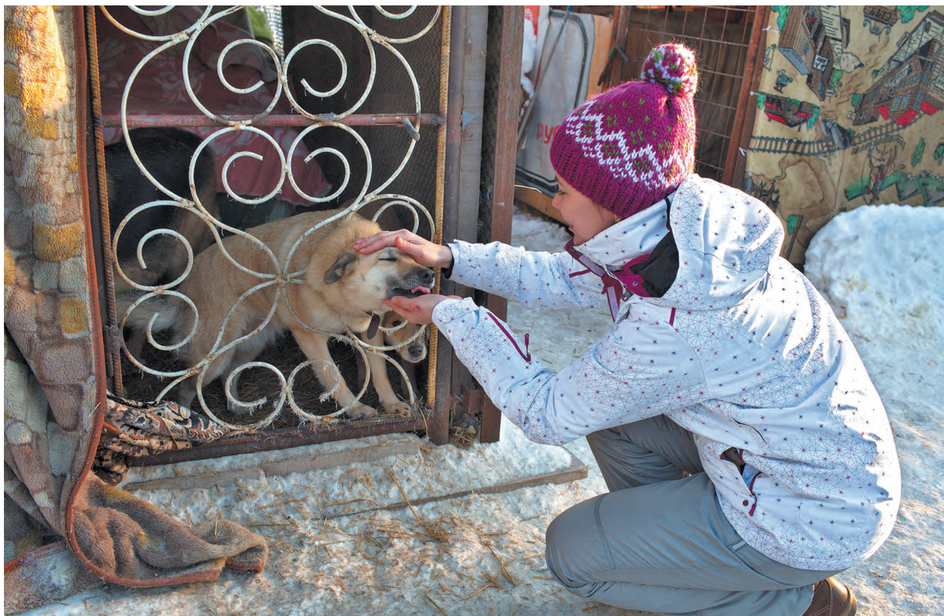
■ Воспитанница кемеровского приюта для бездомных животных «Верный» собака по кличке Зайка очень обрадовалась гостям, а самое главное, вниманию.