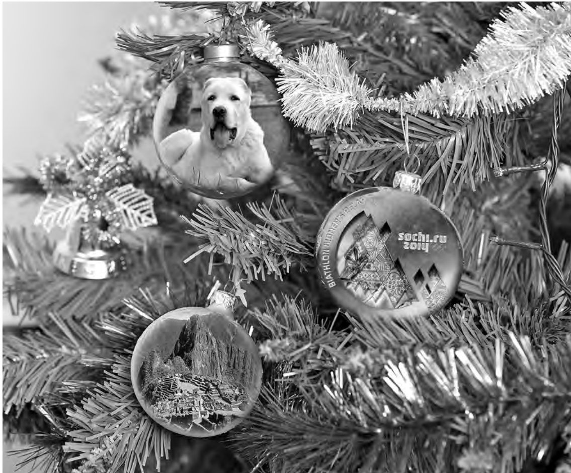
■ Фотоколлаж Сергея Гавриленко.

И еще. В стрессовых ситуациях меня очень выручают мои собаки породы алабай и цыгана