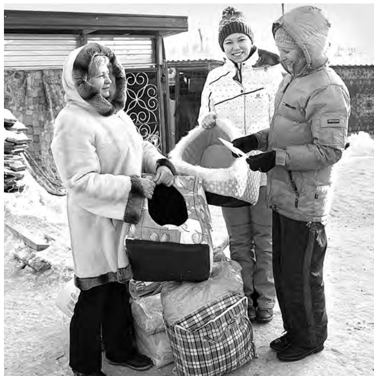
■ Деньги на покупку корма для животных, теплые одеяла и не только собрали для приюта в газете «Кузбасс».