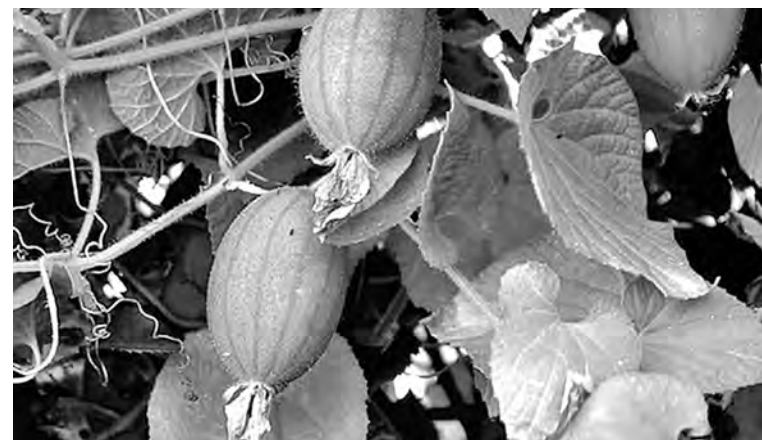
■ Фрукты тладианты.

Тладианта — экзотический овощ, который медленно, но верно обретает поклонников в среде сибирских садоводов-цветоводов