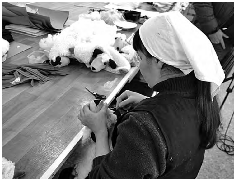
■ Мягкий символ будущего года разойдется по магазинам региона.

Кроме того, ИК №50 приготовила подарки к Новому году, Рождеству воспитанникам из местного детского дома «Раду-