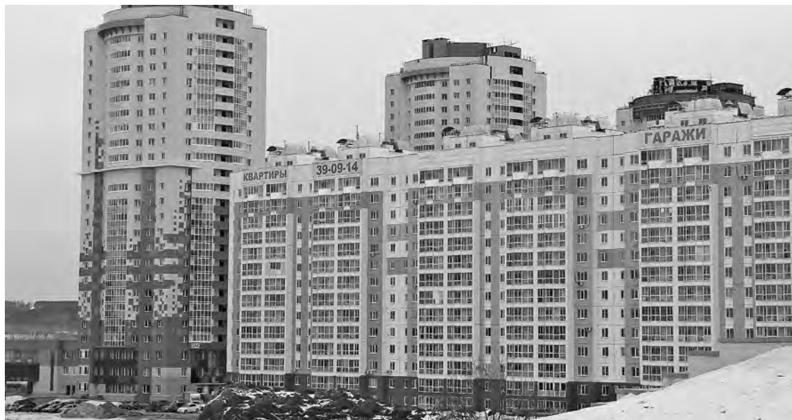
■ Покупая новое жилье, сейчас уже нужно задумываться и о тратах, которые будут связаны с его эксплуатацией.