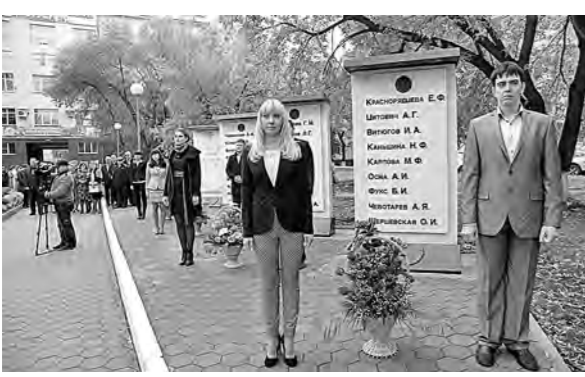
Мемориальные стелы у городской клинической больницы Новокузнецка №1.