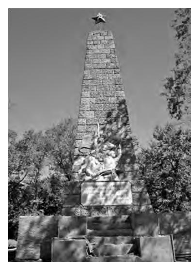
В Кызыле.