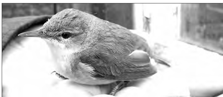
■ На ладошке – песчанка луговая.