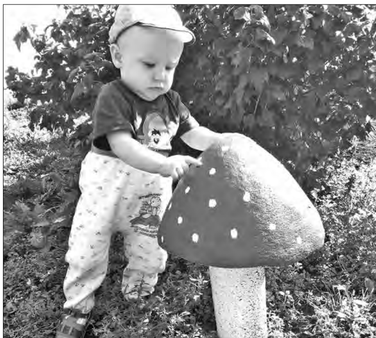
■ «Ничего себе грибочек!»

или на электронный ящик mal@kuzbass85.ru .