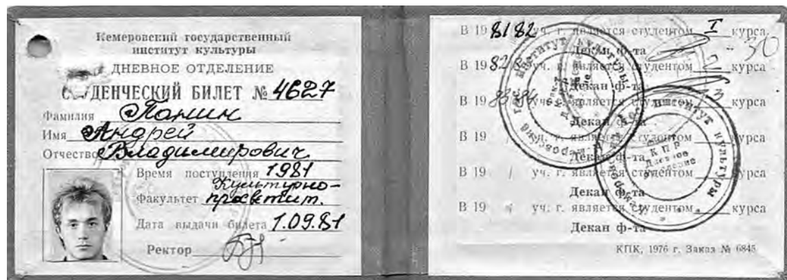
Студенческий билет актёра Андрея Панина.