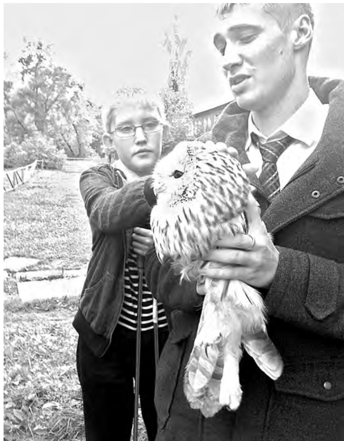
■ Сова чудом осталась жива.