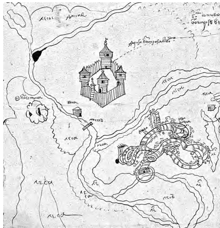
Чертеж Каштакского острога и рудника, сделанный греком Мануйловым

Судя по всему, из Томска так и не дали священника. А потусторонние силы отменили весну, явив пришедшим людям в середине мая... снег. Его выпало слоем до 70 сантиметров!