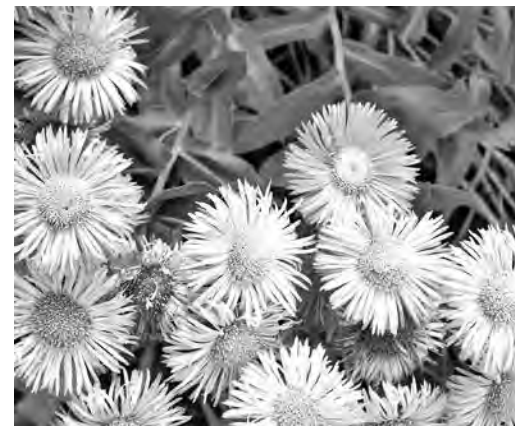
■ Астра многолетняя.

Уход за ними несложен, если обеспечить необходимыми условиями: открытое солнечное место (в тени поражаются ржавчиной), хорошо дренированная почва, поскольку не терпят застоя воды, а также полив в сухую – засуха для них может быть губительна. Все многолетние астры имеют тонкие, часто горизонтальные, сильно ветвящиеся корневища. Куст нарастает довольно медленно, пото-