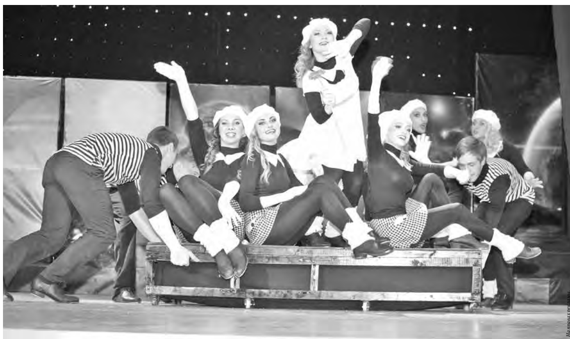
■ Сцена из номера нынешнего года «На крючке».