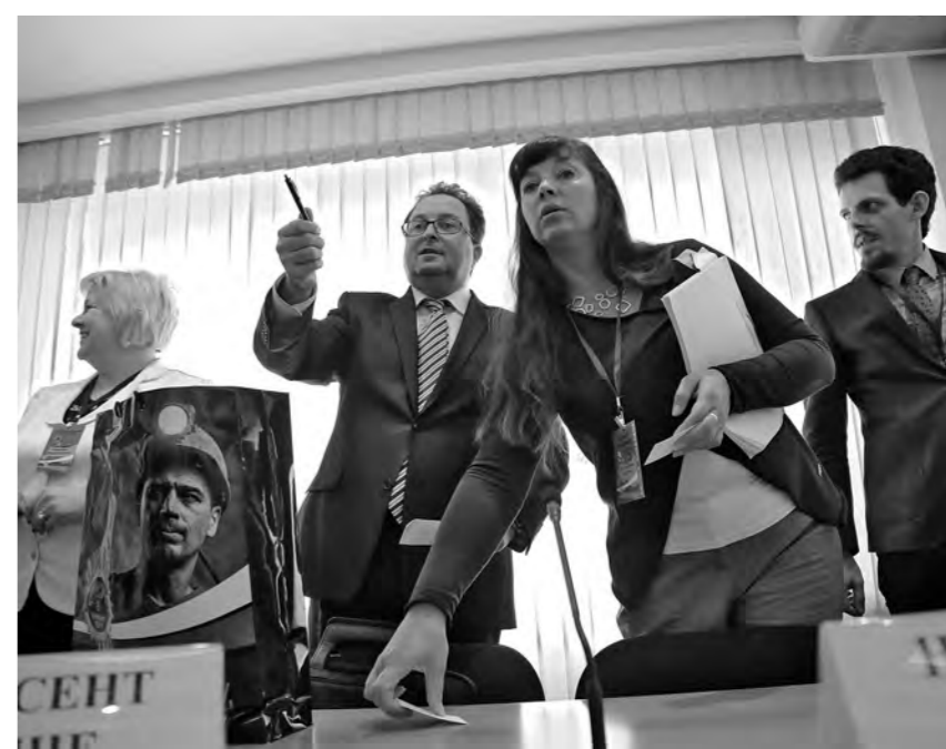
■ Фото Ярослава Беляева.

Во время пребывания в нашем регионе иностранные специалисты посетили Новокузнецк, где познакомилась с проектами создания на юге области машиностроительного и угольного кластера, а также индустриального парка, в развитии которых они могут принять непосредственное участие.