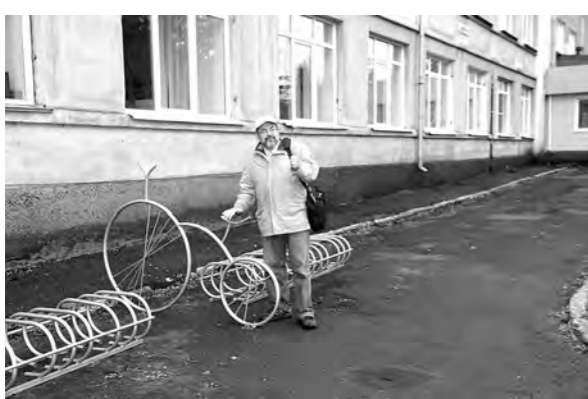
■ Студенческая велостоянка, надеются в университете, пустовать не будет.