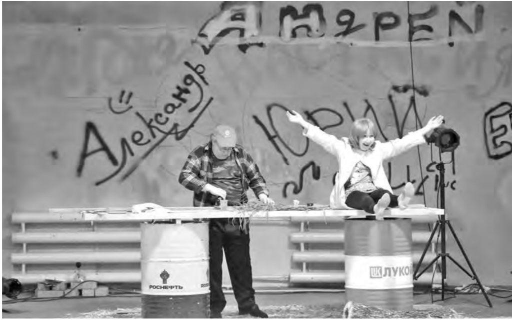
В Прокопьевском театре драмы в новом сезоне сразу три премьеры.