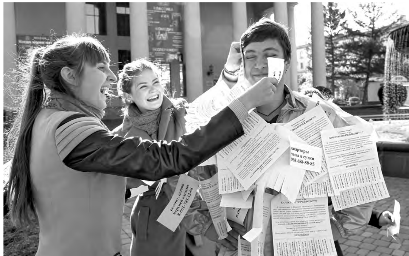
■ «СТОП ОБЪЯВЛЕНИЯМ!» — флешмоб под таким названием провели активисты молодежных организаций Кемерово. Они наклеили объявления на одного из соратников, а тот потом картинно с себя их сорвал, показав тем самым горожанам, как хорошо клеить их на подъездах и остановках. В целом акция называется «Красивый город». После флешмоба волонтеры разделились на группы и отправились очищать от объявлений останочные павильоны, фасады зданий и другие объекты. Присоединиться к акции предлагают всем кемеровчанам.