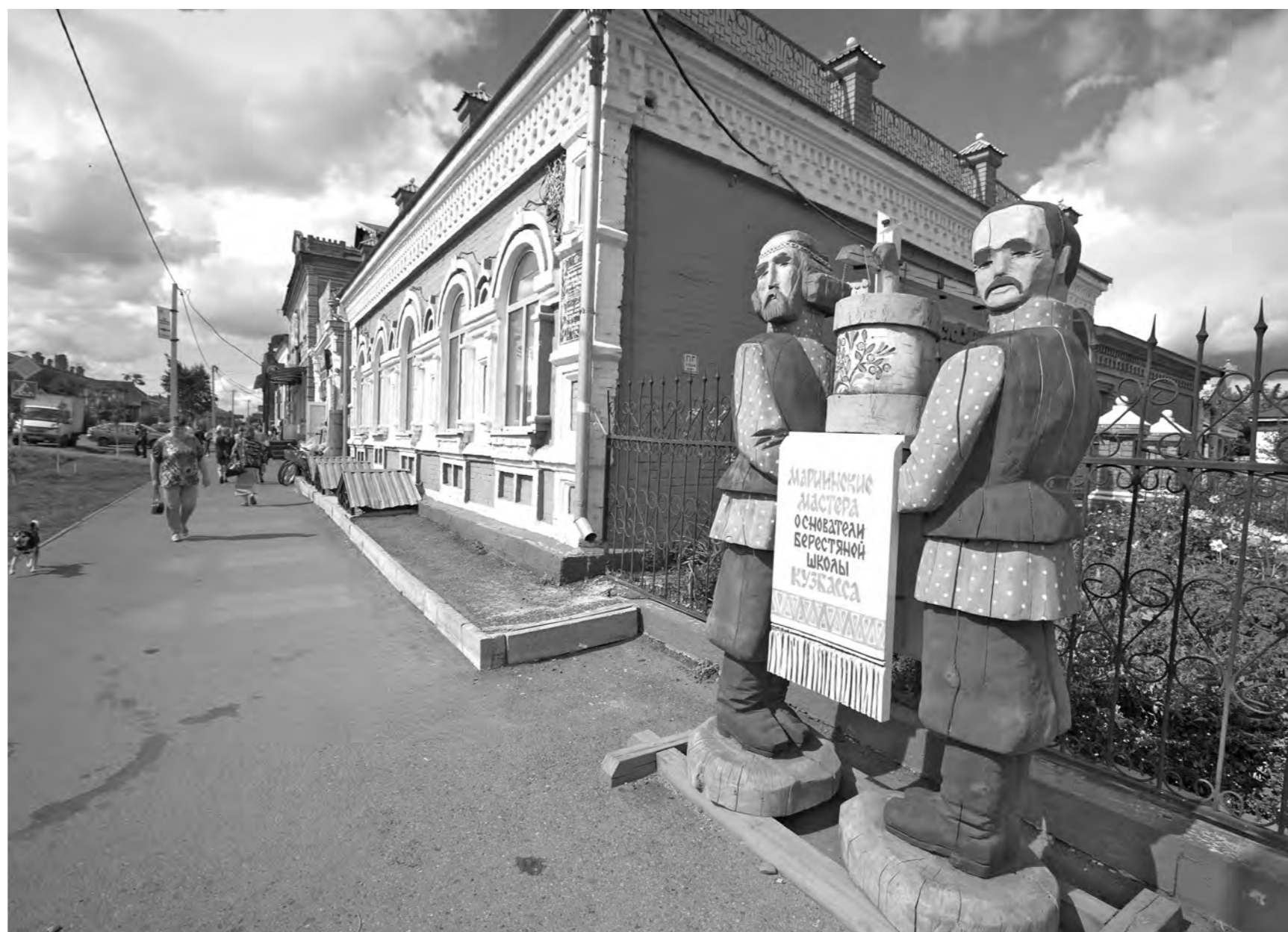
■ Маринск — один из тех городов Кузбасса, которые могли бы заработать на туризме.

По мнению экспертов, во «внешнем мире» Кузбасс ассоциируется с углем, шахтерами, Аманом Тулеевым, Евгением Гришковцом, Шерегешем и йети