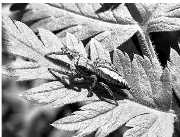
■ Самка паука-скакуны, обитающего в Шорском национальном парке.