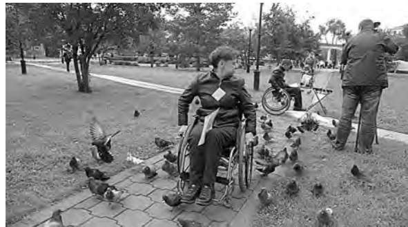
Соревнования «Ориентир на здоровье» планируют сделать традиционными.