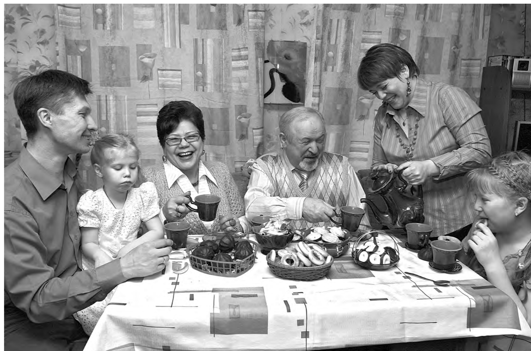
Все то, что составляет качество жизни и напрямую влияет на человеческую удовлетворенность своей судьбой вообще, станет предметом пристальных расспросов интервьюеров.

В Кузбассе сегодня началось комплексное обследование условий жизни населения