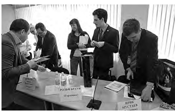
■ Стажеры из Германии, Франции и Японии перенимают опыт новокузнецков.