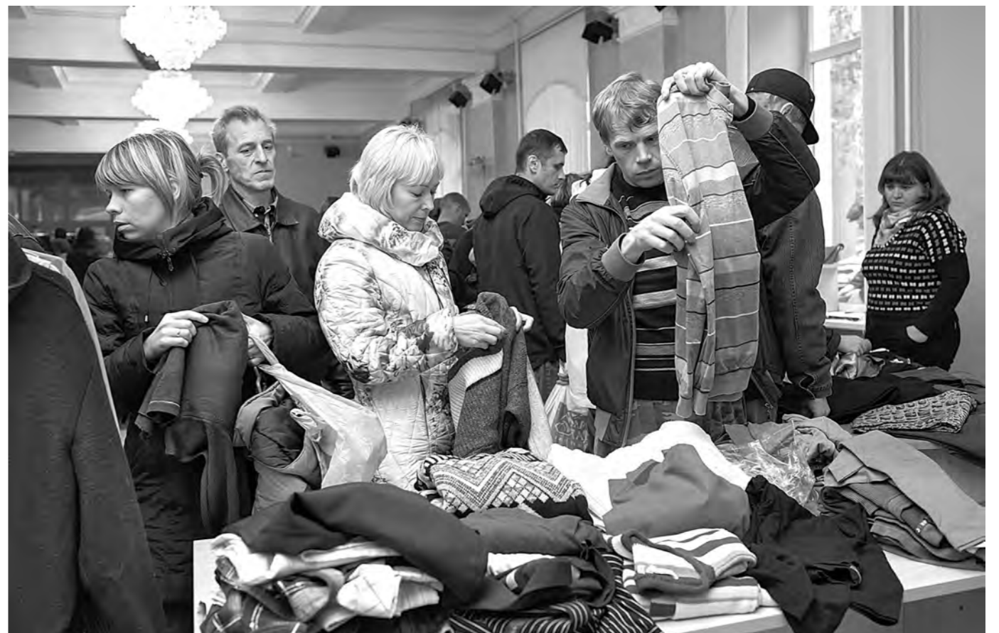
ПОДЕЛИЛИСЬ ТЕПЛОМ. Вчера в Кемерово, в ДК Кировского района, состоялась благотворительная акция помощи вынужденным переселенцам с Украины. С наступлением осени многие из них стали нуждаться в теплой одежде. Поэтому собранные активистами Общественной палаты, Федерации профсоюзных организаций Кузбасса и ОНФ вещи многим пришлось кстати. Причем среди предлагаемого ассортимента можно было выбрать не только осенние вещи, но и зимние.