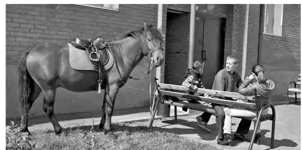
Кавалеры.