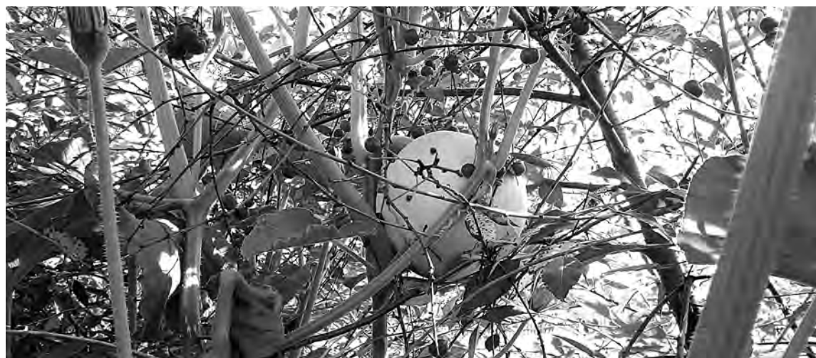
■ Тыква-акробатка. пос. Тяжинский

Работы отправляйте по адресу: 650991, Кемерово, пр. Октябрьский, 28, редакция газеты «Кузбасс», на конкурс «К саду – с любовью!» или на электронный ящик mal@kuzbass85.ru.