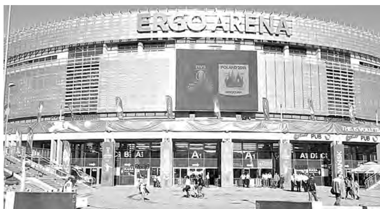
■ Спорткомплекс в Гданьске в прошлом году принимал чемпионат Европы, а в сентябре нынешнего стал ареной для матчей чемпионата мира.

Рядом со мной расположилась на трибуне группа болельщиков из Калининграда. И еще в нескольких секторах стадиона обосновались наши любители волейбола. Соотечественники, как водится, развешивают национальный флаг и скандиру-