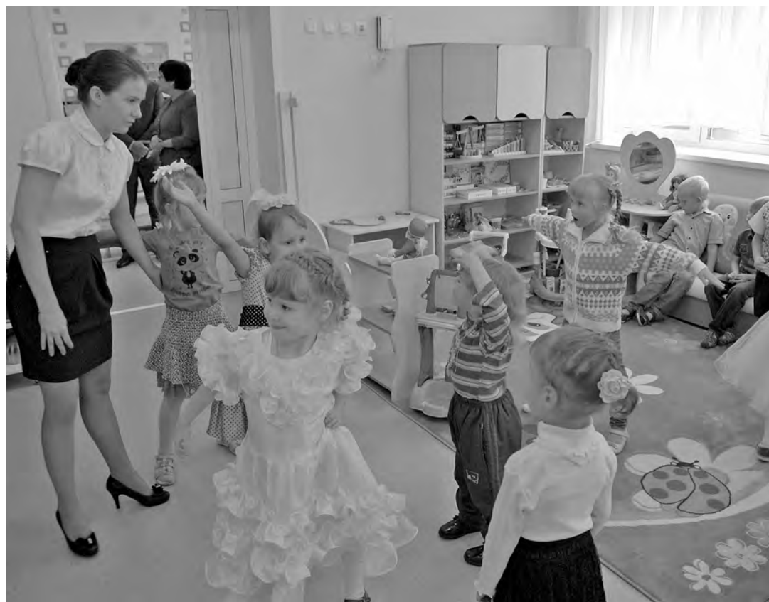
■ «Ласточка» оснащена современным технологическим и медицинским оборудованием.