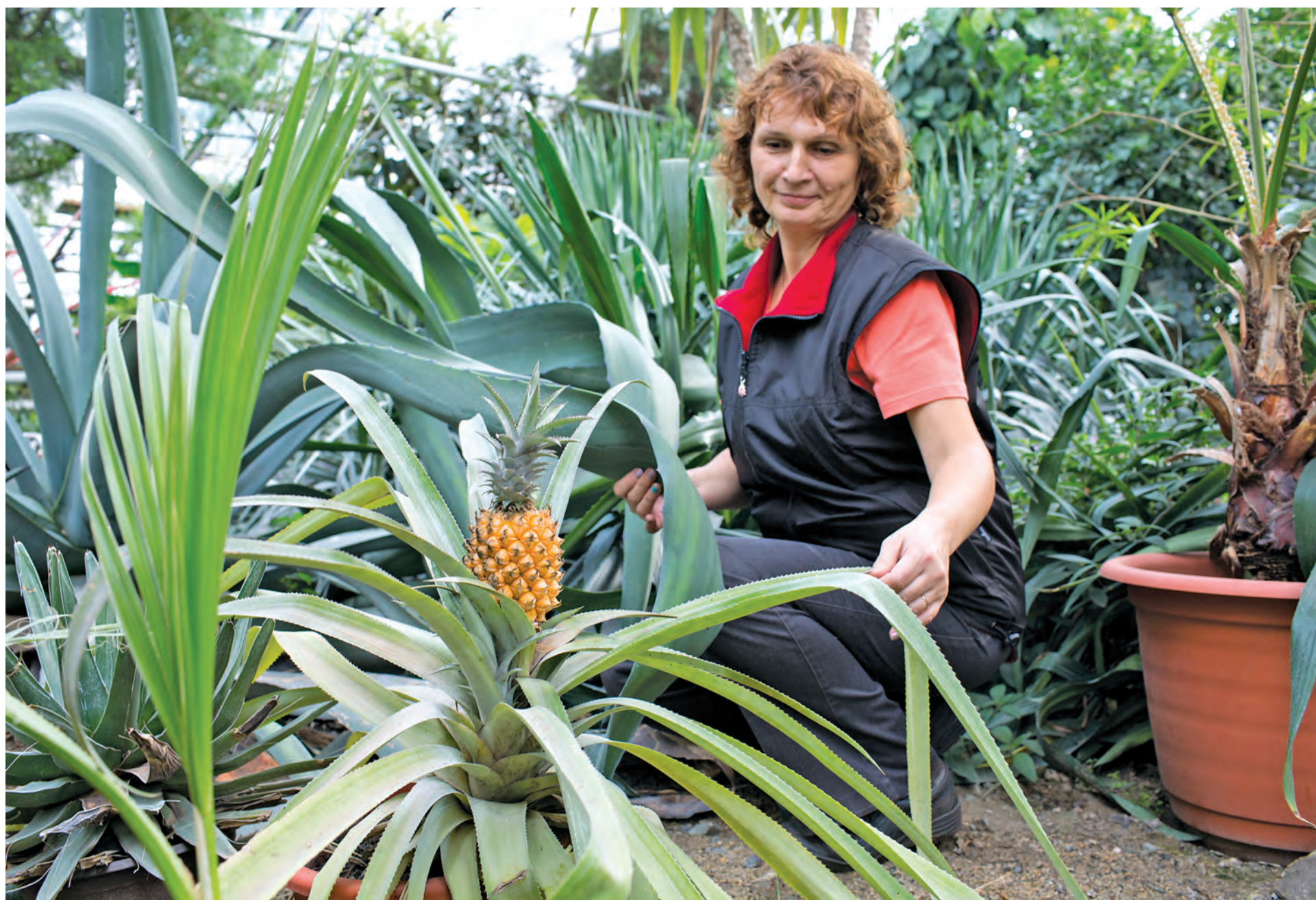
■ Первенец кемеровских ботаников – таиландско-кузбасский ананас.