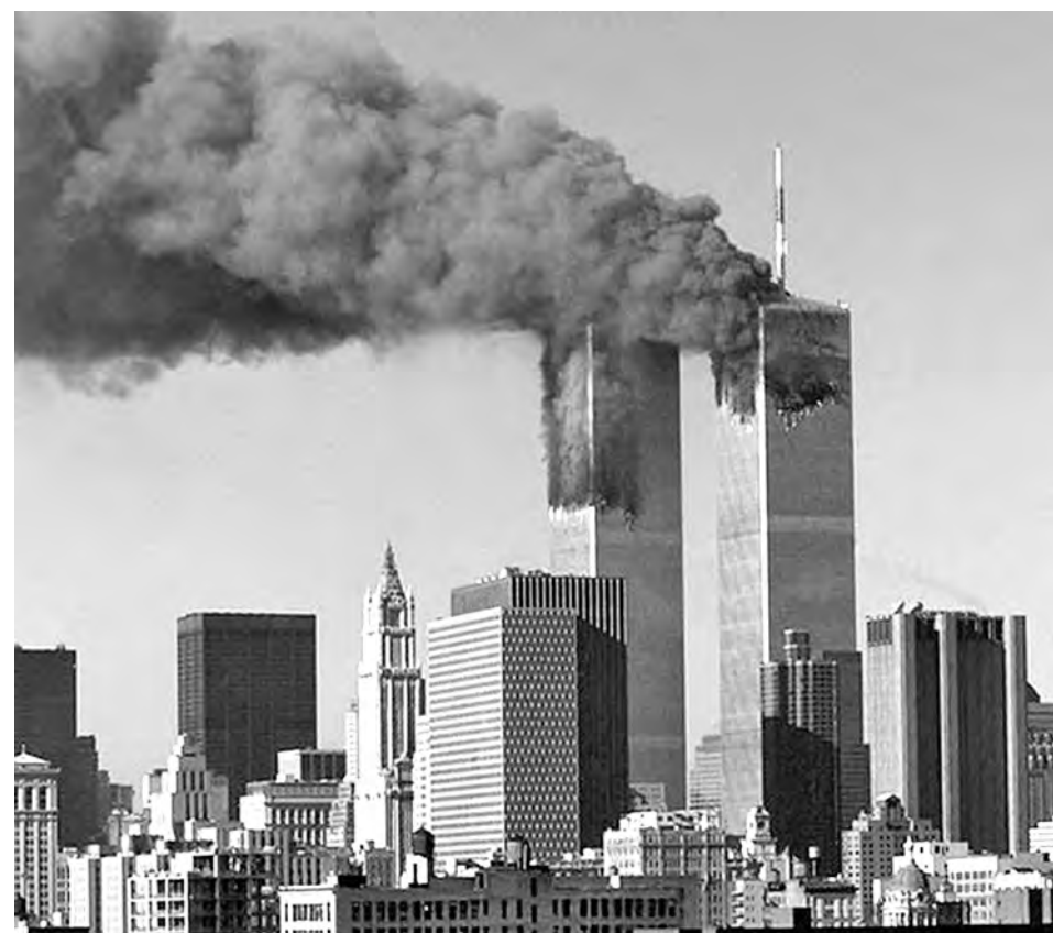
■ Башни-близнецы, Нью-Йорк, теракт 11 сентября 2001 года.