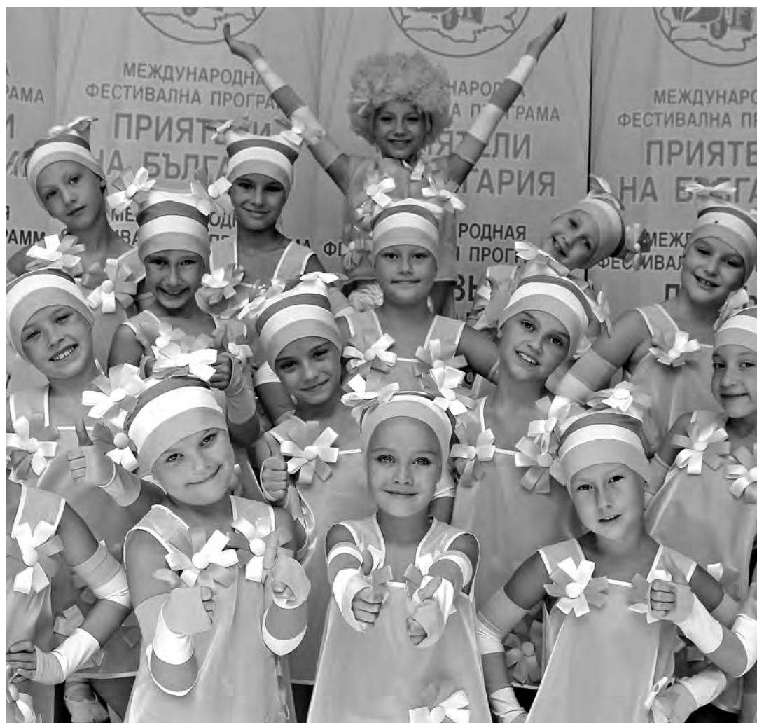
■ Девчонки успели не только отлично поработать, но и прекрасно отдохнуть.