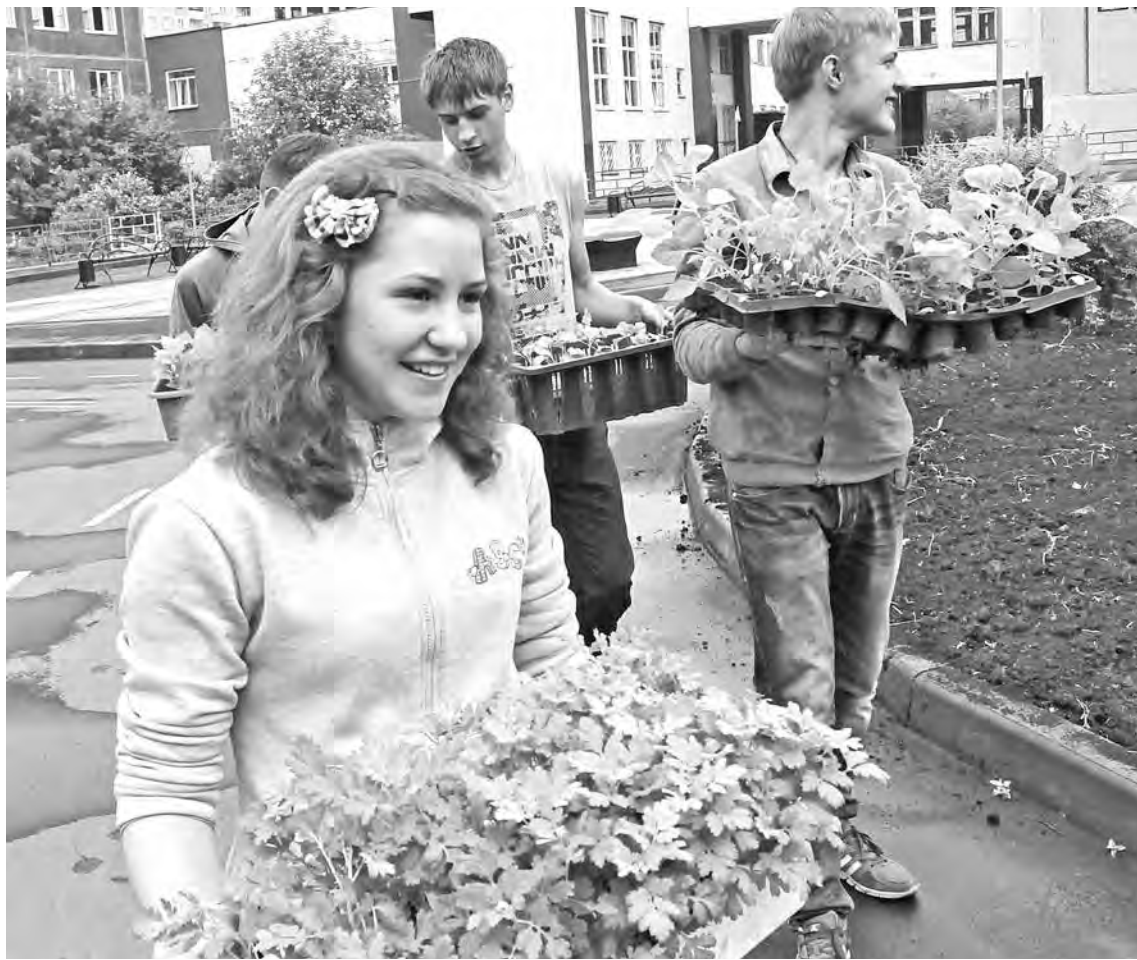
■ Молодым людям и самим может понравиться трудиться. Важно их к этому приучить.

- Детям нужна трудотерапия. Во-первых, она не только наглядно демонстрирует ценность труда, но и какие-то навыки прививает. Второе: у ребенка появятся его честно заработанные деньги. В-третьих, знания, полученные в школе, можно в дальнейшем приложить на практике. Сам я, например, работал на каникулах с 7-го класса, а с 8-го – уже на заводе: паял платы, гайки крутил. Это было и почетно, и полезно, и деньги появились. Трудиться детям стоит лет с 14, раньше не нужно,