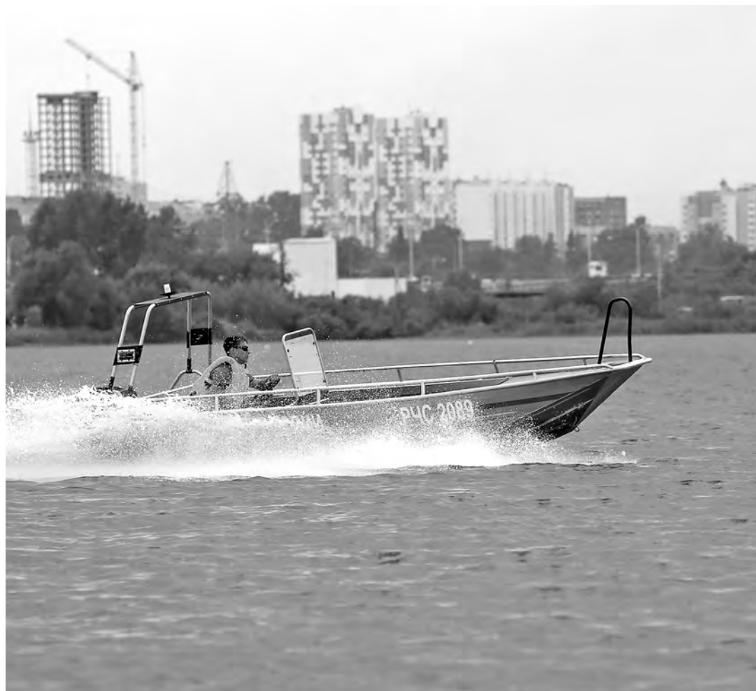
■ В VII чемпионате по водно-моторным соревнованиям среди команд ГИМС принимают участие 12 дружин со всей Сибири.