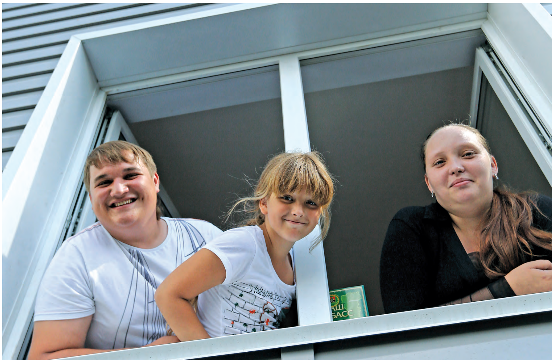
■ И внутри новых домов уютно, и на территории возле них обустроены автостоянка, детская площадка, зелёные зоны.