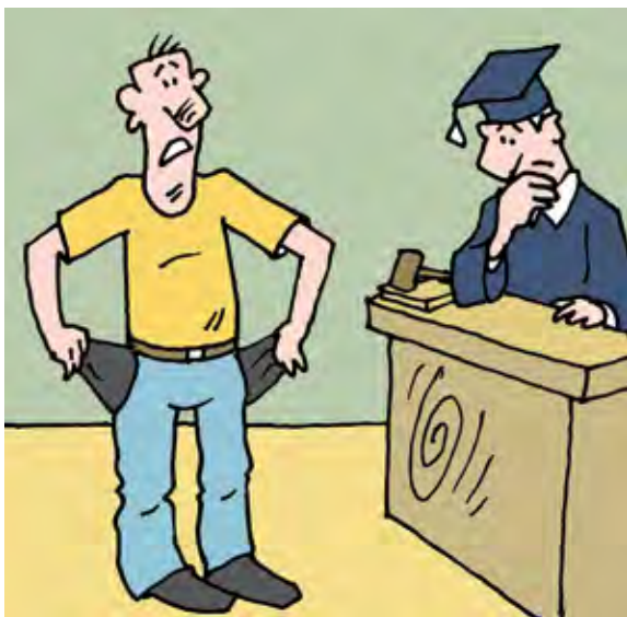
Рисунок Андрея Горшкова.