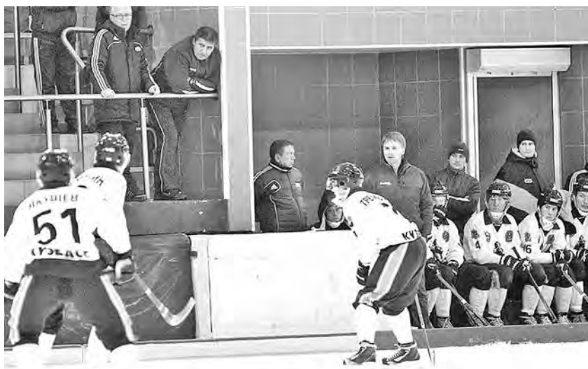
■ Уже в начале августа хоккеисты «Кузбасса» проведут первые в межсезонье тренировки на льду кемеровского Дворца зимних видов спорта.

«Кузбасс» в стартовый день соревнований сыграет с молодёжной сборной страны и хабаровским «СКА-Нефтяником». Кстати, тренерский штаб дальневосточников недавно пополнил бывший наставник кемеровчан Сергей Большаков. Наш земляк будет помощником Михаила Юрьева,