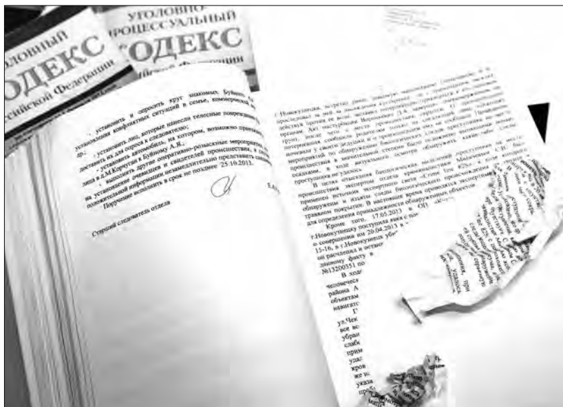
■ И хотя большая часть уголовного дела от зубов жулика не пострадала, несколько листов все же пришлось восстанавливать.