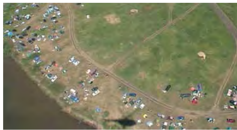
■ С высоты птичьего полета несанкционированные пляжи и места отдыха у водоемов видны очень отчетливо.