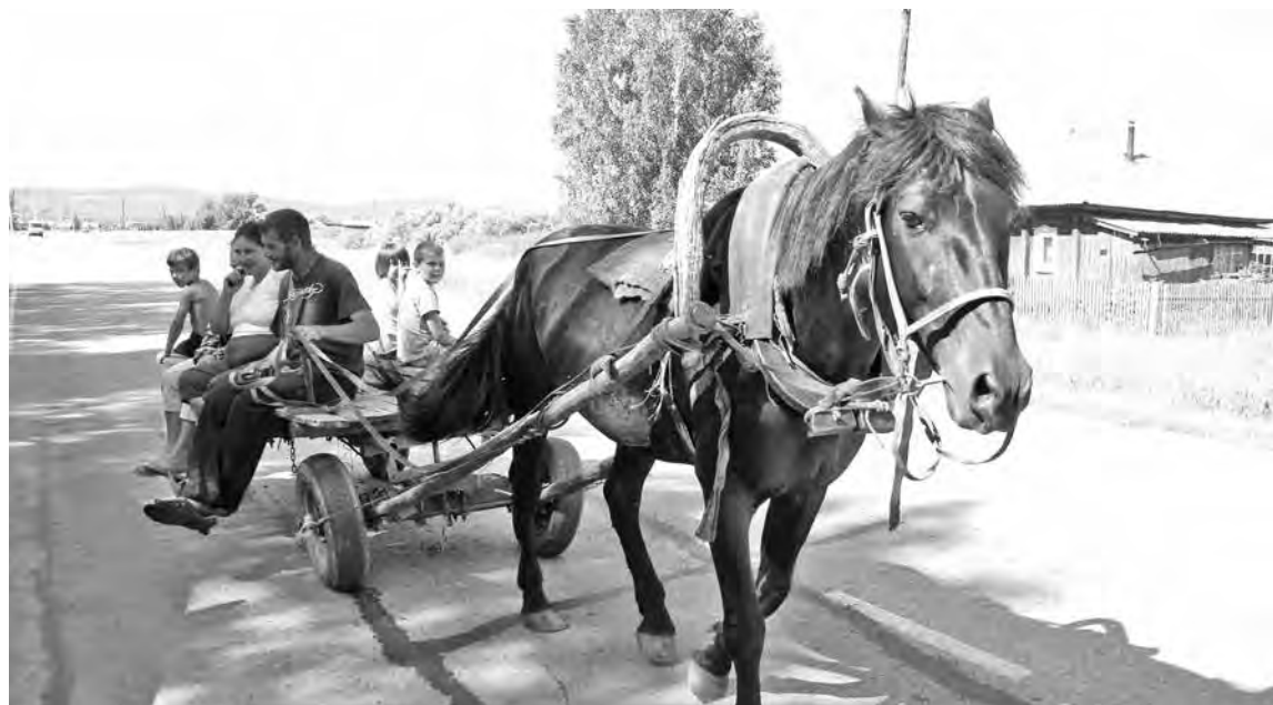
■ Неужели и в XXI веке селянам до райцентра придется добираться гужевым транспортом?