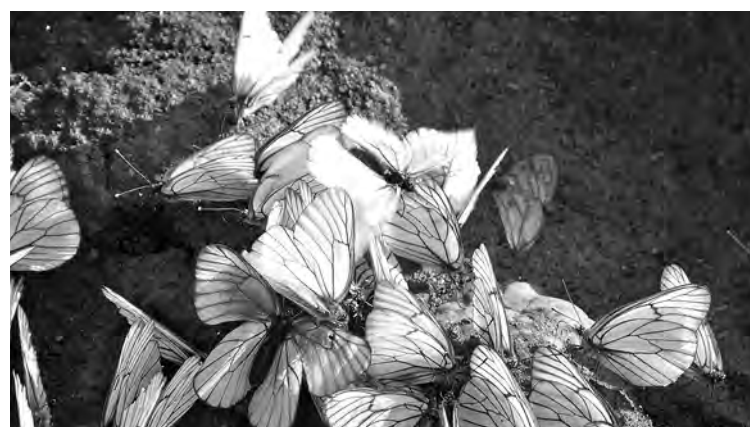
■ Боярышница этим летом для дачников не страшна.