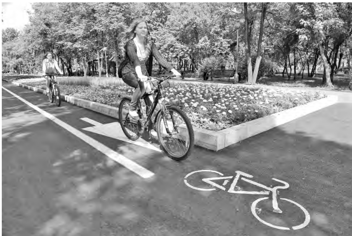
Велосипедисты уже опробовали новую велодорожку.