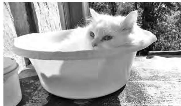
Животные тоже ищут спасения от жары.