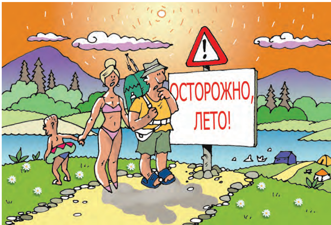
■ Рисунок Андрея Горшкова.

– Мои детки летом сильно страдают от укусов мошки. Начинается дикая аллергическая реакция, зуд. Поэтому в нашей аптечке в этот период всегда есть антигистаминные препараты и фенистил-гель. Пытаемся бороться с этим гнусом всеми возможными способами, химию не применяя, так как малыши еще совсем маленькие. Ванилин, перемешанный с детским кремом (или натуральные ванильные духи от Ив Роше), эфирное масло гвоздики – всё это помогает, но только на время. А недавно приятельница подсказала, что мошку можно выкуривать,