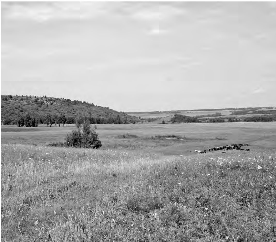
■ На беловских просторах.

Оперативники управления экономической безопасности и противодействия коррупции ГУ МВД России по Кемеровской области выяснили, что обвиняемый незаконно подделал и использовал доверенность, ко-