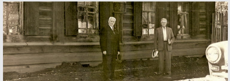
Братья Булгаковы около дома Достоевского в Кузнецке, конец 1950-х годов.