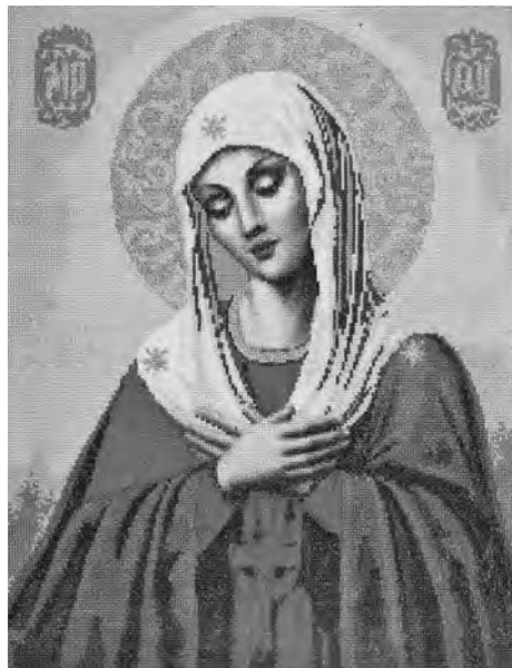
■ Иконы как ангелы-хранители.

Спрашиваю Ольгу Владимировну, какая картина (иначе не назовешь эти искусные ра-