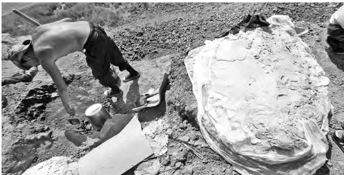
■ На раскопках в Шестаково, лето-2014.

Первого же крокодила под Шестаково откопал именно он, в далекой уже экспедиции 1997 года. Та экспедиция была срочной, даже экстренной. Ведь после первой косточки динозавра, случайно найденной в 1953 году Иваном Ефремовым из Палеонтологиче-