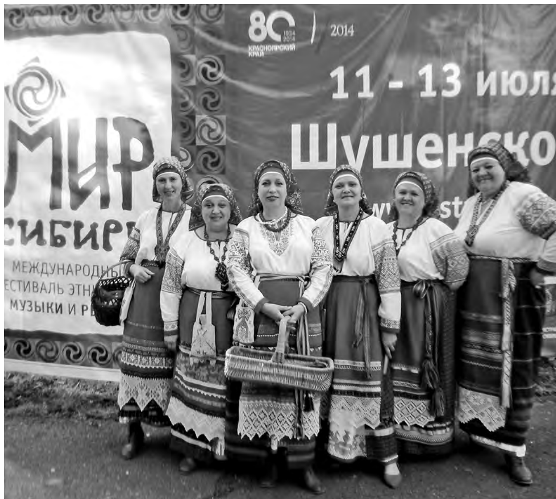
■ Участники коллектива новокузнецкого Центра традиционной русской культуры «Параскева Пятница» на Международном фестивале этноса, музыки и ремесел «Мир Сибири».