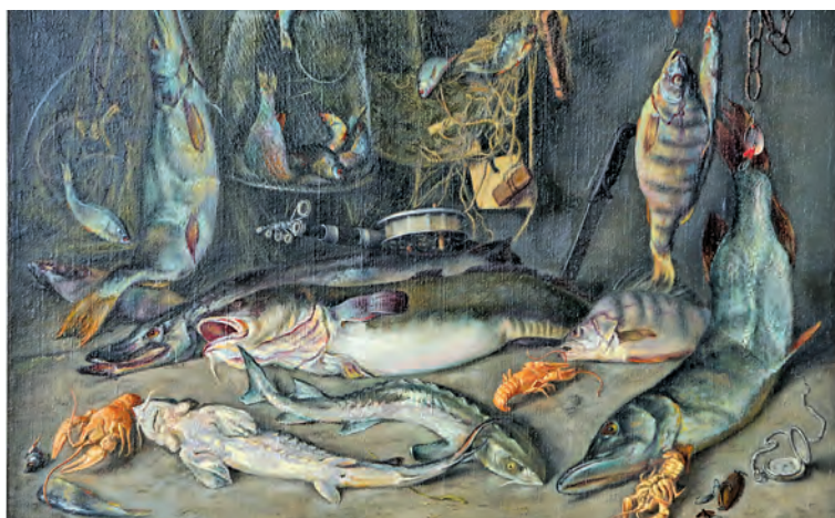
■ Сергей Панаркин. «Рыба».