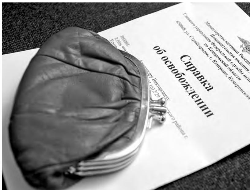
■ С помощью справки об освобождении уголовник-рецидивист украл кошелек и опять угодил за решетку.

– Пенсионерка плохо запомнила приметы своего соседа по очереди в кассу, зато видео с камеры наблюдения дало довольно четкую