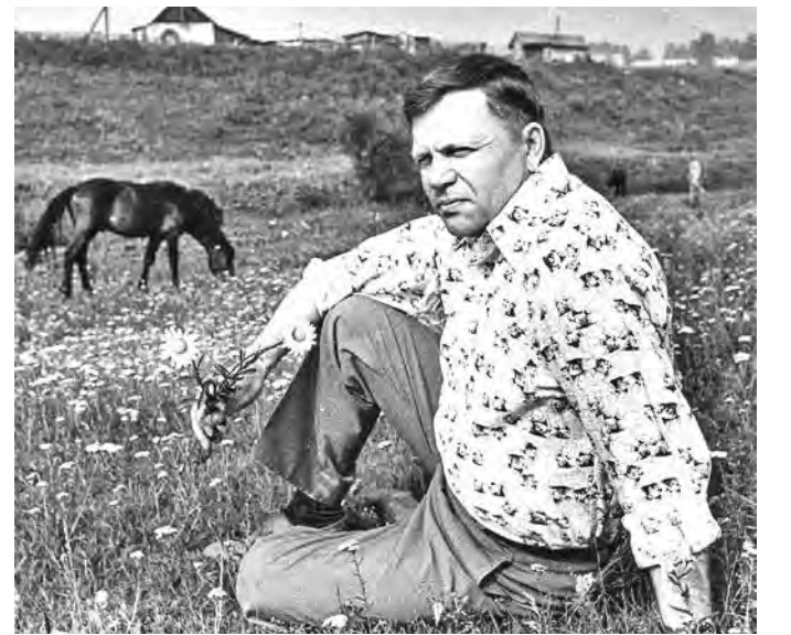
В. Дедюево, сентябрь, 1983 г.