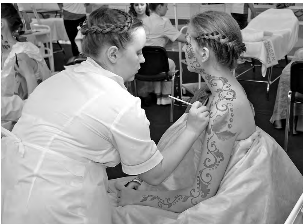
На всероссийском конкурсе профессионального мастерства Танины идеи высоко оценили члены профессионального жюри.