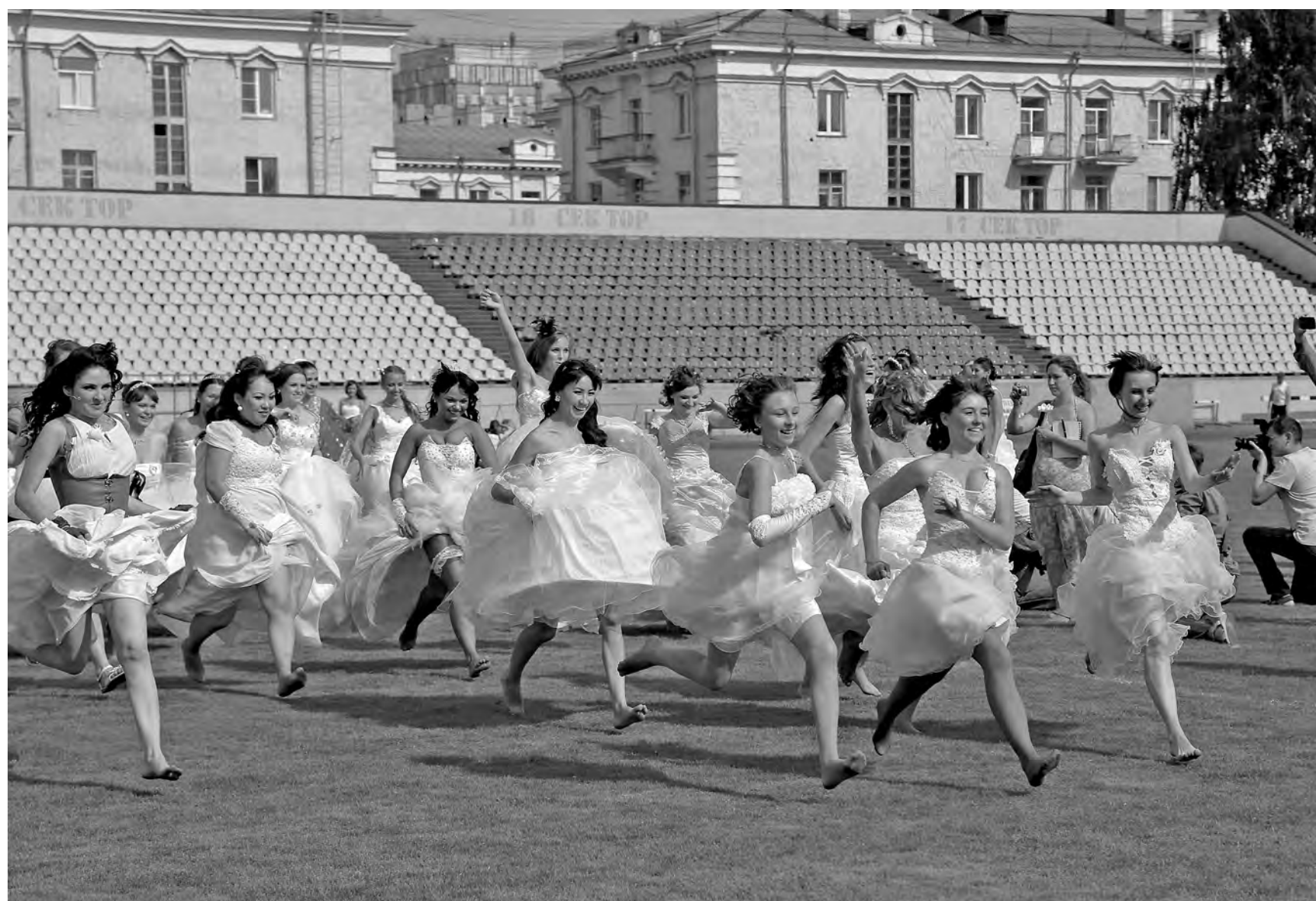
Пока есть такое понятие, как «Высочиться замуж», будет и такое: «Пожили — и разбежались».