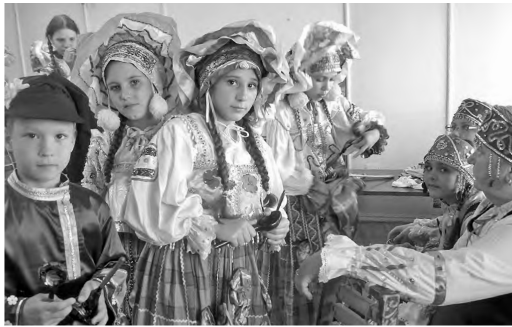
«Сибирский тусек» перед концертом.