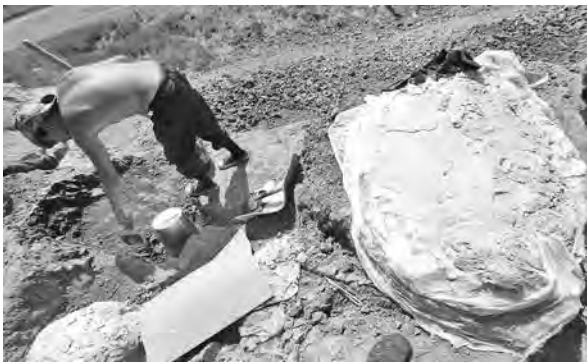
Раскопки на Шестаковском палеонтологическом комплексе продолжаются.