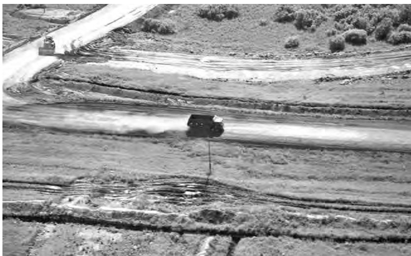
■ С вертолета хорошо видно, как загруженные «под завязку» многотонные автомобили пытаются по грунтовым дорогам миновать посты ГАИ и скрытно выбраться на большие трассы.

Чтобы избежать ответственности (штраф для перевозчиков - физических лиц составляет до 2,5 тыс. руб., для юридических - до 500 тыс. руб.), иные пойманные нарушители пытаются «договориться» с дотошными инспекторами ГАИ. С начала года зафиксировано уже три попытки дачи взятки полицейским водителями большегрузов. Теперь, кроме административной ответственности, их ждет еще и уголовная статья.