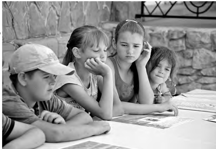
■ Такой отдых помогает ребятам узнавать много нового о родном крае.