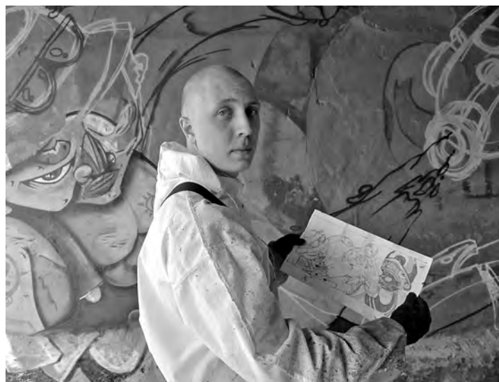
■ Главная задача фестиваля – привлечь внимание к творчеству граффити.