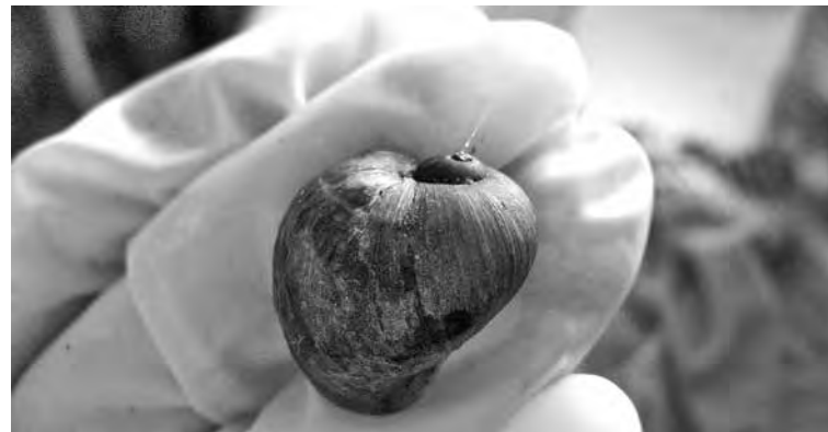
Моллюск-прудовик - переносчик паразита.

Так что же нашел академик? И что годы спустя подтвердил кемеровский школьник, победив со своим исследованием на областной конференции «Экология Куз-