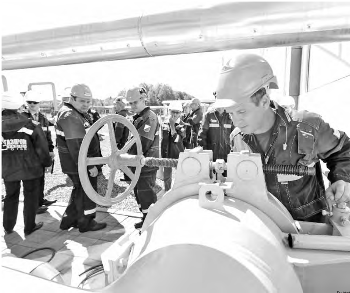
■ Участники фестиваля профессионального мастерства.

– В этом году можно констатировать факт: только один из