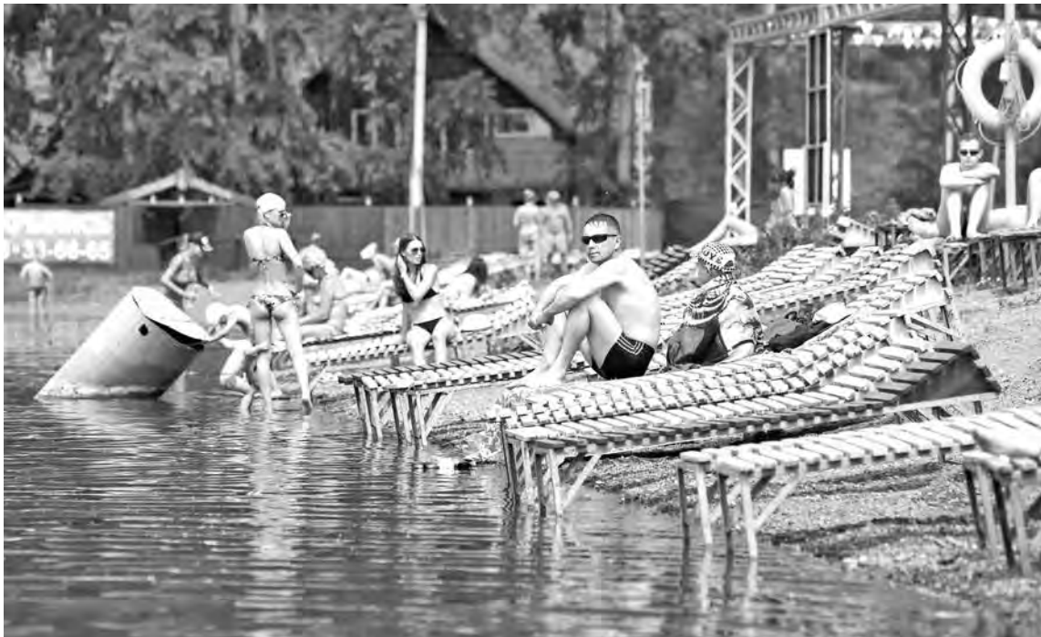
■ Красное озеро – излюбленное место отдыха кемеровчан. Именно здесь разрешено купание, потому что владельцы пляжа позаботились о безопасности отдыхающих.