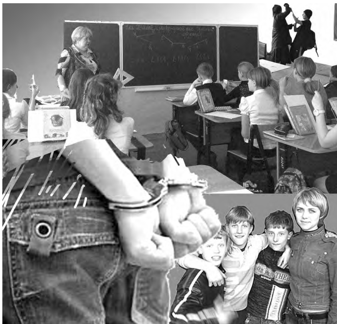
Коллаж Андрея Горшкова.