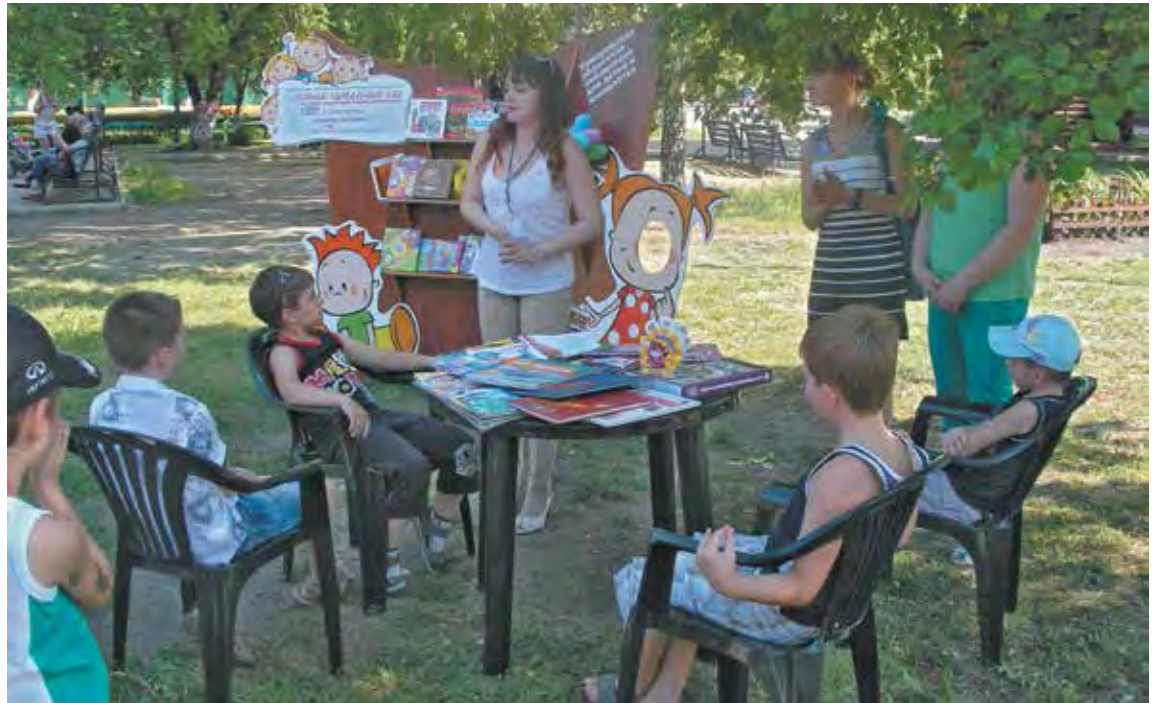
■ В «летнем читальном зале» можно не только воспользоваться бумажными книгами, но и закачать в свои мобильные устройства электронные.

Еще одна важная особенность здешней виртуальной библиотеки заключается в том, что получить книжку на собственный мобильный носитель можно только при условии, если он работа-