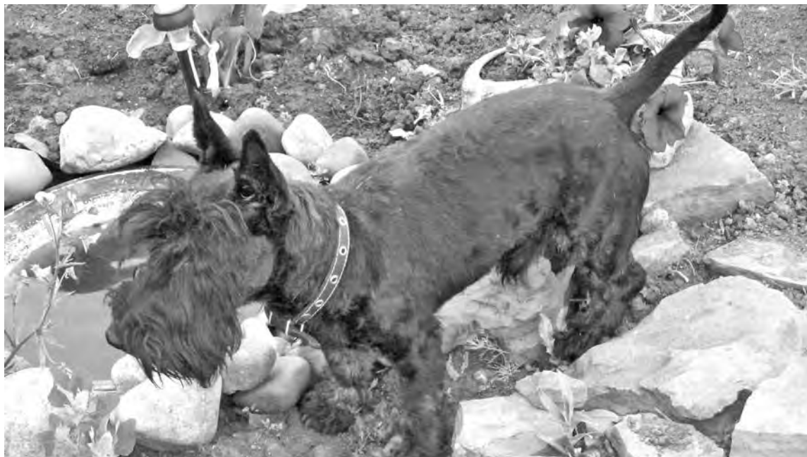
■ Из новых поступлений: «Напиться или искупнуться?»