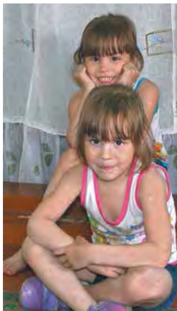
■ Близняшки Виолетта и Виктория.

В общем, после всяких проверок-перепроверок, взвешивания всех «за» и «против», семейный