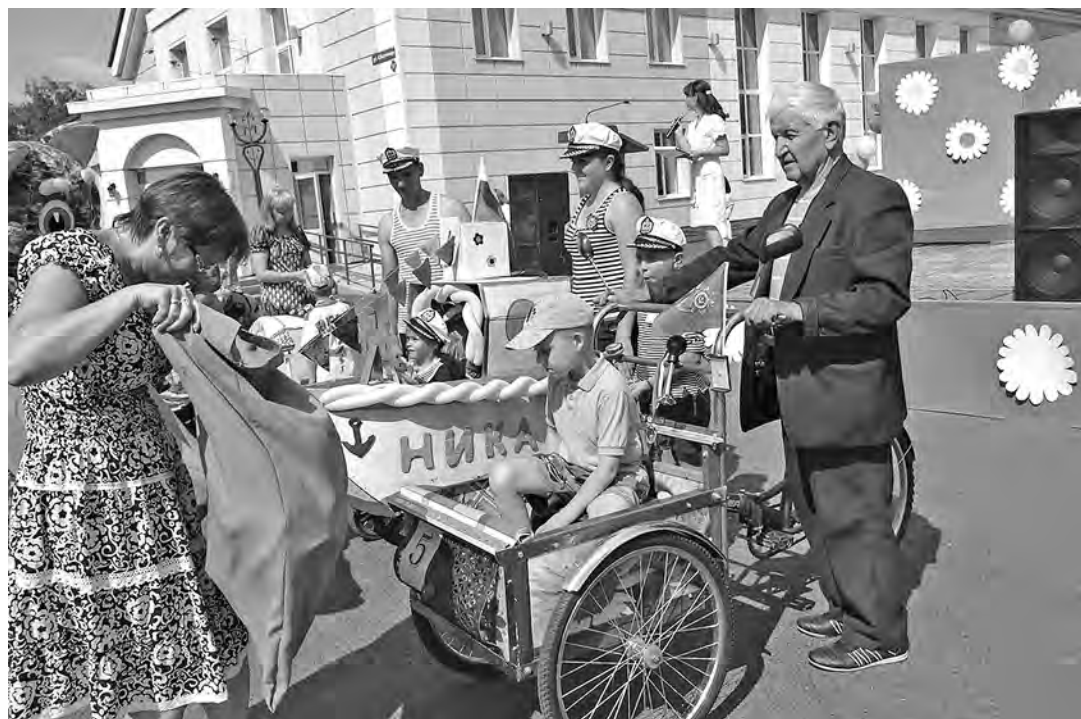
■ Парад колясок – не просто конкурс, а новый семейный праздник.