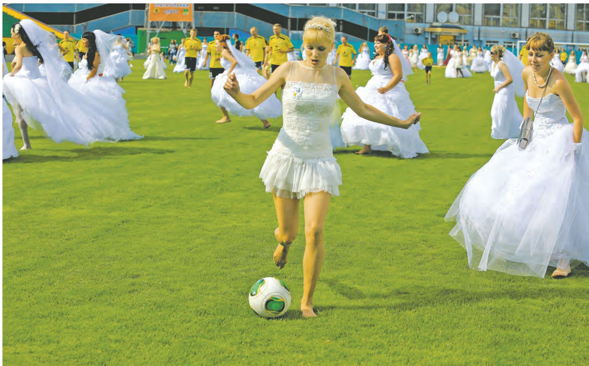
■ Невесты катались на коньках и байкерских мотоциклах, в лимузинах и каретах и даже сыграли дружеский матч с футболистами ФК «Металлург-Кузбасс».