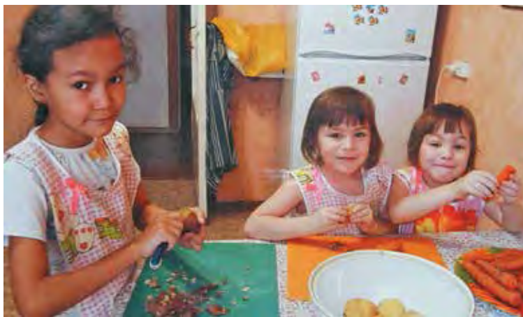
■ Помощницы что надо!

в Юргу. Это были, как их сейчас называют, лихие девяностые годы. Многие с содроганием вспоминают то время безденежья и пустых полок в магазинах.