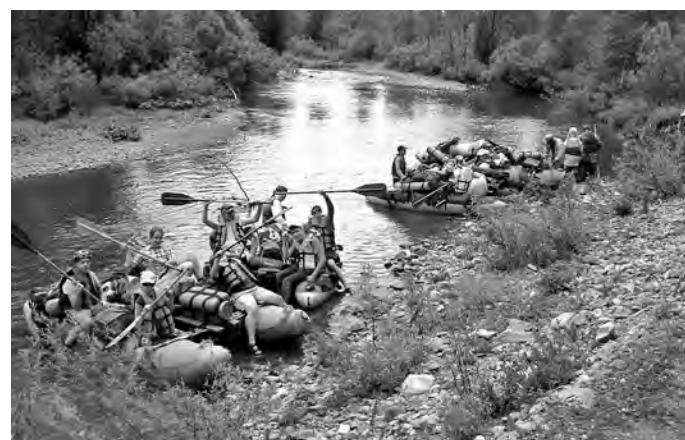
■ Участники исторической экспедиции.