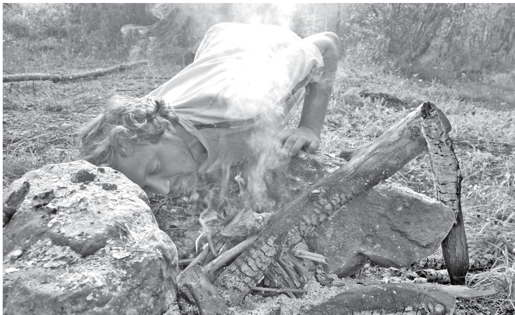
Главное во время отдыха на природе – не «раздуть» из небольшого костра большой пожар.

В Кемеровской области за период с 13 мая по 2 июля этого года лесные пожары не зарегистрированы. Тем не менее в ряде районов сохраняется высокая пожароопасность.