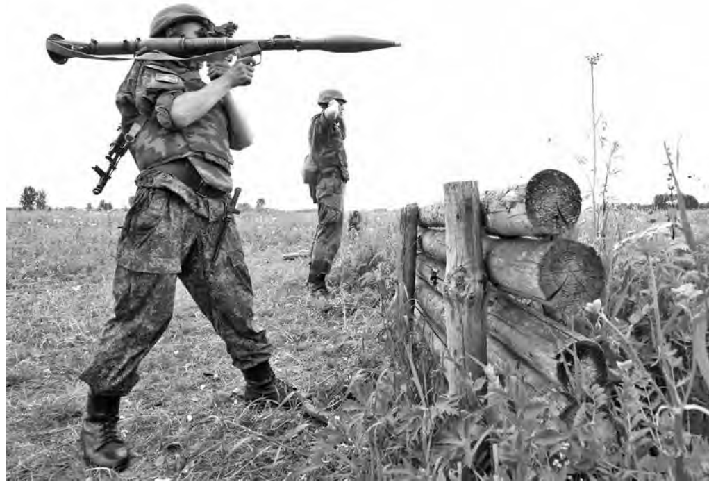
Одним из элементов подготовки полицейских является стрельба из ручного противотанкового гранатомета.