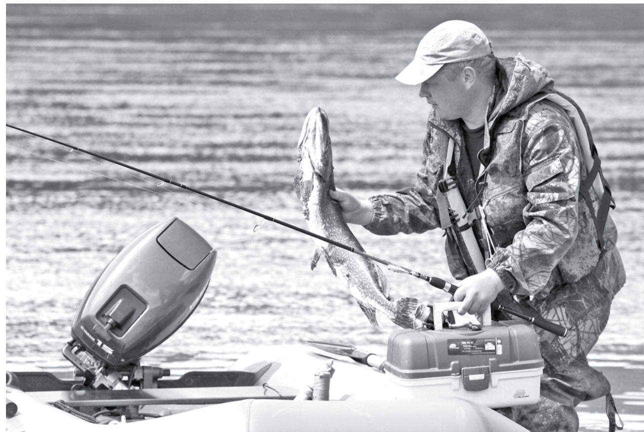
НЕ ПО ЩУЧЬЕМУ ВЕЛЕНИЮ. Вот такую щучку – в 3,5 килограмма – выловили на днях в Томи рыбаки из села Новороманово Юргинского района. По их словам, это самый подходящий вес для ухи, да и вообще только начался хороший клев щуки. Раньше рыбалка на реке как-то не задавалась: был большой уровень воды, и к тому же она была мутной.