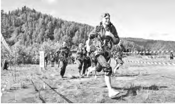
Ежедневно в палаточном лагере проходят различные соревнования.