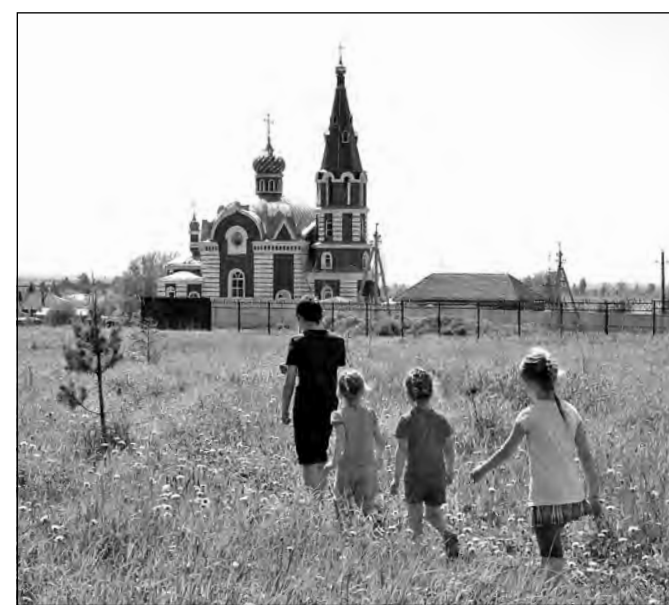
На дороге к храму.