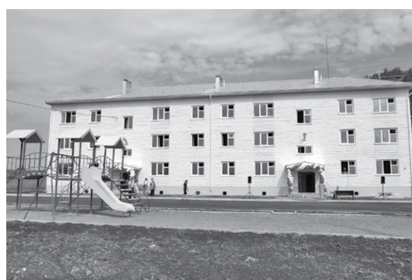
Новый дом в Гурьевске.