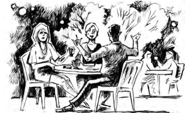
Рисунок Андрея Горшкова.

— Как опасный рецидивист настолько легко вошел в доверие к вполне порядочным молодым женщинам? — интере-