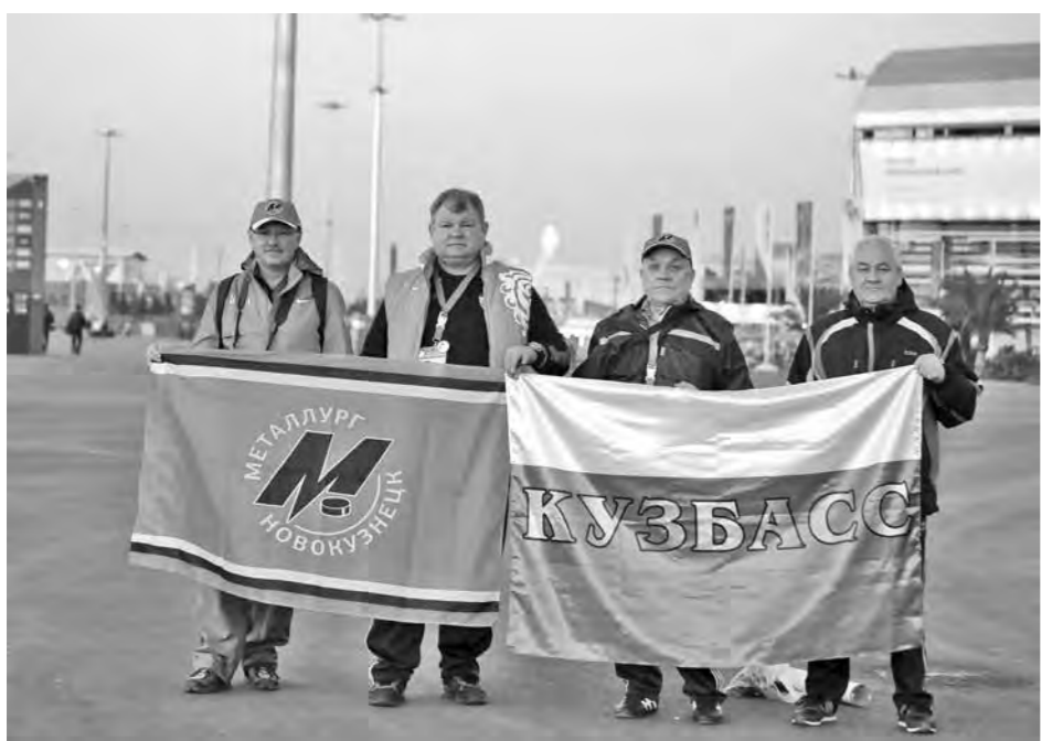
Наши болельщики на Олимпиаде в Сочи.