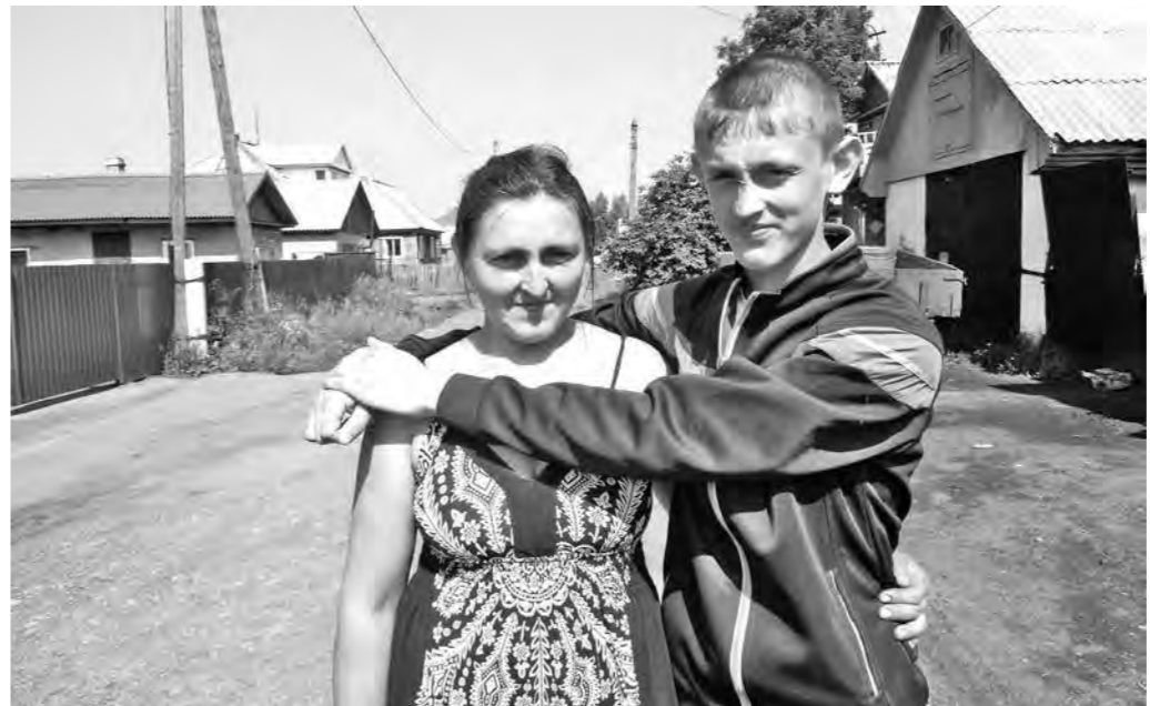
Мама Сережи говорит, что сын в рубашке родился.