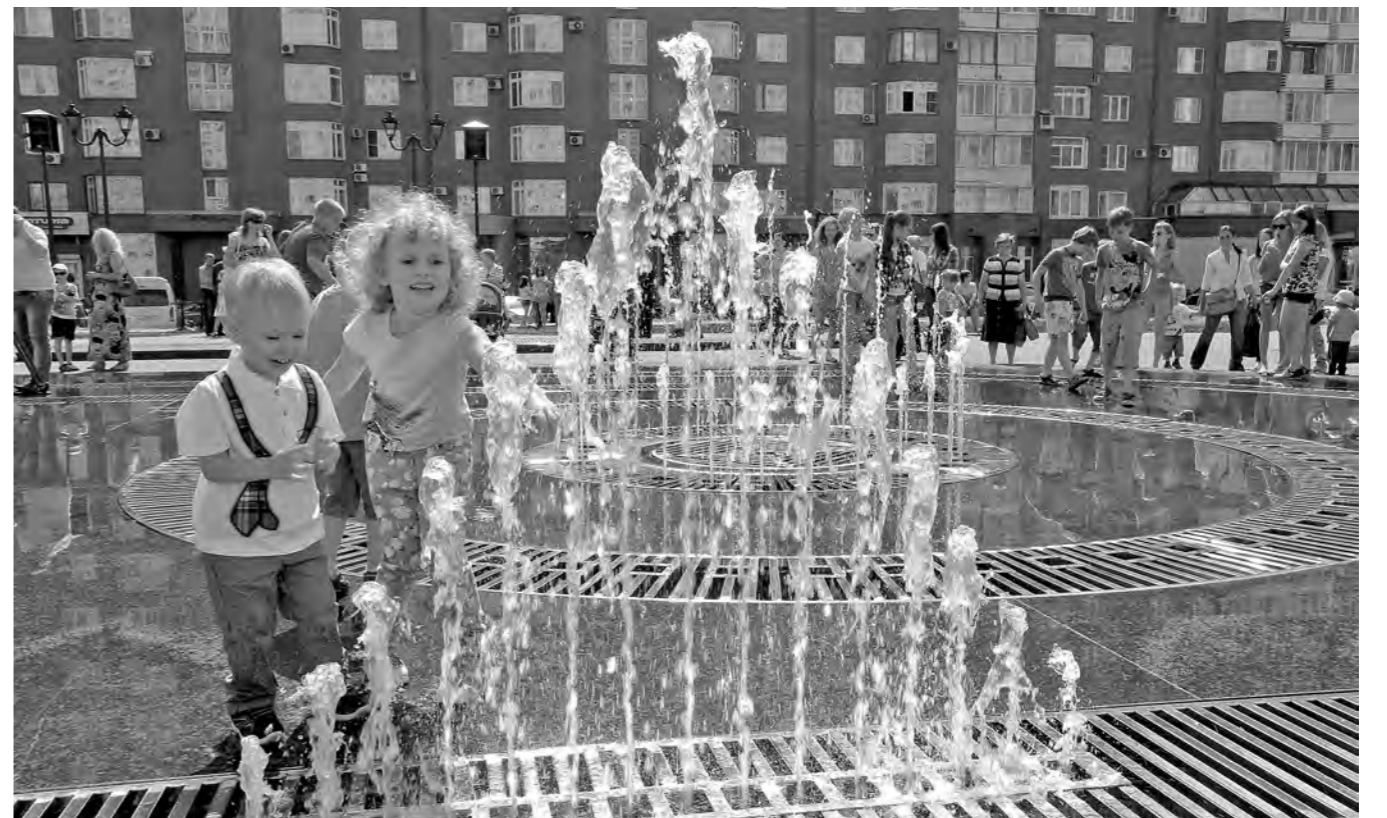
«ТАНЦУЮЩИЙ» ФОНТАН вчера открыли в Новокузнецке. Он к тому же еще и светомузыкальный. Новая достопримечательность расположена в самом центре Новокузнецка – сквере Ермакова. В основе конструкции – оборудование из Италии и Турции. Только одних форсунок и светильников более 350, а воду на высоту до 26 метров будут подавать 30 насосов высокого давления. Струи, «танцуют», будут бить в нескольких режимах, а дополнят это яркое шоу музыка и свет. В репертуаре – 14 музыкальных композиций, а в палитре красок – все цвета радуги.