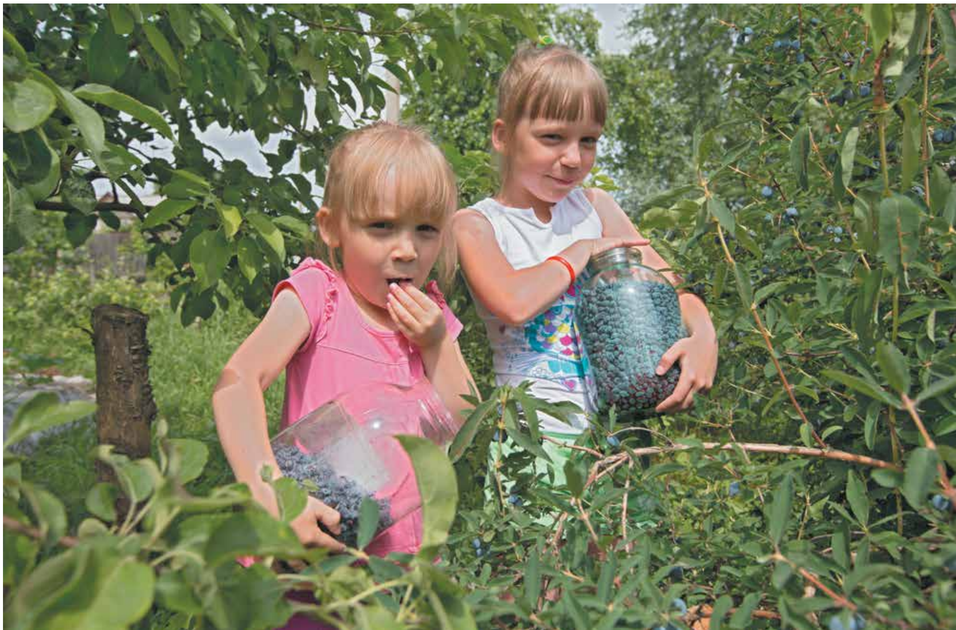
■ Полезные свойства жимолости, этой самой ранней ягоды, поистине удивительны. Однако ее сезон быстро заканчивается, а хранится ягода плохо. Поэтому жимолость нужно сразу съесть, замораживать или варить из нее компот, варенье, к примеру.