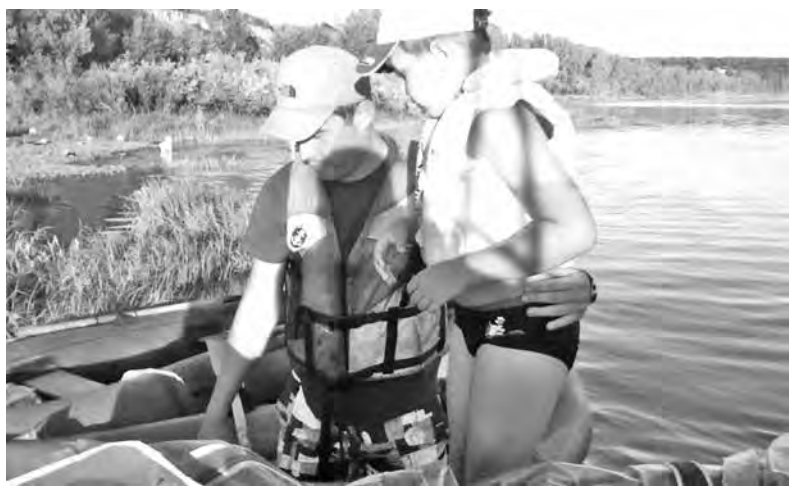
■ Все путешественники после спасения чувствуют себя хорошо.