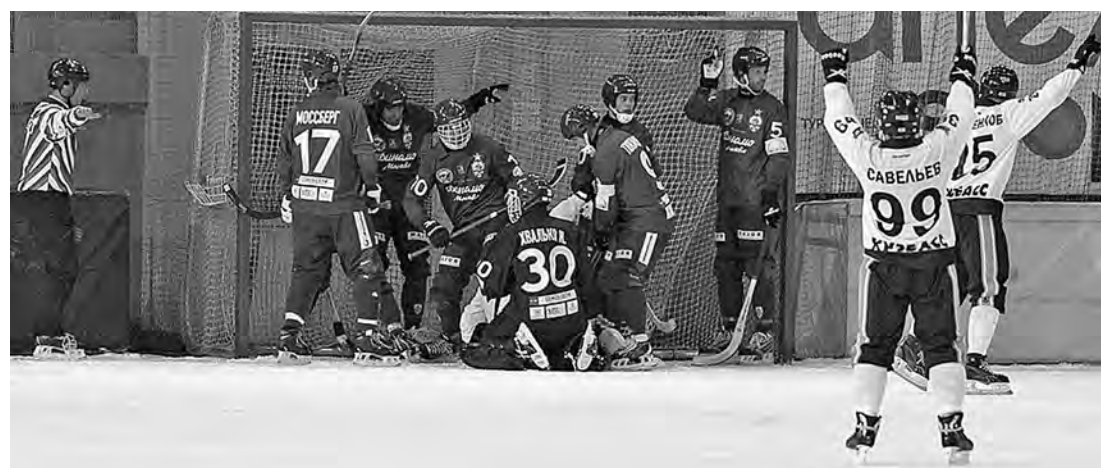
■ На первом этапе Кубка России-2013 «Кузбасс» сенсационно переиграл тогдашнего чемпиона страны московское «Динамо» – 5:2.