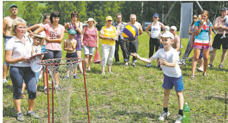
■ Семейные старты.

Подогретый чемпионатом мира в Бразилии накал страстей переносится и на площадки по мини-футболу корпоративной спартакиады. Здесь в упорной борьбе лидерство энергично вырвала команда СКЭК, заняв в итоге первое место в турнирной таблице.