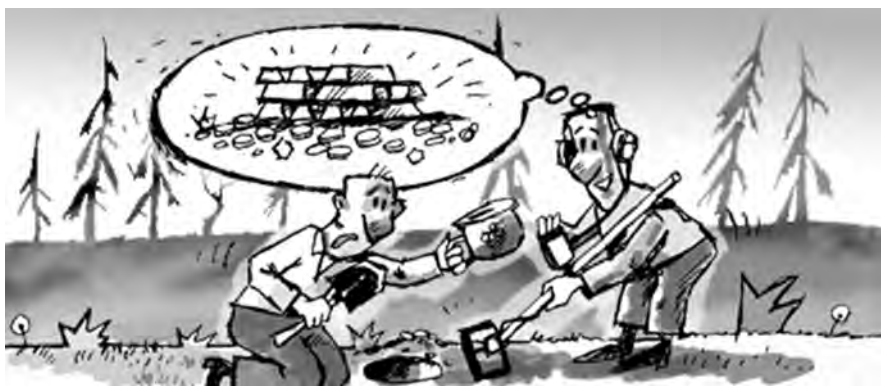
■ Рисунок Андрея Горшкова.

Кстати, как рассказали нам в одном из кемеровских интернет-магазинов, спрос на «главный инструмент современного кладоискателя» сегодня действительно есть. В настоящее время средняя стоимость металлоискателя – 12 тысяч рублей. На продажу нет никаких запретов, и купить его может любой желающий.