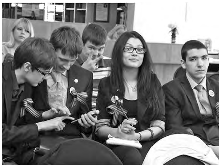
■ Лицейское братство.

Вузовские преподаватели КузГТУ, которые, понятно,