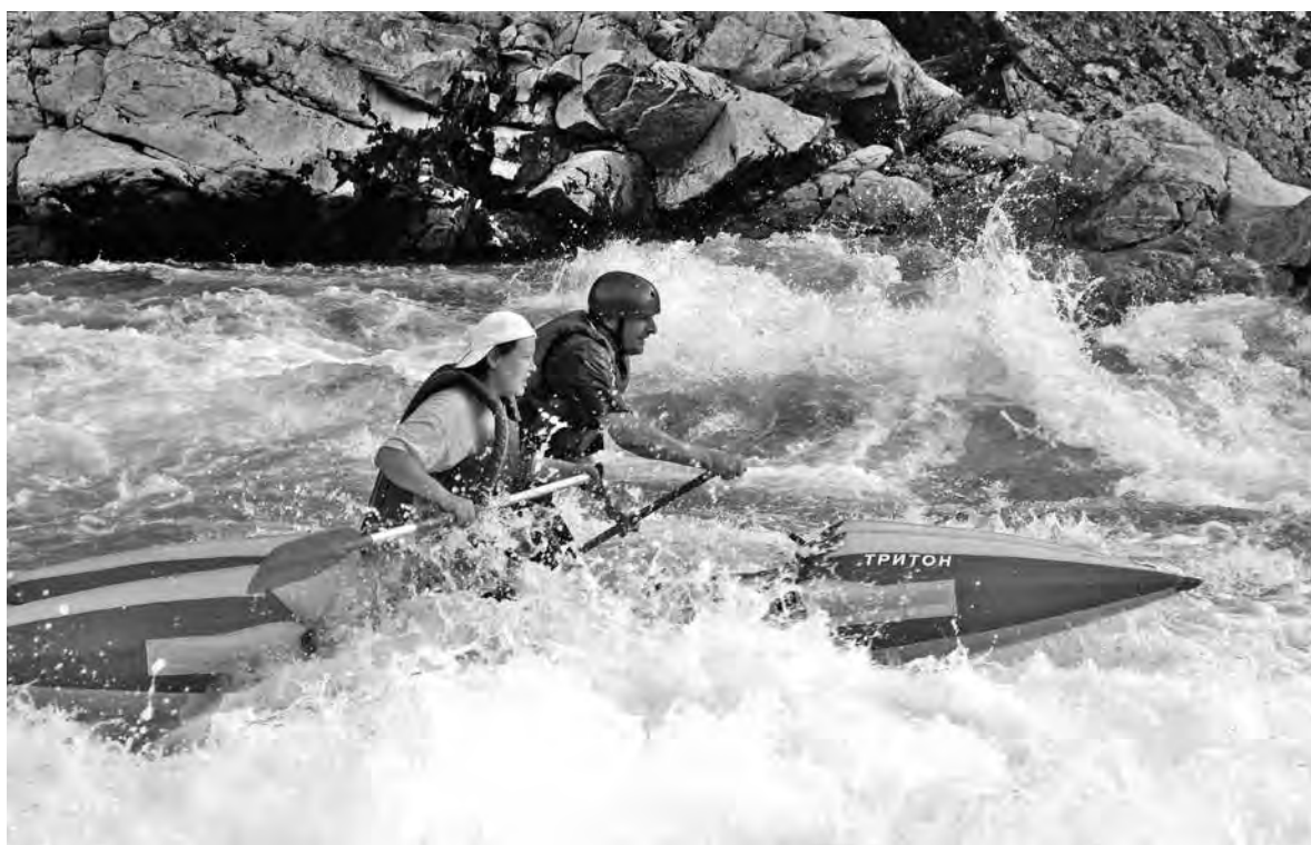
■ На таких соревнованиях важна не только скорость прохождения трассы, но и умение ориентироваться на воде, обходить опасные участки.