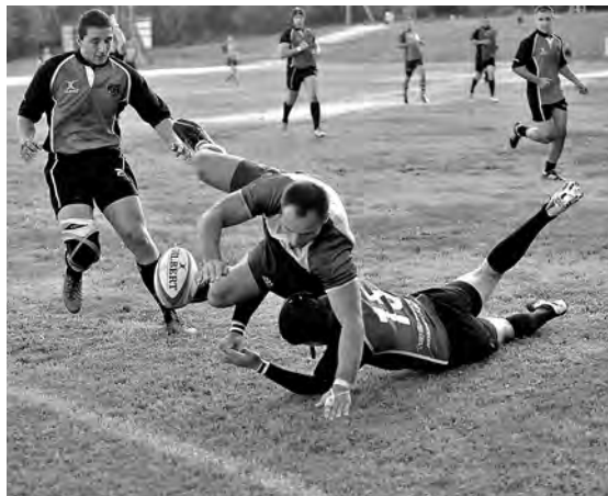
■ В предыдущей домашней игре с «Булавой» новокузнецчане тоже были сильней соперников.