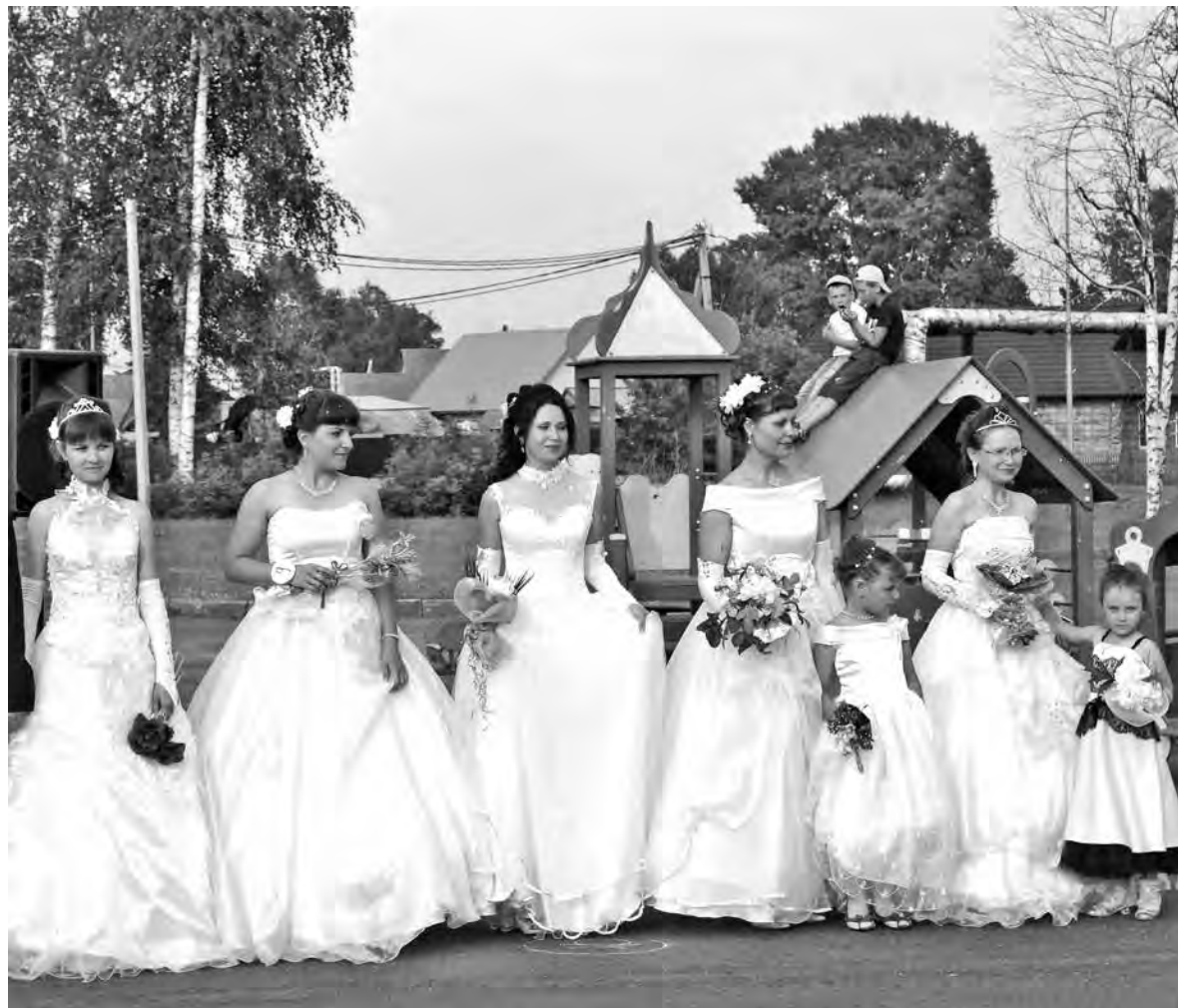
Весело, воздушно, красиво...