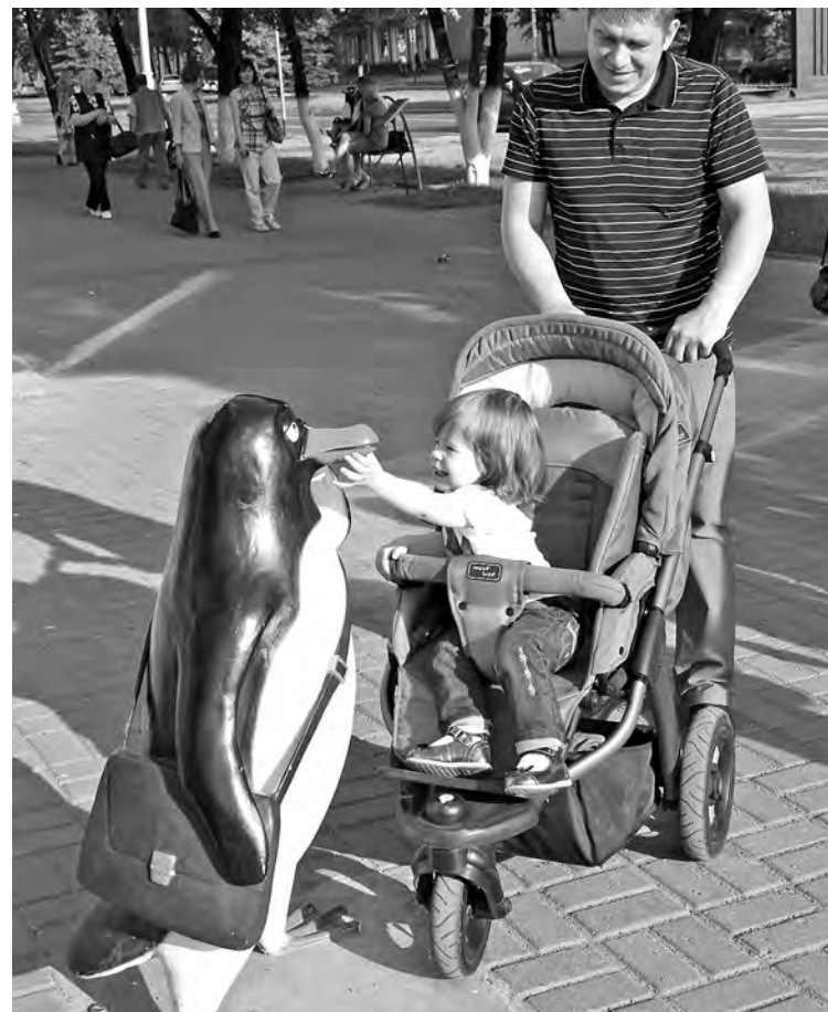
■ Лету рады и дети, и пингвины.

– Мне кажется, когда заранее планируешь, время не проходит зря. И я по любому поводу пишу списки. Даже летние месяцы распланированы, чтобы впечатлений было много, событий – море, эмоций – шквал. Что входит в мой наивный девичий список? Купить новый летний шарф. Быть добрее. Выучить испанский. Послушать пение птиц в пять утра. Вырастить цветок. Питаться здоровой пищей. Сделать фотку под водой. Поспать более 12 часов. Выйти в поле, чтоб