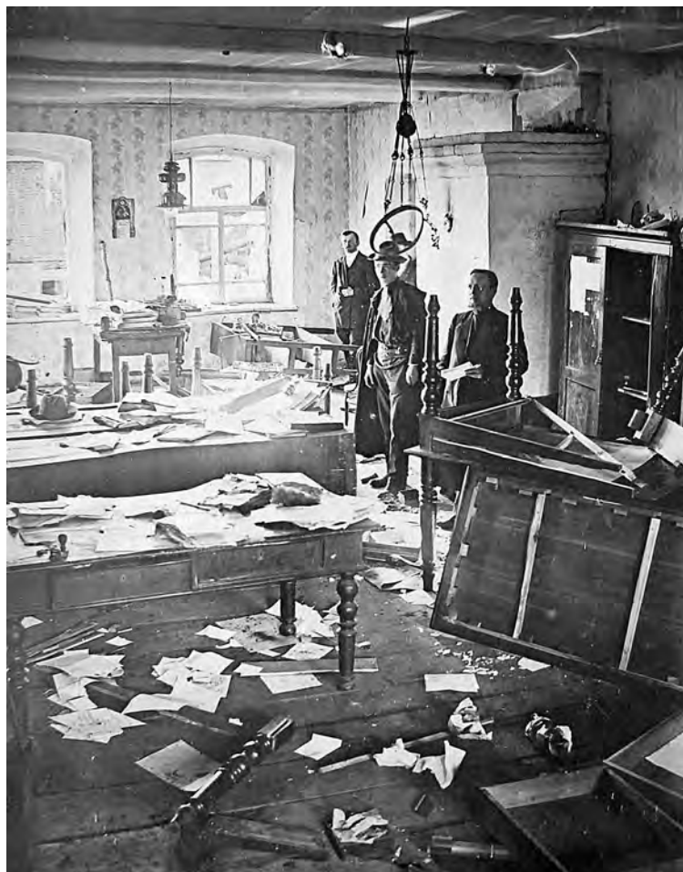
Здание полиции Мариинска после пьяного бунта мобилизованных на войну, 1914 год.

- Часть спиртного и товаров была захвачена. А дальше было «вновь совершено нападение на винный склад. Произошло это при следующих обстоятель-