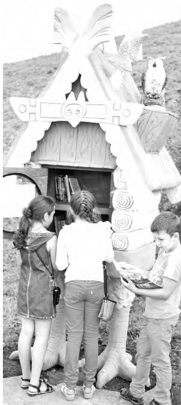
■ Изба-читальня сразу привлекла внимание местных ребятшек.