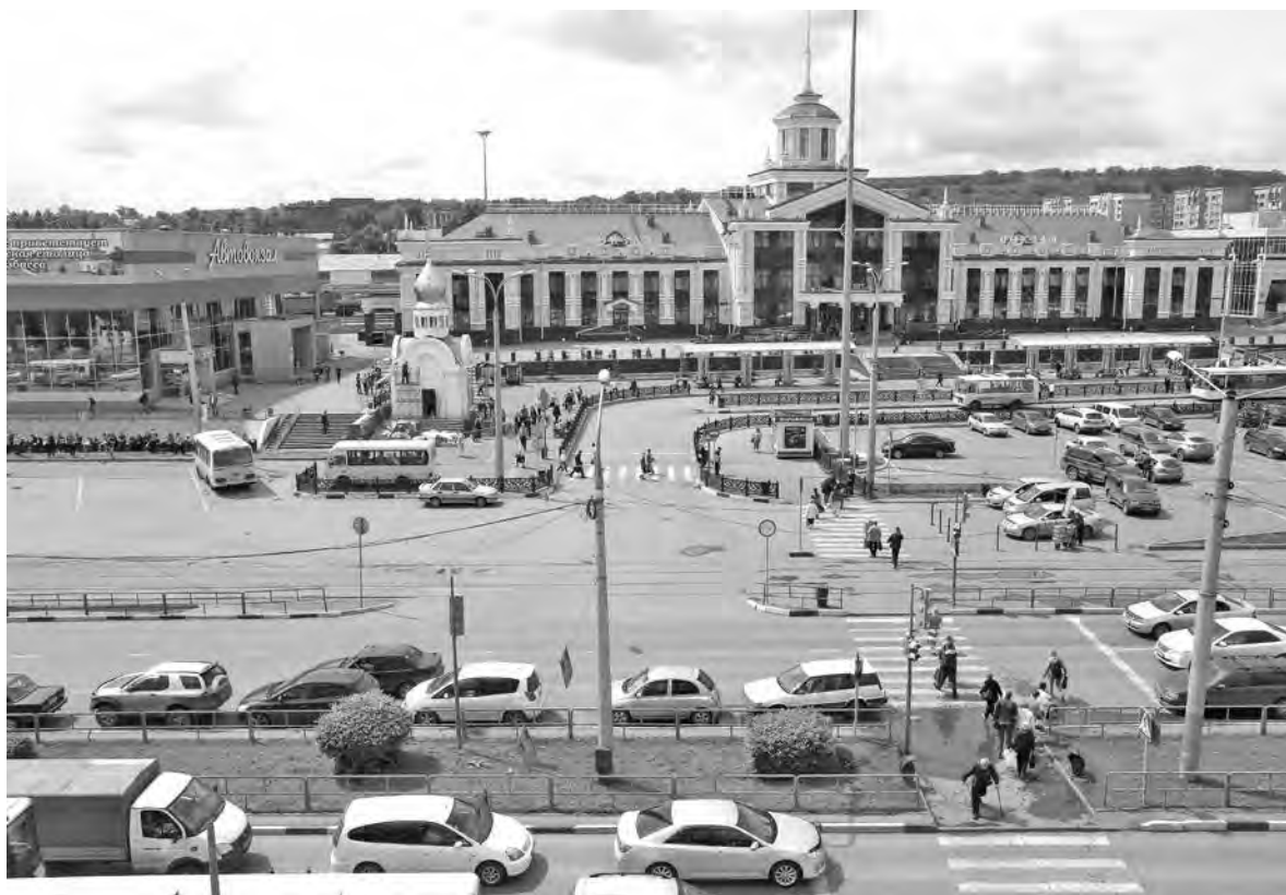
■ На жизнедеятельности железнодорожного вокзала авария не отразилась.