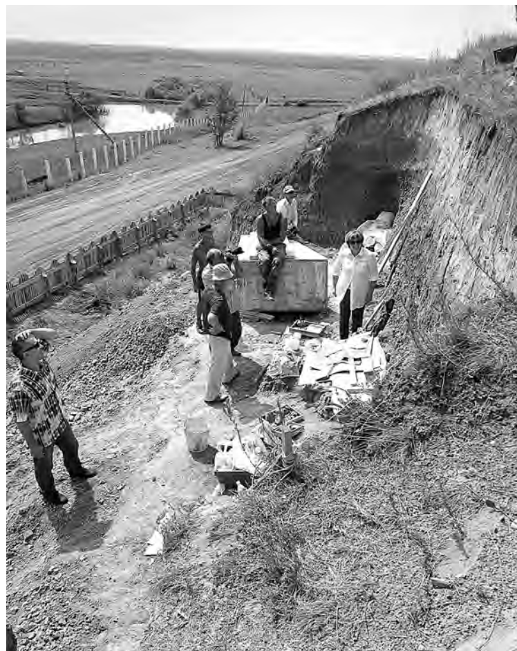
■ Передовой край науки – раскопки на комплексе Шестаково-3.