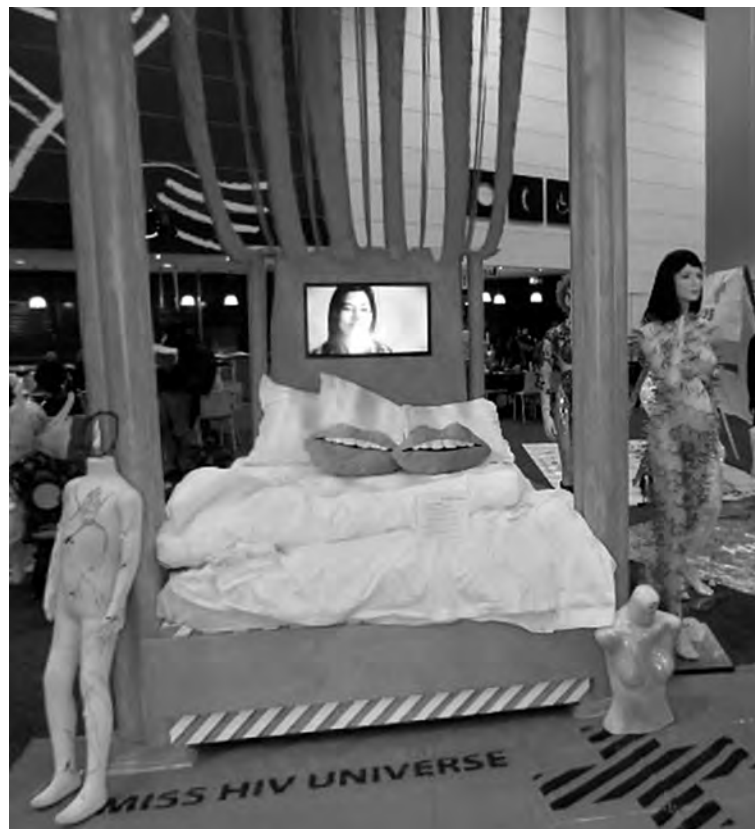
■ Один из павильонов «Глобальной деревни», призванный подчеркнуть особую роль женщин в эпидемии ВИЧ.

Впрочем, на XX Международной конференции по СПИДу о «Снижении вреда» говорилось, скорее, через запятую. Ежедневная программа включала порядка 65-70 заседаний, симпозиумов, семинаров, сессий и сопутствующих мероприятий, которые проходили на 8-9 площадках одновременно. Рефреном звучала мысль: покончить к 2030 году с эпидемией СПИДа в мире можно, современные достижения в биомедицинской сфере делают эту задачу вполне реалистичной. Лекарства, сохраняющие жизнь ВИЧ-инфицированных, уже есть, и работа по их совершенствованию продолжается. Но, чтобы свести до минимума статистику новых заражений, необходимо усилить работу в конкретных географических регионах. Сегодня 80% мировой популяции всех ВИЧ-инфицированных проживает в 20 странах. В основном это государства Африки к югу от Сахары, а также ряд крупных стран со средним уровнем дохода: Китай, Бразилия, Индия, Индонезия, Таиланд и Россия.