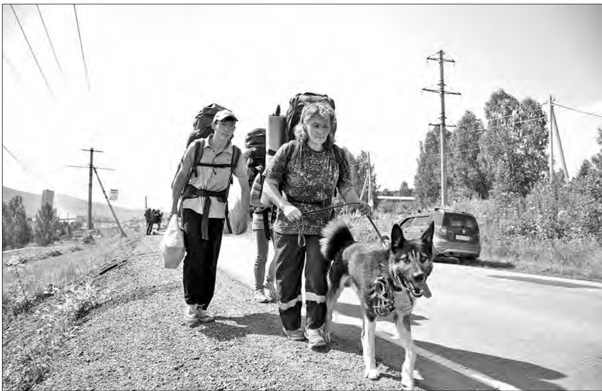
■ Летний туристический сезон в Таштагольском районе в самом разгаре.