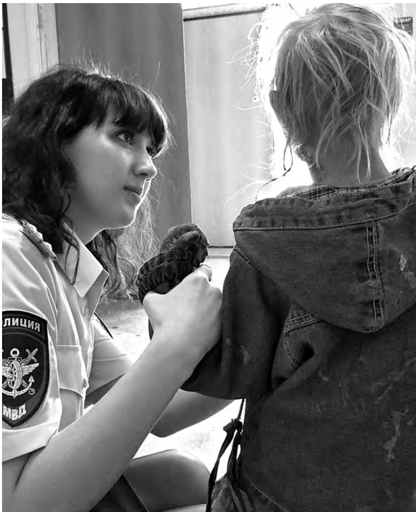
■ «Не плачь, малышка, всё будет хорошо».