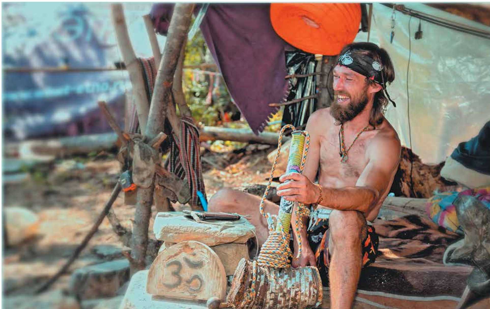
■ Турист по прозвищу Ветер, завсегда Шерегеша, только здесь ощущает настоящую свободу.