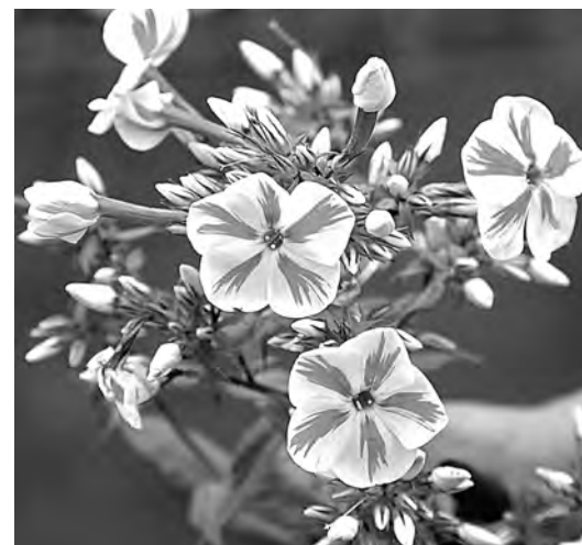
■ Новинка селекции – флокс Твистер.

Середина лета – пора цветения флоксов. Однако в этом сезоне из-за холодной весны цветение отодвинулось на неделю-другую. Но, словно стараясь наверстать упущенное, флоксы буйствуют, соперничая между собой яркостью окрасок.