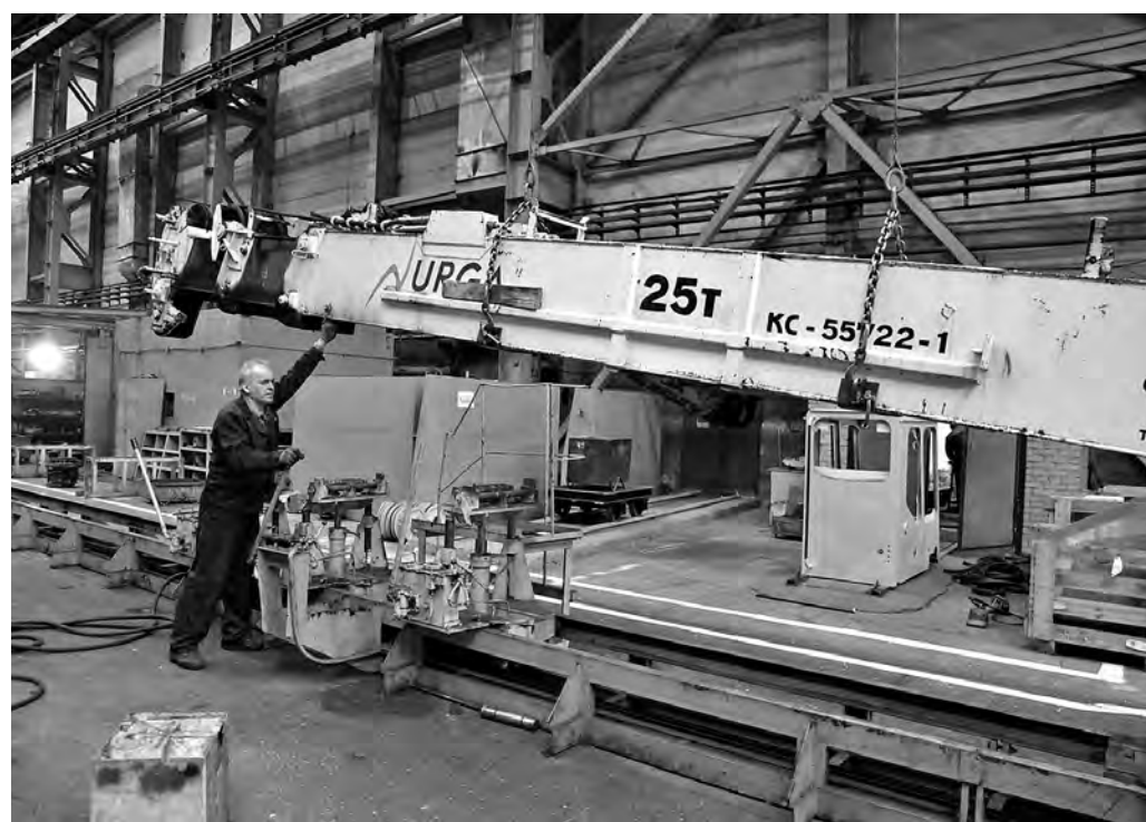
«Газпром межрегионгаз Кемерово» ограничил поставку газа «Юргинскому машиностроительному заводу» еще в мае прошлого года.

«Газпром межрегионгаз Кемерово» ограничил поставку газа «Юргинскому машиностроительному заводу» еще в мае прошлого года. Газопотребляющее оборудование должника перевели в режим экономного потребления, что сократило объем поставляемого за сутки газа почти втрое. Но режим поставки систематически нарушается. Проконтролировать газопотребления поставщик не мог — его представителей не пропускали на территорию ЮМЗ. Компания вынужде-