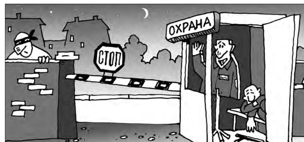
Рисунок Андрея Горшкова.

Казалось бы, подобное трудоустройство навсегда должно отбить охоту работать «втемную». Но, видимо, наверху было задумано так, чтобы я прошёл испытания до конца. Весь февраль я опять безуспешно штурмовал всевозможные охранные предприятия, отделы кадров учреждений и организаций, альтернативные биржи труда. Про последние могу сказать классическое: сплошные «рога и копыта». Так, в Кемерово работает некая региональная биржа труда. Располагается она в неприглядном, полузатрапезном здании по проспекту Кузнецкому. В тесном кабинетике сидят две бойкие девушки и скороговоркой рассказывают об условиях сотрудничества. Весь смысл их действий сводится к тому, чтобы выманить у клиента 700 рублей за составление электронной анкеты и отправить его восвояси. На вопрос, как можно пообщаться с потенциальными