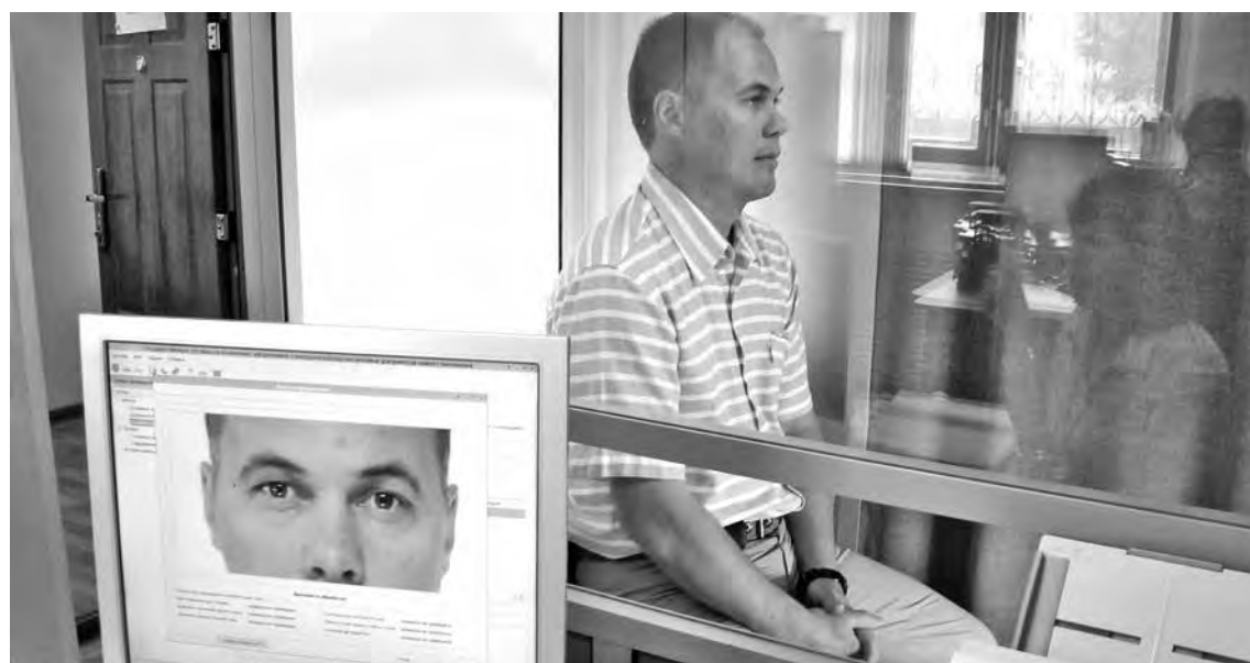
С начала 2014 г. в Кузбассе было оформлено более 56 тысяч биометрических заграничных паспортов.