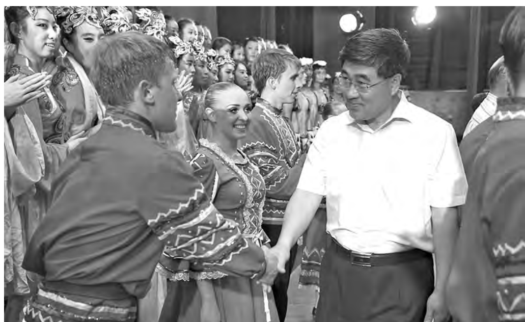
Во время визита ансамбль русского танца «Молодой Кузбасс» принял участие в церемонии открытия фестиваля искусств.