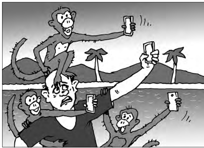
Рисунок Андрея Горышова.