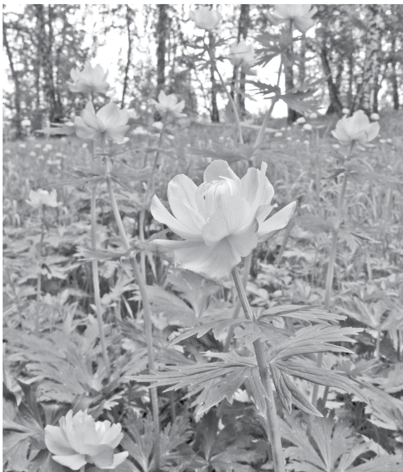
Наш огонек достоин места в «Аллее России!»

В Кемеровской области выбирают зеленый символ нашего региона. Растение, которое «победит», будет представлять Кузбасс в новом природно-патриотическом парке «Аллея России» в Крыму