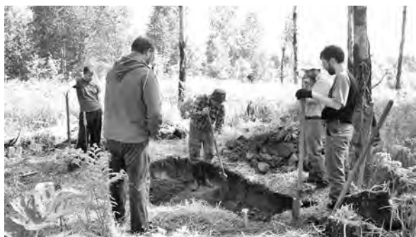
В экспедиции участвовали и прихожане Новокузнецкого храма святых равноапостольных Кирилла и Мефодия.