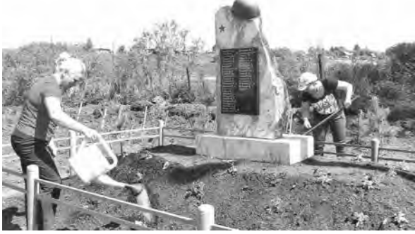
Новый памятник воинам Великой Отечественной – сорок восьмой по счету в селах Новокузнецкого района.