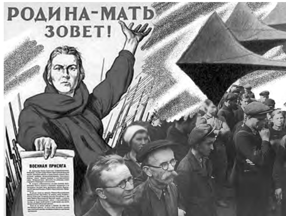
Коллаж Андрея Горшкова.