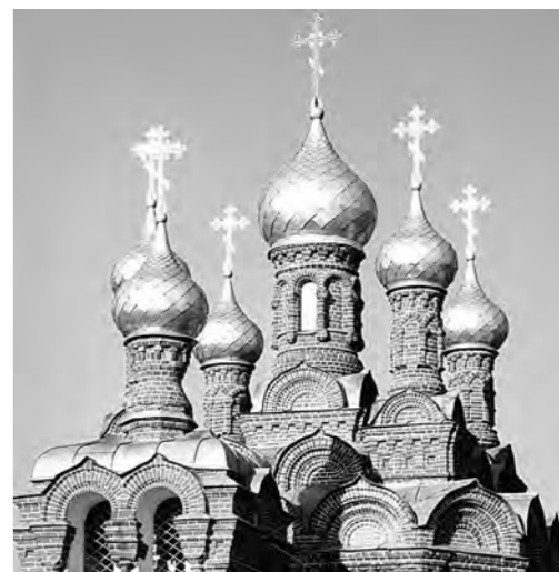
Один из самых красивых храмов на всей Транссибирской железнодорожной магистрали.

Специалисты отмечают, что небольшое по своему объему здание церкви из красного