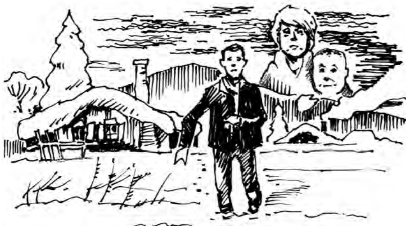
Рисунок Андрея Горшкова.

Этим детям, если вообще уместно так сказать, еще повезло. Не так давно по центральному телеканалу показывали подобную историю: так же оставленная матерью в холодном сарае девочка лишилась в результате обморожения обеих ног. Впоследствии ее удочерили хорошие люди,