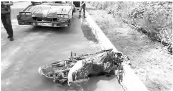
Всего с начала лета на дорогах Кузбасса произошло 79 ДТП, в результате которых 43 человека травмированы и двое погибли.