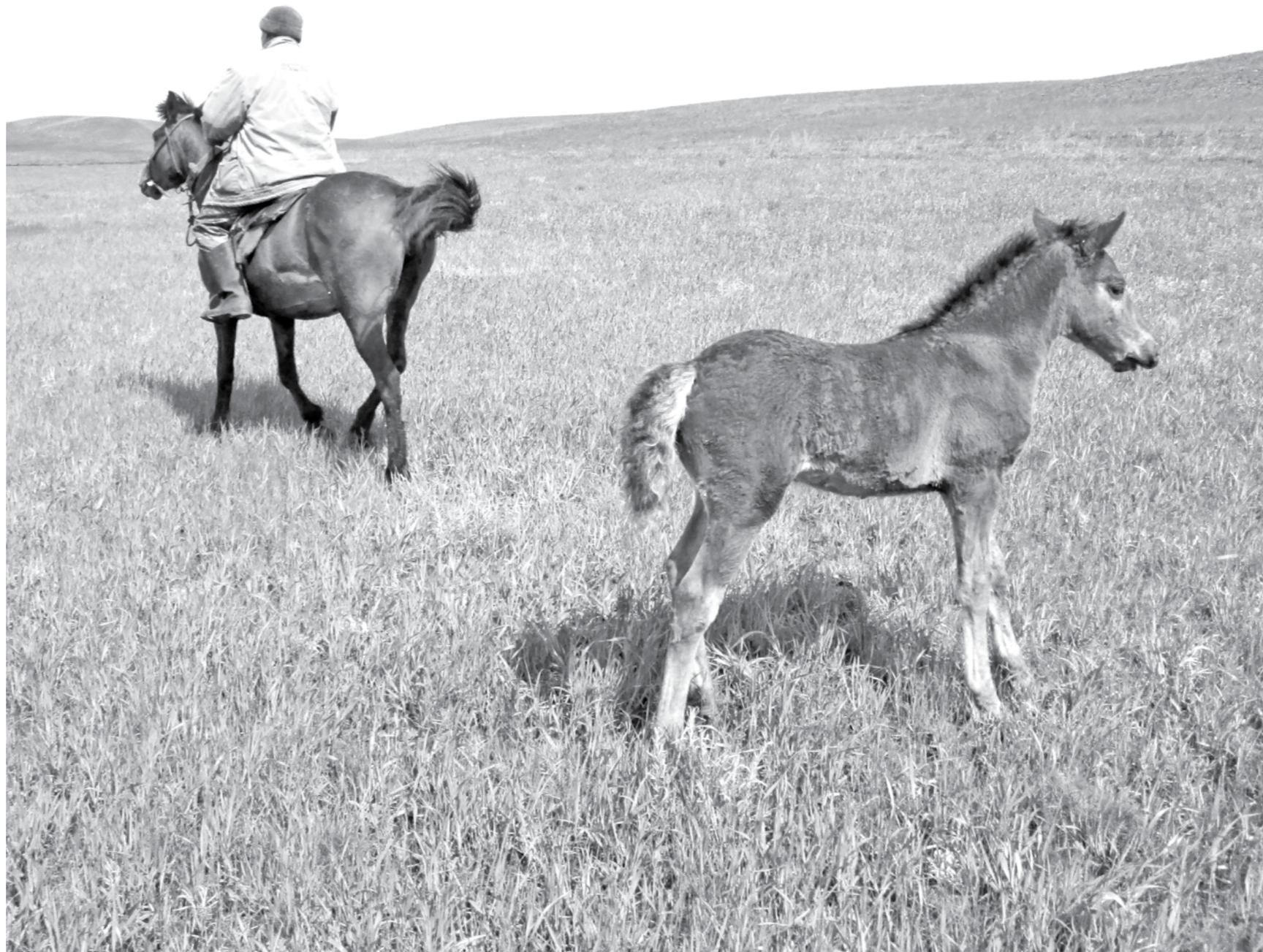
Байатские сопки, ещё не тронутые угледобычей.

Новое направление приобретает сегодня взаимодействие между угольщиками и экологами. Угольные компании и природоохранники все чаще садятся за стол переговоров, чтобы обсудить важные вопросы. И даже в ряде случаев уже приходят к разумному компромиссу.