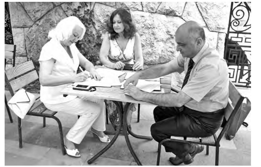
Подписание договора о сотрудничестве.