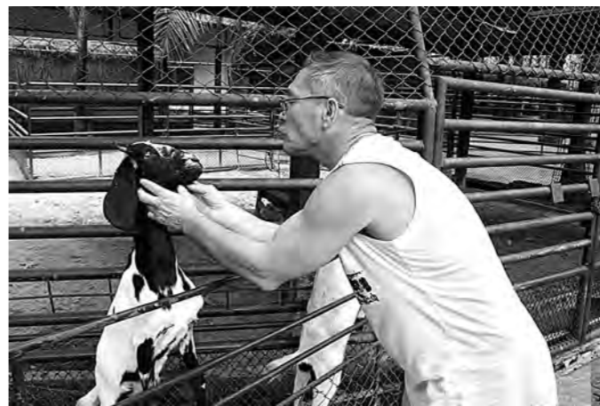
Без языкового барьера.

Несколько лет назад она похоронила спившегося сына,