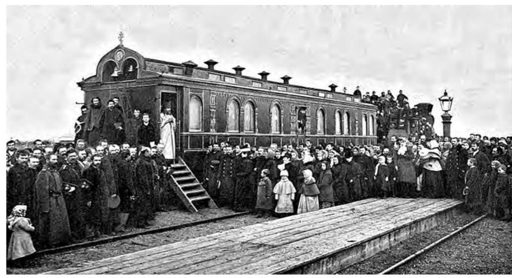
Раньше по строящейся железнодорожной магистрали курсировал специальный вагон, стилизованный под церковь.