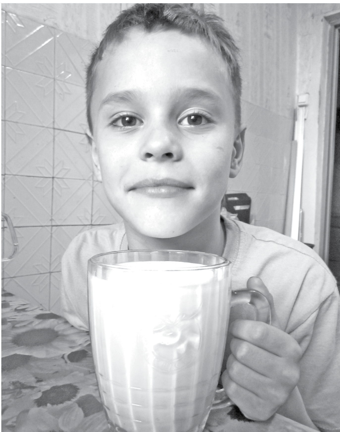
Местное молоко с бабушкиного подворья.

Как помочь местному производителю выйти на местный рынок?