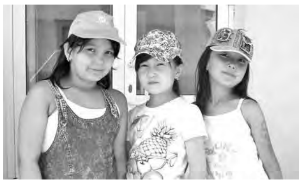
В «Сибирскую сказку» приехали дети, совсем не знающие русского языка или знающие его гораздо хуже своих российских сверстников.