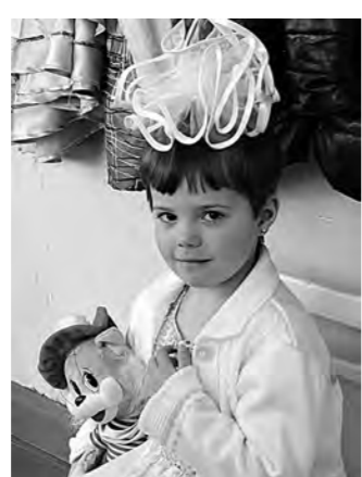
▲ Где моя мама?

В начале сухие цифры. Из 306 осужденных женщин, отбывающих разные сроки наказания в колонии №50, 162, имеют несовершеннолетних детей. 114 мальчиков и девочек воспитываются в казенных, то есть детских домах, а 48 находятся на попечении родных и близких.