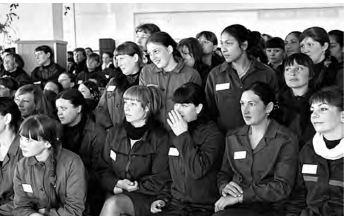
▲ Зал из особых зрителей.