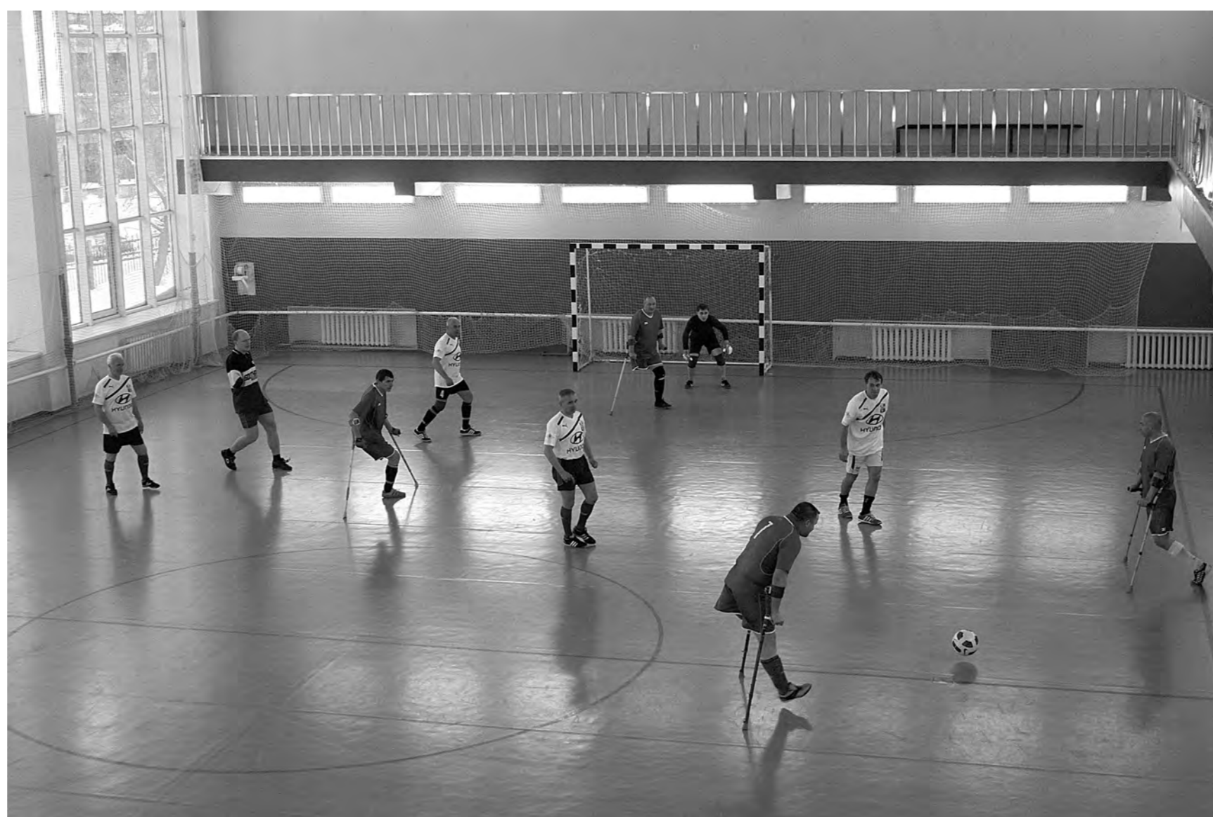
Товарищеский матч по футболу между «Сибиряком» и «Кузбассом» в декабре 2013 г.

Городские клубы по месту жительства в областном центре ищут и находят новые формы работы