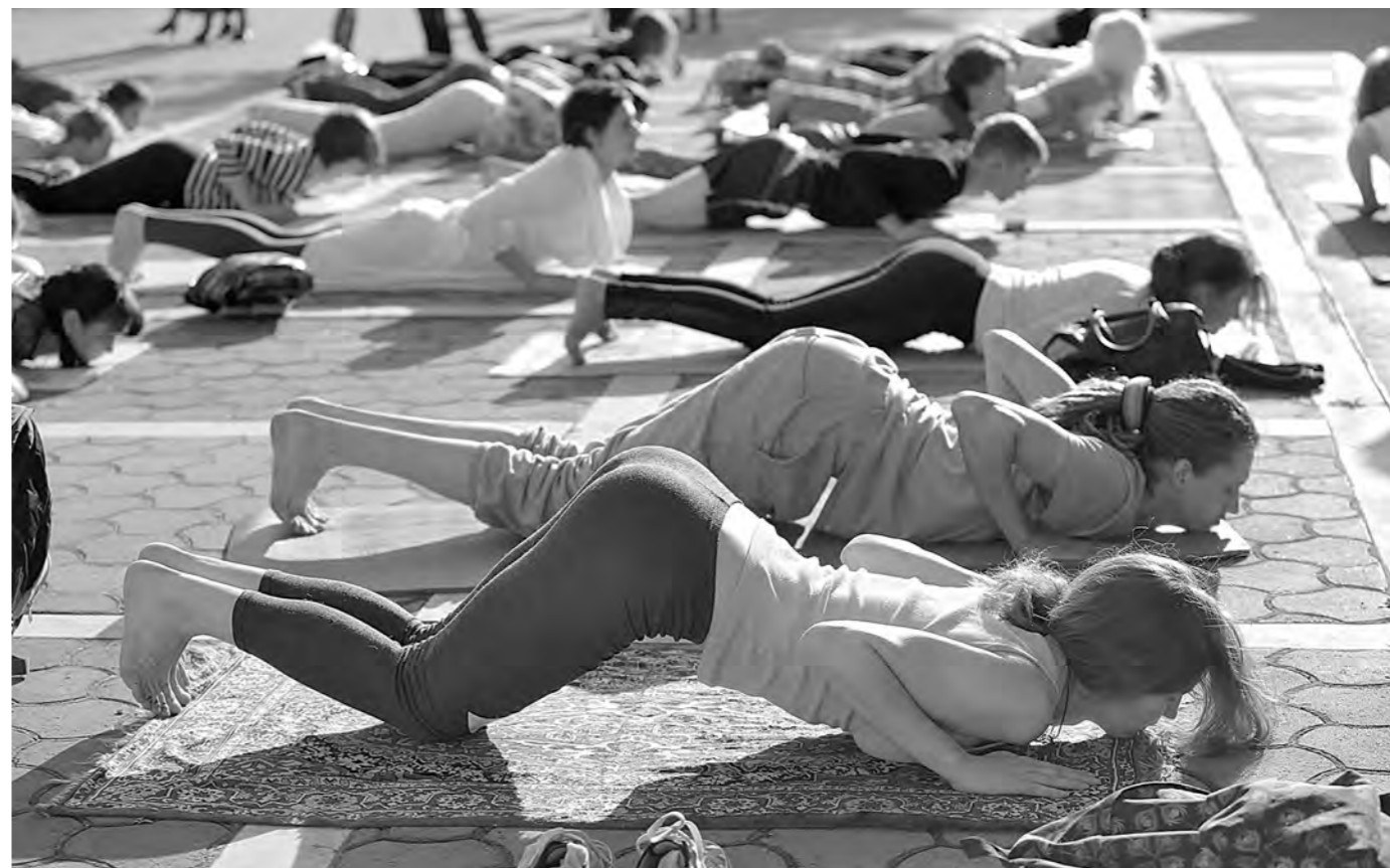
ЙОГА «ВЫХОДИТ» В НАРОД. В саду Металлургов Новокузнецка состоялась массовая практика йоги, на которую были приглашены все желающие. Несколько десятков профессионалов и любителей расстелили коврики прямо на свежем воздухе. Кроме занятия йогой, можно было насладиться ароматным напитком из алтайских трав, пройти мастер-класс игры на древнем инструменте – дарбукке, а также спеть мантры на санскрите. По задумке авторов, целью мероприятия стало формирование экологического сознания.