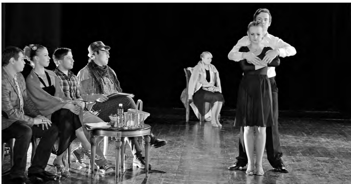
Члены жюри в спектакле наверняка играли свои роли с чувством ностальгии.

спектакль, который мог бы прожить достаточно долгий срок на подмостках какого-нибудь заведения типа Дома актера. У нас в Кемерове жанром клубного спектакля регулярно занимается только театр «Ложа»: отдельные эксперименты в этом направлении предпринимал Кемеровский театр для детей и молодежи. Для большого города, пожалуй, маловато. Тем более что хореографический язык спектакля очень демократичен и понятен абсолютно всем возрастам и социальным прослойкам. Олег ТРЕТЬЯКОВ.