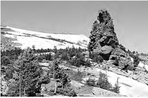
■ А на вершине Мустага все еще лежит снег.