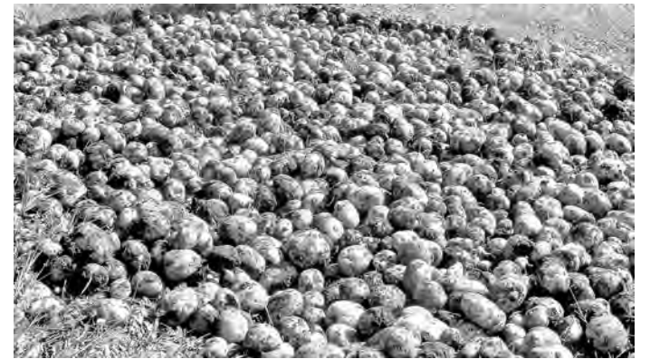
■ Сорты овощей и бахчевых, выведенные специалистами Западно-Сибирской овощной опытной станции, до сих пор успешно выращиваются в Кузбассе.