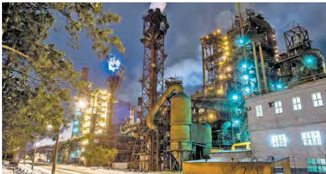
■ Три доменные печи ЕВРАЗ ЗСМК за сутки выдают около 17 тыс. тонн чугуна.

21 июля 1967 года была пущена доменная печь №2. Она значительно отличалась от Запсибовной: на ней было предусмотрено испари-