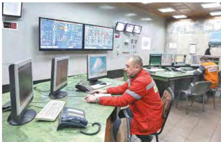
■ Пульс управления: диспетчер контролирует работу доменной печи №3.

Одолели и ее: еще в 1970 году доменные печи Запсиба по производительности занимали второе место в СССР, в 1973-м доменный цех достиг проектной мощности пере-