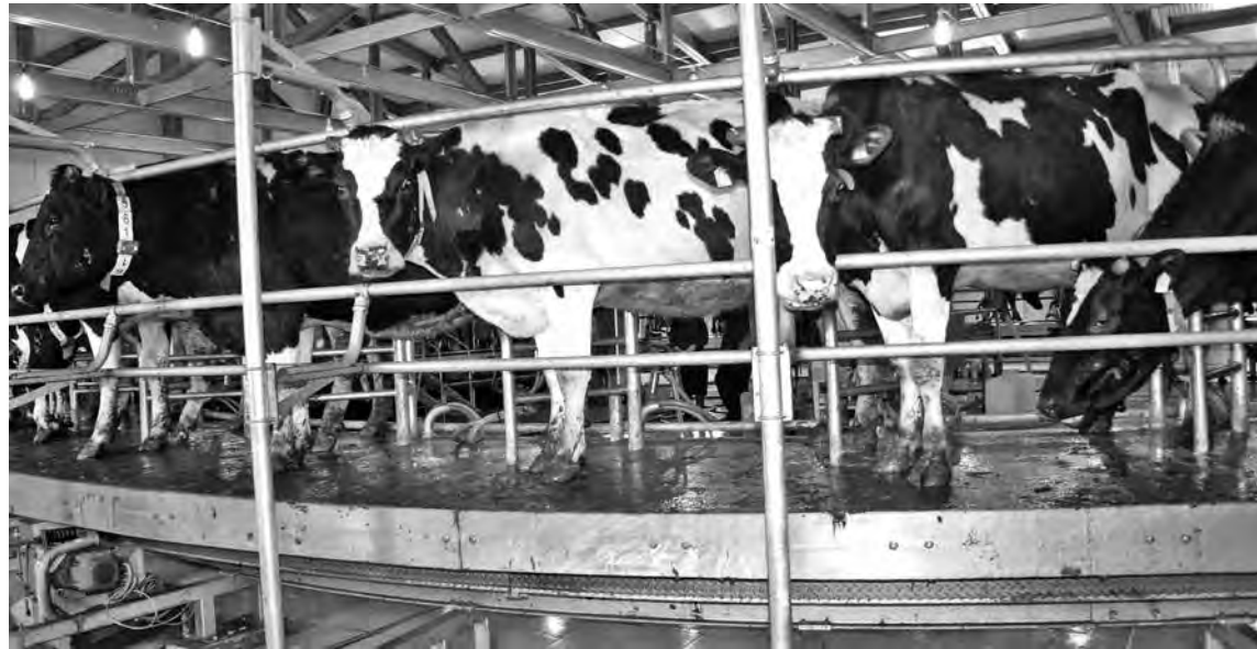
■ На «карусели».