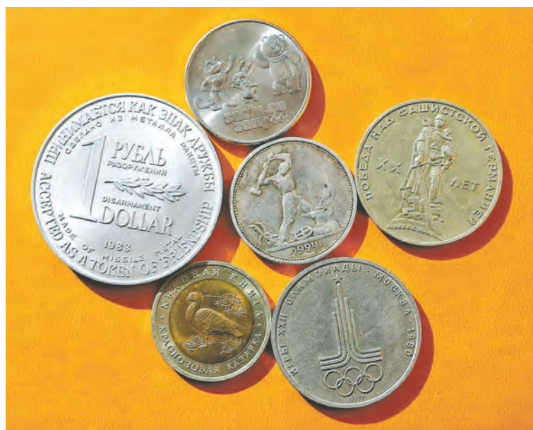
■ Монеты надолго сохраняют историю страны.