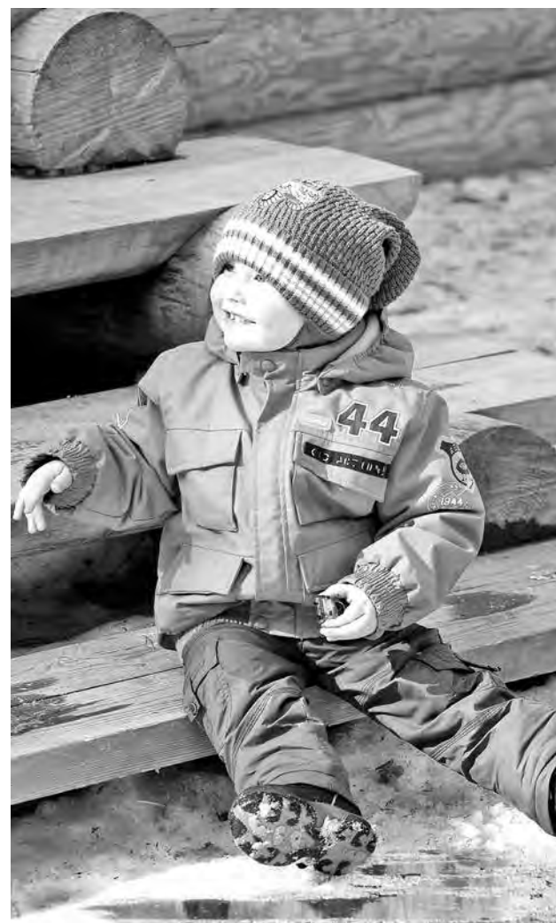
■ Весенний денек.