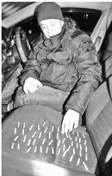
■ В салоне иномарки полицейские обнаружили внушительную партию «соли», уже расфасованной для разовых «закладок».

Когда предположения о причастности бывшего автоугонщика к наркотор-