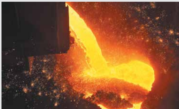
■ День выдачи первой плавки чугуна – 27 июля 1964 года – считается днем рождения Запсиба.

Имя: Домна. Отчество: Запсибовна. Фамилия: Комсомольская. Год рождения: 27 июля 1964 года. Место рождения: город Новокузнецк, Антоновская площадка. Рост: гигантский (76 метров). Вес: богатырский (18 тыс. тонн). Аппетит: отличный. Суточный рацион – тысячи тонн руды, кок-