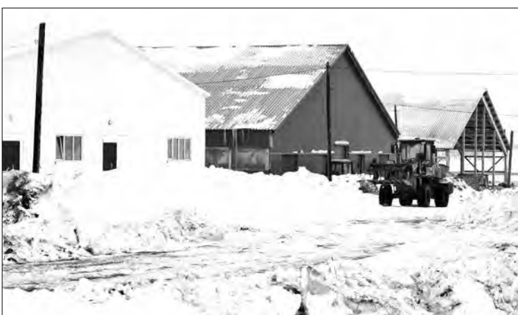
■ На васьковском комплексе.