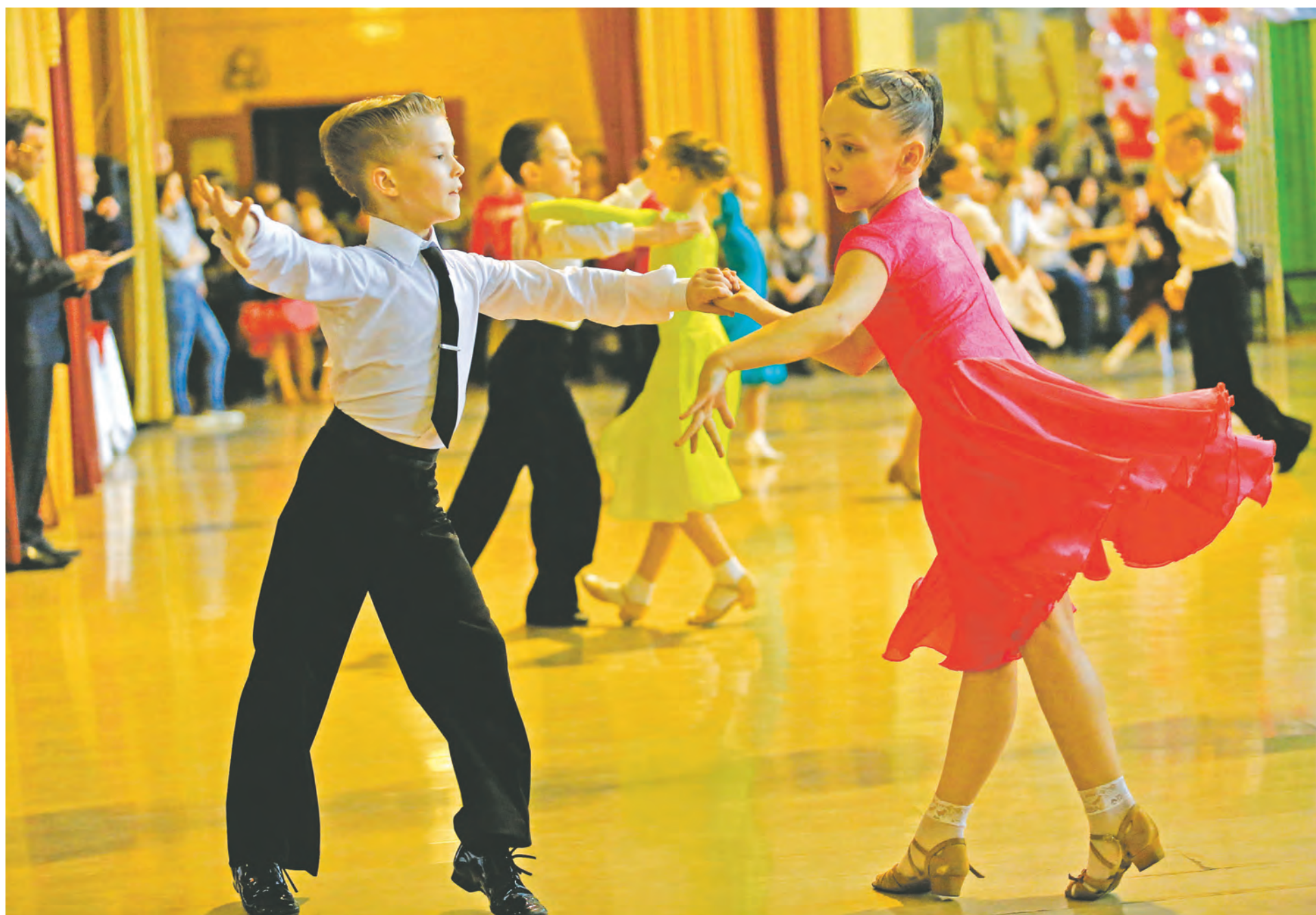
■ Танцевальные марафоны в Новокузнецке проходят зажигательно даже среди представителей младших возрастных групп.