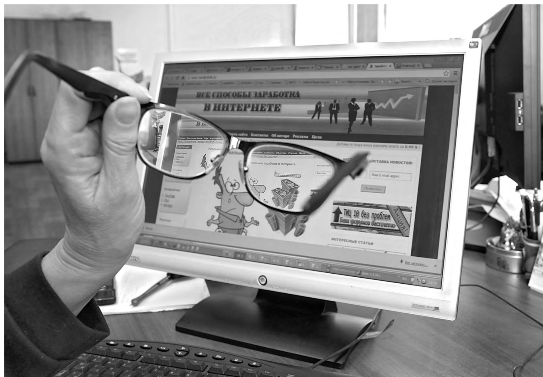
Для многих кузбассовцев важен вопрос не только, где заработать, но и как правильно потратить деньги.

Зря говорят, что считать чужие деньги неприлично. И не только потому, что это очень интересно нам, обывателям. Для официальных должностных лиц это и вовсе необходимо.