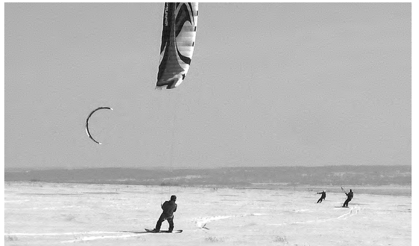
УПРАВЛЕНИЕ ЗМЕЕМ – ПОЛНЫЙ КАЙТ. Теплая погода, ветер и снег – наиболее подходящие условия для кайтеров, у которых сейчас самый разгар сезона для натаяния. Кайт еще называют управляемым воздушным змеем, с помощью которого можно передвигаться по воде, по снегу, по земле, используя любые скользкие средства. Зимой, например, это сноуборд или лыжи. Сегодня, по словам кайтеров, их в области всего несколько десятков человек, но кайтинг постепенно набирает обороты. О том, почему это не просто спорт, но и философия, «Кузбасс» расскажет в одном из последующих номеров. Оксана Панарина.