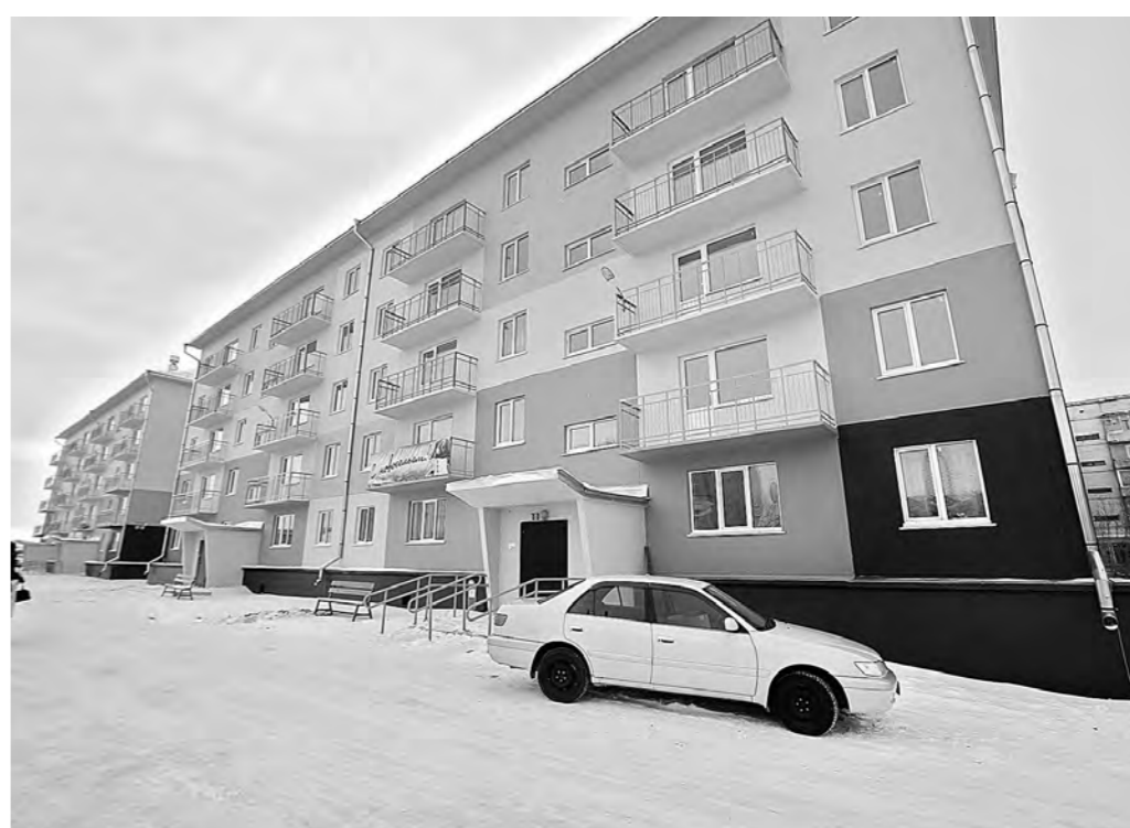
Вот в таком доме-красавце живут сегодня пострадавшие от землетрясения грамотейнцы.