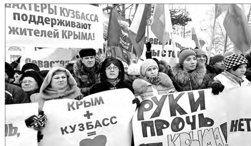
Ситуация на Украине мало кого оставляет равнодушной. На митинге люди поддержали русскоязычное население этой страны и высказались против экстремизма.