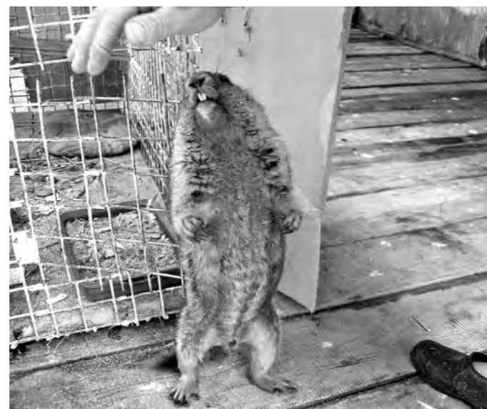
В мини-зоопарке «Томской писаницы».