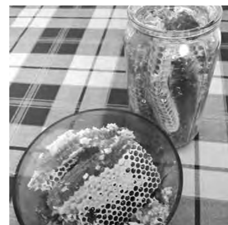
Ж-жуткая сладость!

Комплекс был запущен совсем недавно – современный, просторный, на четыре сотни коров, которые, не обращая внимания на толпу людей, жили своей жизнью. Волоко смотрели вдаль, жевали вечную жвачку, задумчиво ждали очереди к чесалкам. Да-да, для них было установлено сразу несколько буржуйских приспособлений, которые начинали вращаться и чесать спины, только пожелай. От такого удовольствия, как рассказывал животновод-фермер, у коров увеличилось молоко, аппетит, настроение