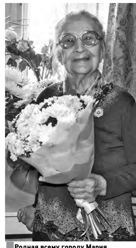
Родная всему городу Полюри Максимова.