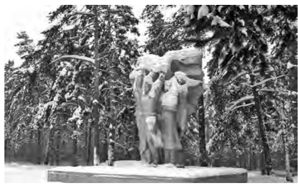
Бор застыл в ожидании...

«Однозначно необходимо придать Сосновому бору статус «особо охраняемой природной территории». Если выделить рекреационную зону (12%), как это планируется, то уверен, что через определённое время в бору начнётся строительство, т.к. «богатеньки Буратино» пойдут на любые взятки, чтобы получить клочок земли в аренду»