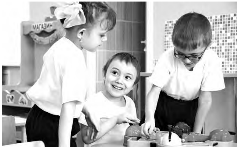
■ В «Светлячке» тепло, светло и уютно.

В детсаду «Светлячок» созданы необходимые условия для всестороннего развития личности