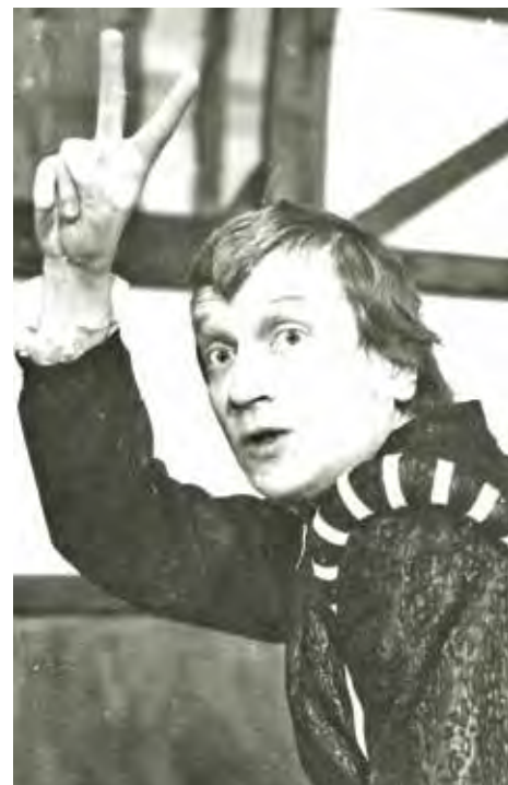
В спектакле «Виндзорские проказницы».