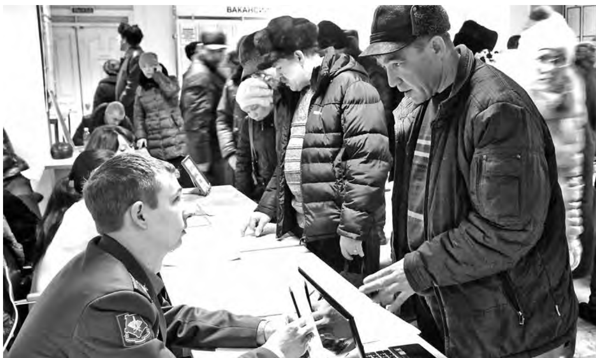
■ Большой спрос на ярмарке вакансий на гражданские специальности.