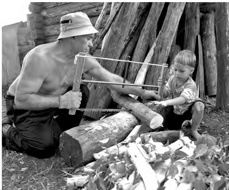
■ Вот так делают настоящих мужчин!

– У нас трое пацанов. Гордимся: всем образование дали. Теперь семья у каждого своя, внуков подарили нам. Как воспитывали? Своим примером. Мать – лаской, заботой. Я – трудом. Пытался всему научить, чтобы в руки будущим женам