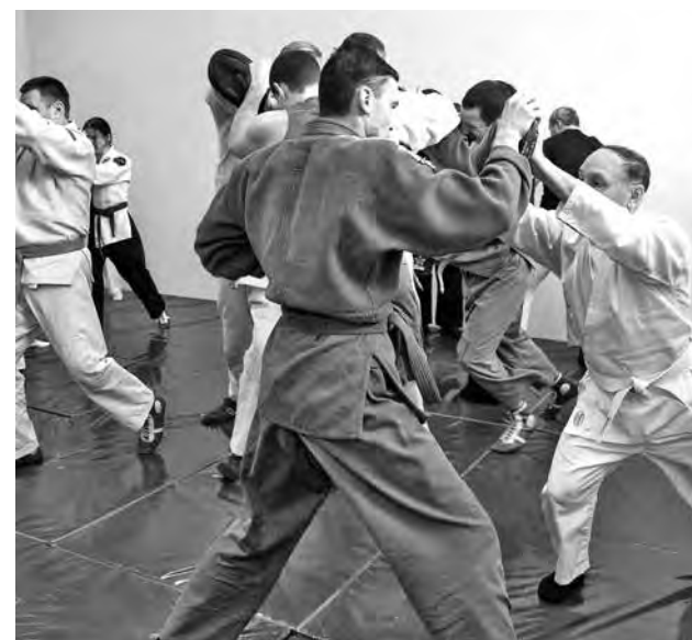
■ Джиу-джитсу: защита от нападения.