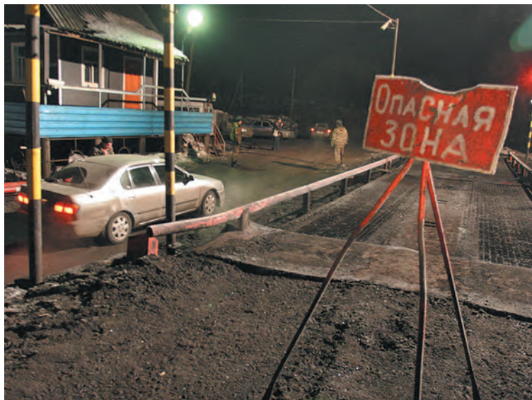
Тогда, в марте 2007-го, трудно было представить, что дело по «Ульяновской» может быть «спущено на тормозах»...