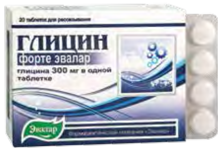
«Эвалар» – марка №1 в России*

www.evalar.ru. Спрашивайте в аптеках города, а также по телефонам: (3842) 53-74-66, 51-26-74.