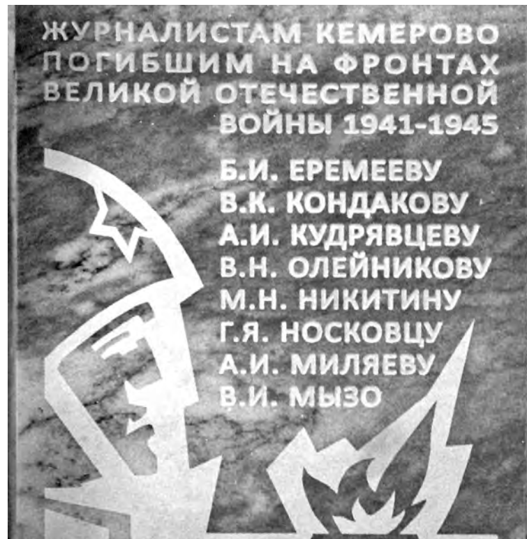
■ Мемориальная доска – точная копия хранящейся в фондах Кемеровского областного краеведческого музея, изготовленная специалистами «Ветеранской ритуальной компании Кузбасса».