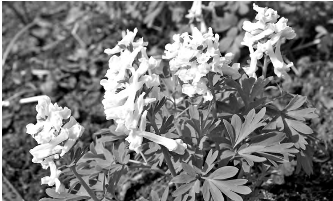
■ У хохлаток масса достоинств: неприхотливы в уходе, цветут ранней весной, образуя пышные ковры, быстро размножаются, морозоустойчивы, не страдают из-за болезней и вредителей.

При пересадке надземная часть легко обрывается, но не пугайтесь –