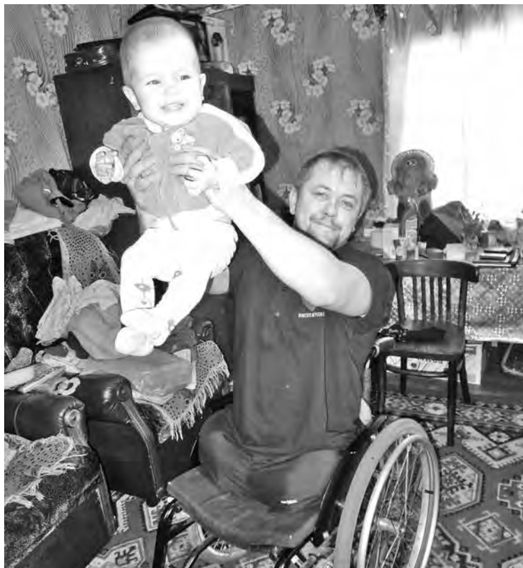
■ Когда родилась дочка, хоккеист без ног, не раздумывая, назвал ее Виктория (Победа).

...По шахтерскому поселку, прижавшемуся к теперь уже закрывшейся шахте, ходят рассказы об отцах, дедах и прадедах и силе духа шахтеров.