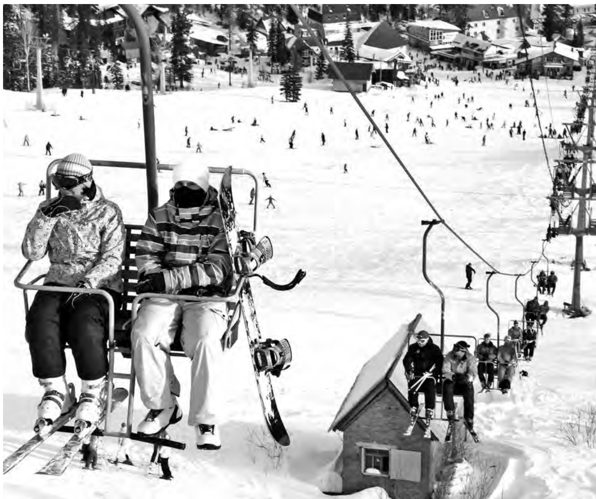
■ В Таштагольском районе число туристов растет с каждым годом. Так, в зимний сезон 2011-2012 гг. на здешних горнолыжных комплексах побывало 330 тыс. человек, а в 2012-2013 гг. – 512 тысяч.