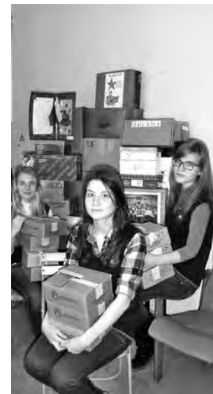
■ Фото Виктории Кисиль.