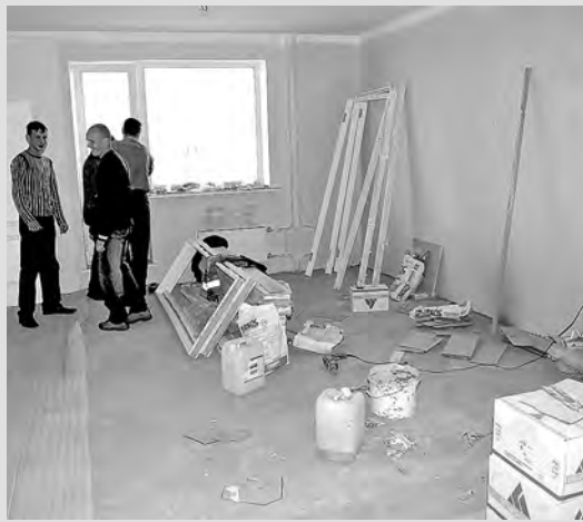
■ Сейчас выбор у отделочников гораздо больше...

Это сейчас в строительных магазинах просто глаза разбегаются от ассортимента, и проблема не где найти что-либо, а что выбрать из той красоты, которая предлагается повсеместно. К тому же,