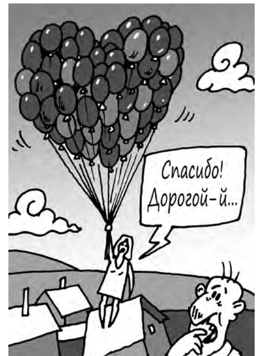
Рис. Андрея Горшкова.

— На День святого Валентина супруг подарил мне то, о чем я давно просила: сертификат на фотосессию с хаски, катание на хаски и другие забавы-человечьи радости. Очень, очень люблю этих собак! А сейчас, считаю, еще и самое подходящее время: морозы отступили, снег пошел, думаю, в эти выходные и поеду в гости к ним. Подруги, очеловечивленные общением с четвероногими, мне все уши прожужжали, как это замечательно. А не очеловечивленные пусть теперь завидуют!