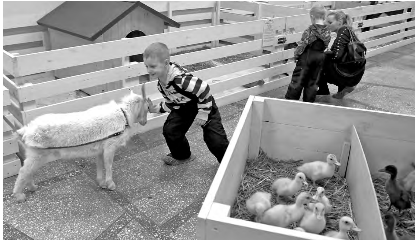
«ТРОГАТЕЛЬНЫЙ» ЗООПАРК. Двух пятнистых оленей, ненгуренка, енотов, скунса, ежей, цыплят, утят и прочую живность можно не только покормить, но и потрогать, погладить и даже взять на руки в частном контактно-зоопарке, который открылся не так давно в здании Новокузнецкого цирка. Ребятишки в восторге. Организаторы уверяют, что питомцы абсолютно безопасны. Они выращиваются в спелитомниках, в условиях постоянного общения с человеком, своевременно проходят вакцинацию.