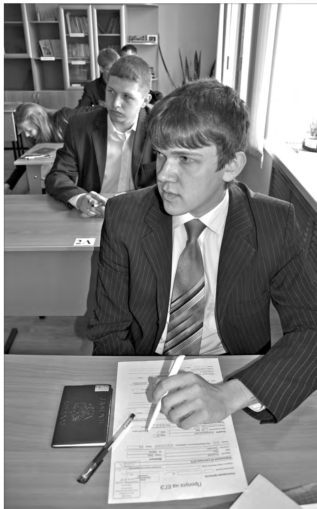
Выпускники одиннадцатых классов нынешнего года грядущие выпускные экзамены никаким сюрпризом не готовят. В отличие от их младших товарищей, оканчивающих девятый класс.

Экзаменов станет меньше, но сдать их будет труднее