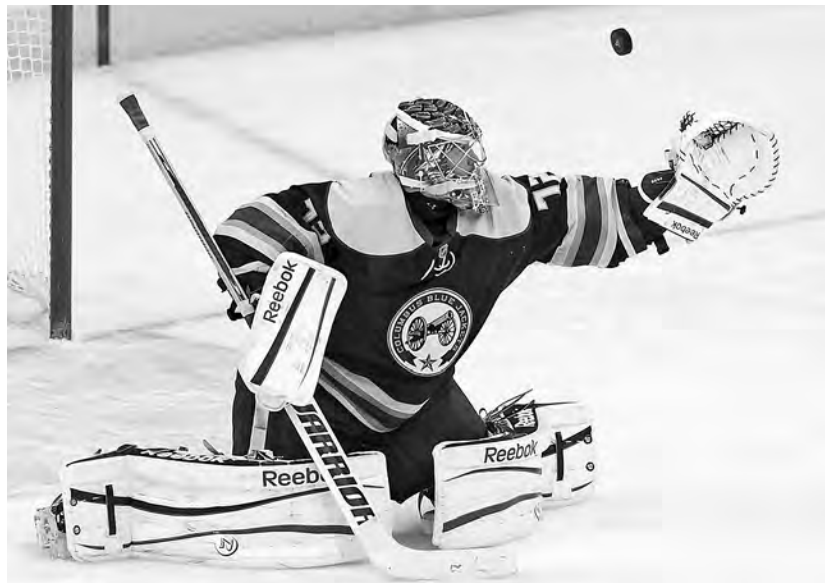
Воспитаник новокузнецкой хоккейной школы вратарь олимпийской сборной России Сергей Бобровский, по мнению экспертов, накануне Игр «набрал потрясающую форму».

Особенность регламента турнира в том, что после предварительного этапа борьбу продолжат все команды: напрямую в четвертьфинал выходят три победителя групп и лучшая из сборных, занявших вторые места. Остальные команды сойдутся в квалификационном раунде плей-офф.