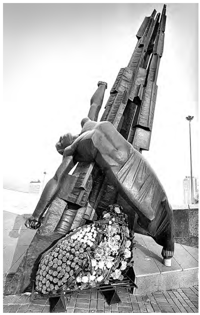
20 ноября 2003 года на Пионерском бульваре Кемерово торжественно открыли памятник кузбассовцам, погибшим в локальных войнах и вооруженных конфликтах (скульптор Валерий Треска).