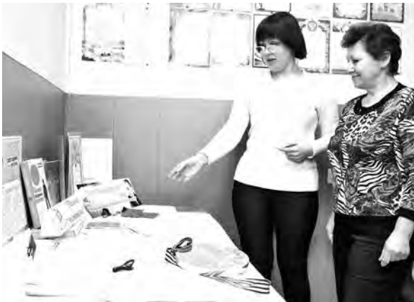
■ В Кемеровском обществе слепых сохранились личные вещи основателя этой организации Владимира Ворошилова.