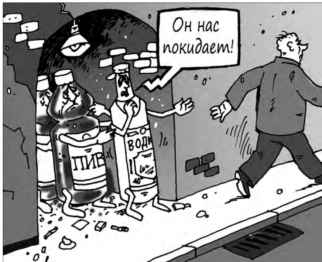
Рисунок Андрея Горшкова.