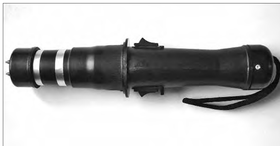
■ Таковыми необычными сувенирами друзей порадовать не удастся – их изымают на границе.