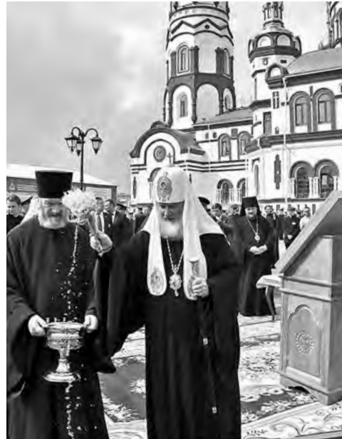
Важные события года в работах наших фото-корреспондентов Дмитрия Белкина, Федора Баранова и Ирины Слуквиной.

Серьезно работаем по повышению доступности жилья. Ежегодно по нашей областной программе выделяем тысячу льготных жилищных ссуд (под 0, 3, 5% годовых). Вводим новые доходные дома, квартиры в них