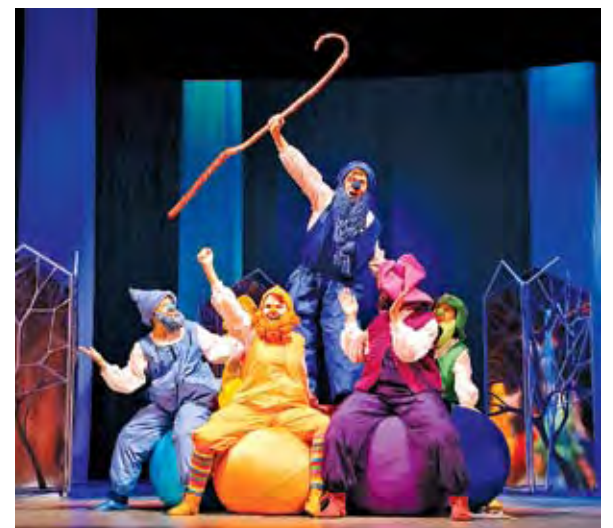
Сцена из спектакля «Белоснежка и семь гномов».

Третья: страшные сцены этого спектакля получились очень уж натуралистичными, по-настоящему страшными (я имею в виду вынос из зала