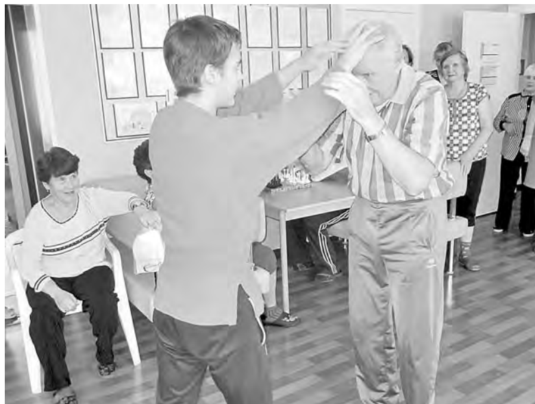
Пенсионеры из Новокузнецка учатся приемам самообороны.

Впервые в Кузбассе в этом году за неплату штрафа к должникам стали применять новый вид административного наказания – обязательные работы. А в целом, конечно, этой теме было уделено много