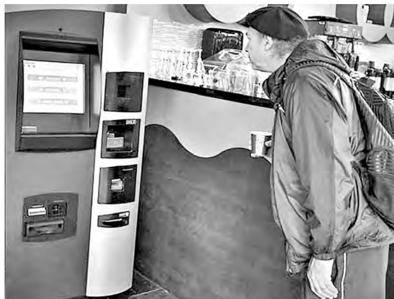
Первый в мире банкомат биткойнов в Ванкувере.

С наступающим Новым годом, дорогие читатели!