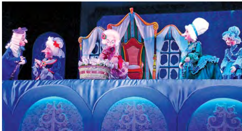
Сцена из спектакля «В ночь под Новый год».

Красивые, изобретательные декорации (художник Виктор Акимов), молодые актеры, с удовольствием танцующие, кувиркающиеся, задирающие друг друга (дело происходит в лесной школе, и большинство персонажей – грибы да ягоды). Видимо, юность большинства исполнителей не дает им забыть собственные школьные романы, ссоры, примирения – во всяком случае, во все это они играют с большим удовольствием.