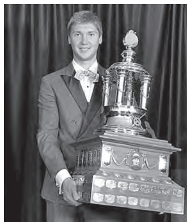
Воспитанник новокузнецкой хоккейной школы Сергей Бобровский – первый вратарь из стран бывшего СССР, завоевавший приз лучшему голкиперу регулярно чемпионата Национальной хоккейной лиги.

«В Новокузнецке испытываю ностальгию, вспоминая, как тренировался здесь в детстве, но это хорошее, доброе чувство, – рассказал Сергей в интервью официальному сайту «Металлурга». – Хочу поделиться с ребятами опытом. Считаю, что, чем больше ты отдаешь, тем больше получаешь вза-