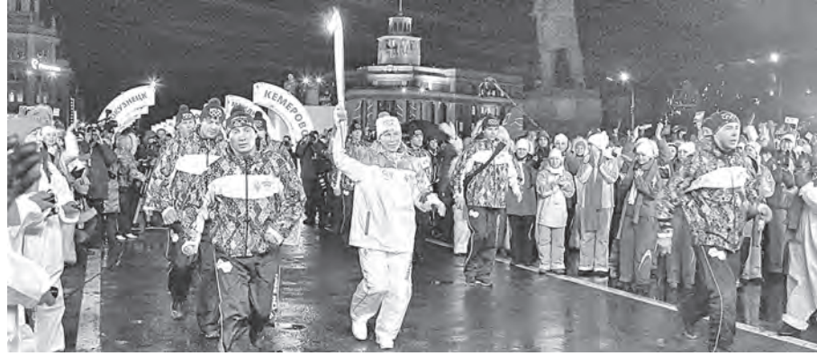
Эстафета олимпийского огня в Кемерове.