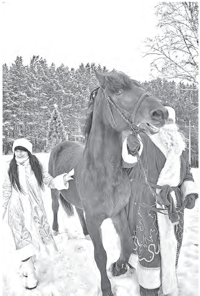
На одном из лучших коней Кузбасса не прочь прокатиться и Дед Мороз со Снегурочкой.