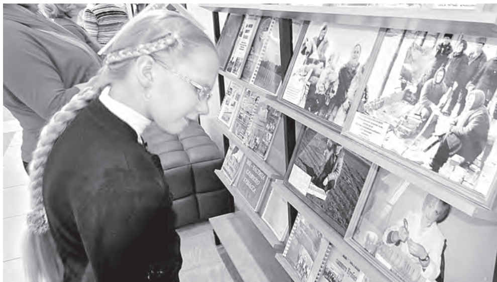
Интересно взглянуть на свою фотоработу со стороны.