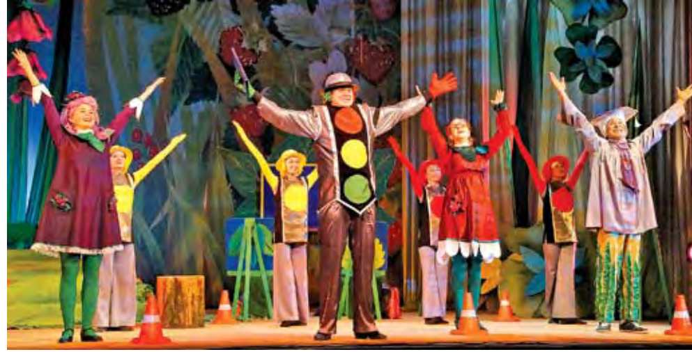
Сцена из спектакля «Здравствуй, Светофорик!»