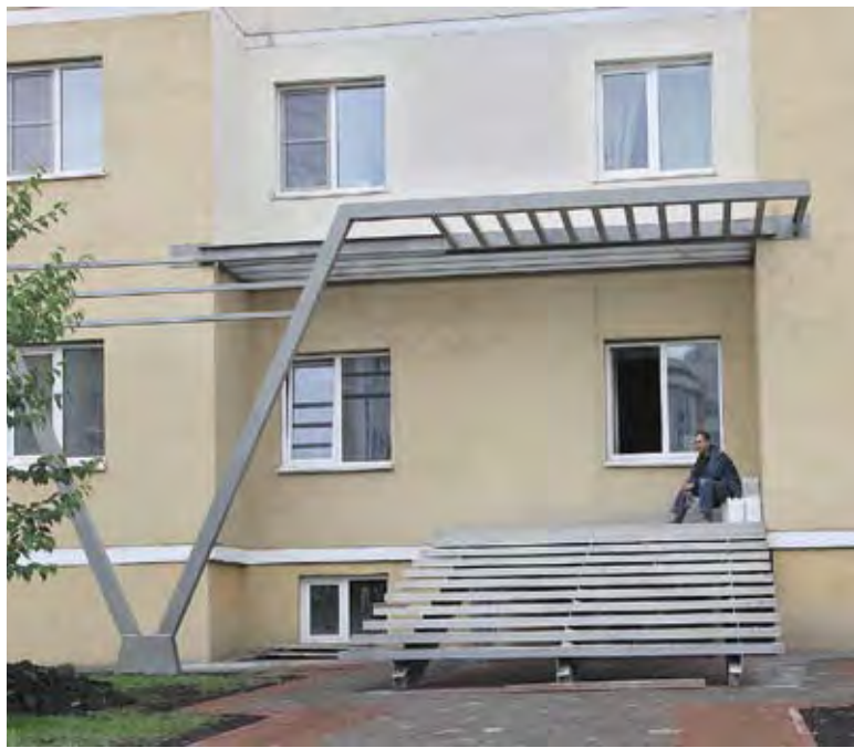
ОКОНчательно заблудился.