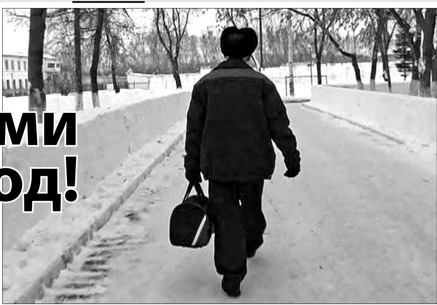
Из тех, кто отбывает в Кузбассе наказание за решеткой, по формальным признакам под амнистию подпадают 49 человек.