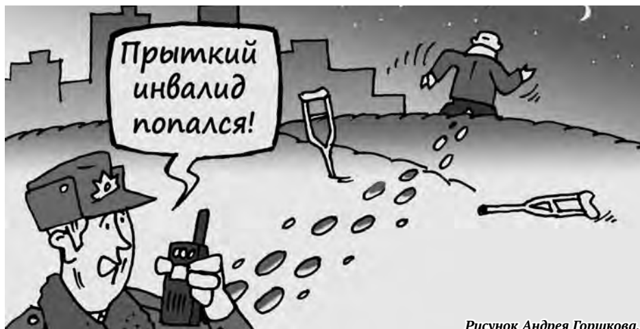
Рисунок Андрея Горшкова.

В ходе дальнейшего изучения истории «болезней» оперативники транспортной полиции выяснили, что Рогозин и Головкин наладили побочный