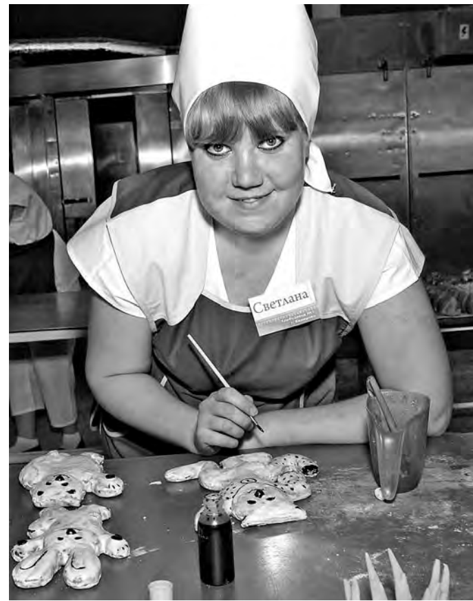
А готовые прянички можно разукрасить...

В наступающем 2014 году участниками мероприятий по профконсультированию, психологической поддержке и социальной адаптации станут 46 тыс. кузбассовцев.