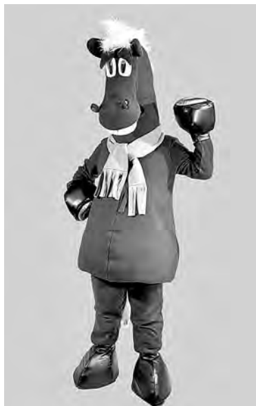
Костюм символа года – Лошади, изготовленный в Юргинском технологическом колледже, будет выставлен на торги.

На прежних Рождественских благотворительных аукционах реализовано продукции профобразовательных учреждений почти на 1 миллион рублей. В этом году свою продукцию представят 57 учреждений среднего профобразования области. На аукционе и сво-