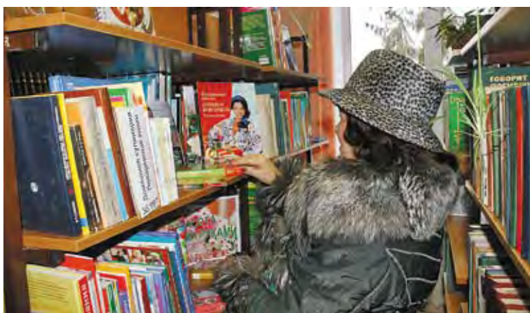
От обилия книг глаза разбегаются.