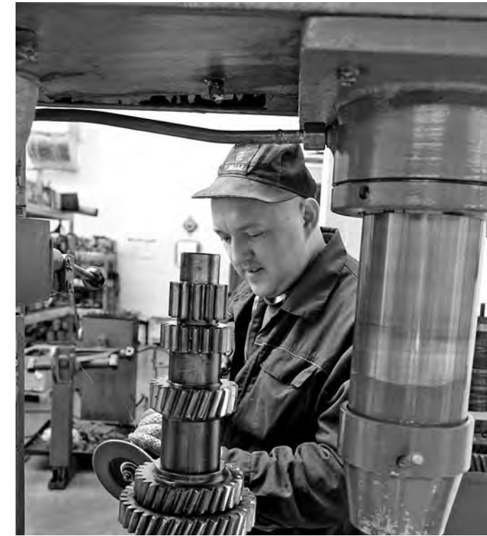
Техника требует внимания.

Реализация всех мероприятий позволит трудоустроить на новое место около 50 тыс. граждан, ищущих работу. В целом служба занятости населения готова оказать гражданам, нуждающимся в содействии, весь спектр предусмотренных услуг. Реализация мер активной политики позволит сдержать потенциальный рост безработицы в среднем на уровне уходящего года.