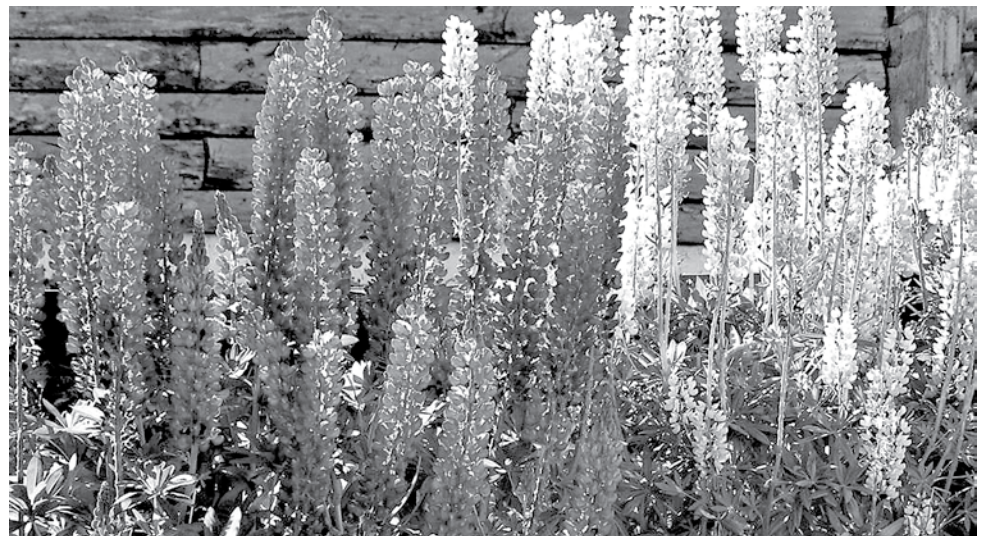
Люпин, высаженный шпалерой.

Незаменим люпин в садах, хозяевам которых недосуг заниматься тщательным уходом, — хлопот они не доставляют. Если разместить куст на лужайке,