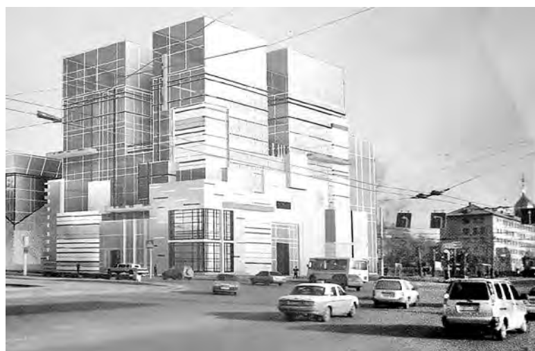
Проект общественно-делового центра на пересечении пр. Ленина и ул. Соборной (2007 г.).