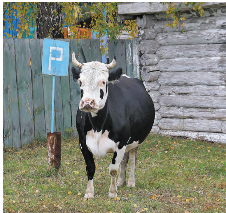
«Му-ниципальная стоянка».