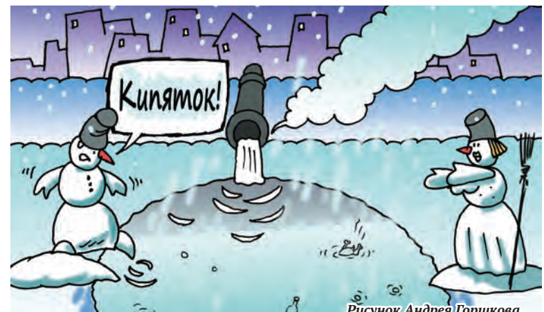
Рисунок Андрея Горшкова.

- Девушка, а можно пригласить вас в кино?