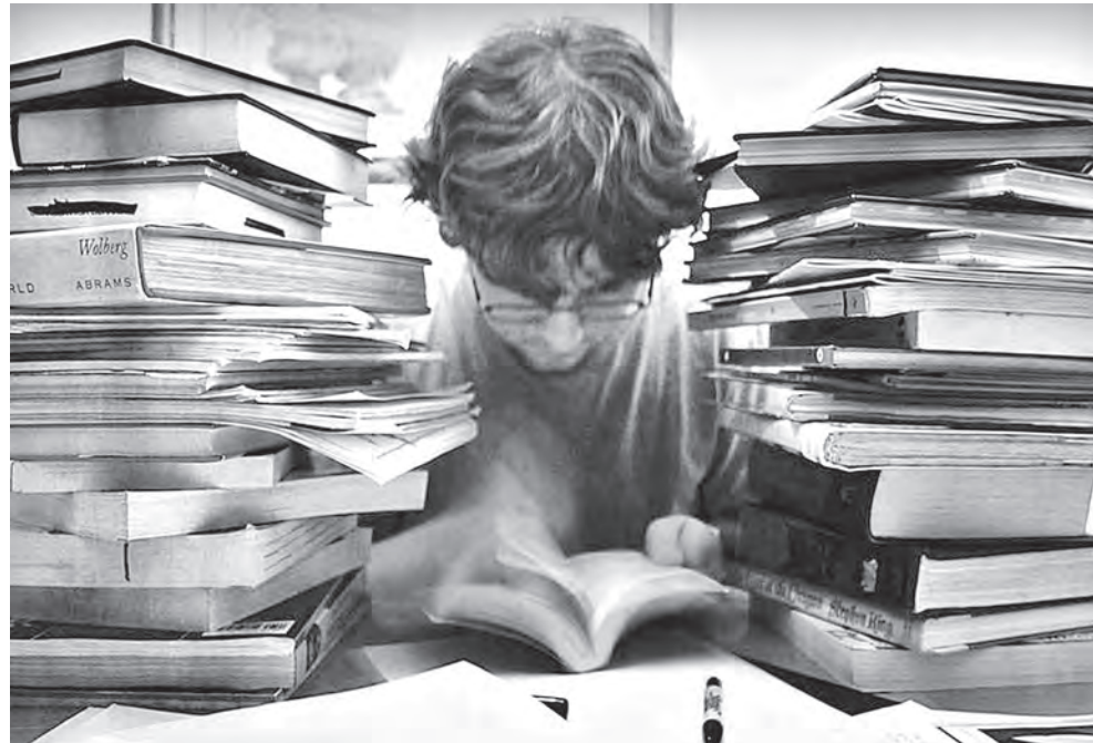
Перед поступлением липовым призерам олимпиад теперь придется потрудиться?

А некоторые педагоги вообще не знали, что результаты их учеников давно выставлены на сайте управления образования. Ждали, когда им кто-нибудь сообщит. Не дождалось. Тем временем трехдневный срок, отведенный на апелляцию, истек.