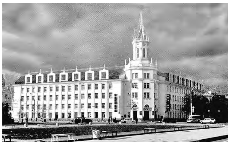
Проект реконструкции здания почтамта (2004 г.).

Можно, конечно, порадоваться и тому, что достигнуто. Например, настоящей жемчужиной нашего города стала Троицкая церковь на проспекте Химиков (архитектор Т.Федотова). Радует спорткомплекс «Кузбасс» на бульваре Строителей. Прекрасно вписан в пейзаж города памятник Эрнста Неизвестного... Но жилые кварталы не радуют планировкой и разнообразием. Так можно ли что-то изменить, чтобы своеобразие архитектурного облика нашего города не размывалось со временем, диктующим свои жестко-прагматичные подходы?