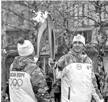
Олимпийский огонь в Кемерове!

Как всегда востребованным остается жилье. Были новоселья и на этой неделе. Сдан еще один дом в Осинниках – городе-имениннике. Ему исполнилось 75 лет. А кто столько даст?! Хорошеет, молодеет город. Да и не только Осинники держатся молодцом, несмотря на свой возраст. Целые улицы из симпатичных домов вырастают на месте бывших барачков и свалок и в других городах Кузбасса. Вот и на этой неделе в область поступило 7,6 миллиона рублей для программы переселения