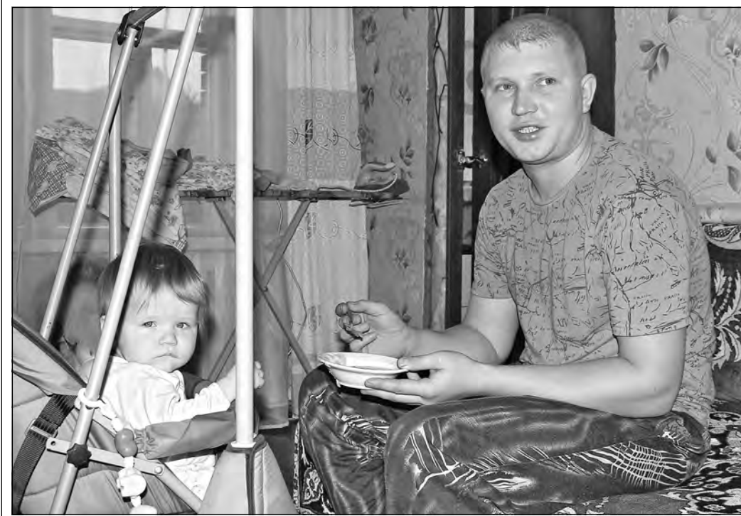
Такой вот отличный папа.